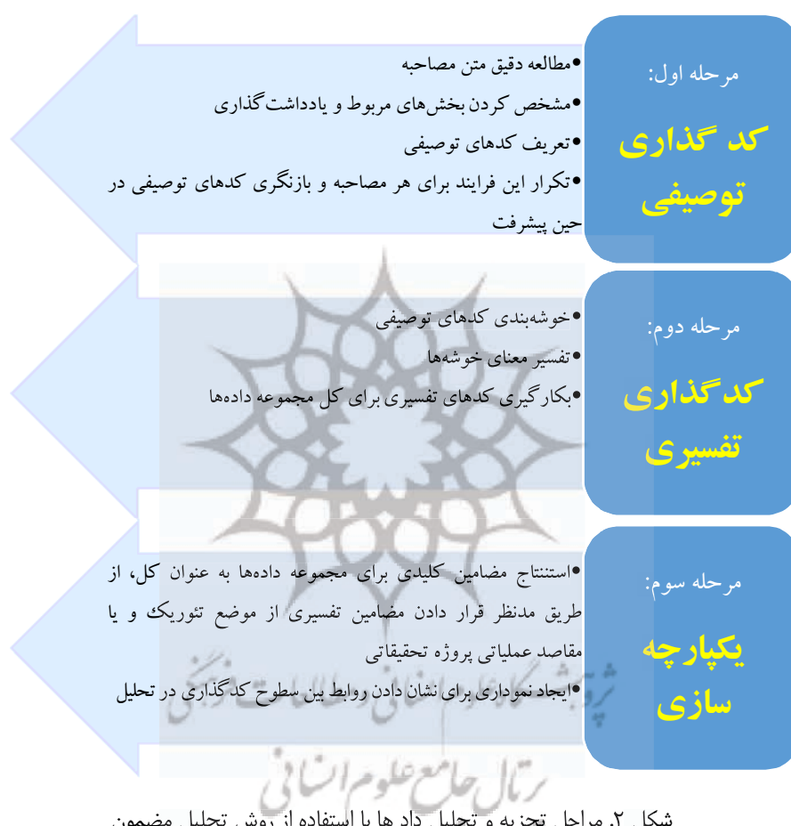
شکل ۲. مراحل تجزیه و تحلیل دادها با استفاده از روش تحلیل مضمون

مقاله نیز از این فرآیند استفاده می‌شود. این فرآیند شامل سه مرحله کدگذاری توصیفی، کدگذاری تفسیری و یکپارچه‌سازی از طریق مضامین فراگیر می‌باشد که در ادامه تشریح می‌گردد: