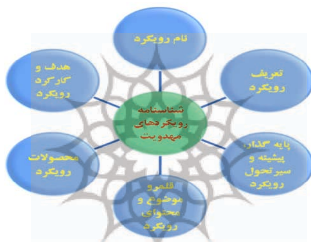
شکل ۱. شناسنامه رویکردهای مهدویت

از آنجا که این موضوعات هشتگانه برای شناساندن یک موضوع، بسیار مفید و کارا هستند، جهت معرفی رویکرد راهبردی و آینده‌نگارانه از آن‌ها استفاده خواهد شد. اما از آن رو که این رئوس هشتگانه برای معرفی رویکرد مورد نظر قابل تلفیق و تجمیع هستند، در این پژوهش، موضوعات هشتگانه در شش محور تلفیق شده و به آن «شناسنامه رویکرد» می‌گوییم. محورهای تلفیقی جهت تدوین شناسنامه رویکرد عبارتند از: