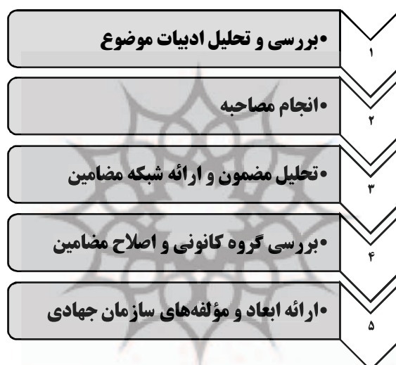
شکل ۱. فرآیند پژوهش

تجزیه و تحلیل قرار گرفته است. در وهله نخست کدگذاری باز انجام گرفت، سپس از کنار هم قرار دادن کدهای اولیه مفاهیم ساخته شد و مقوله‌ها نیز از ربطدهی مفاهیم صورت گرفتند. ابتدا مضامین اولیه استخراج شد و برای مصاحبه‌شوندگان ارسال گردید و نظرات اصلاحی آنان اعمال گردید و در مرحله بعد در جلسه گروه کانونی که با حضور تعدادی از مصاحبه‌شوندگان و تعدادی از اساتید دانشگاه مورد اعتبارسنجی و تأیید قرار گرفت. این فرآیند به صورت مختصر در شکل شماره ۱ قابل مشاهده خواهد بود.