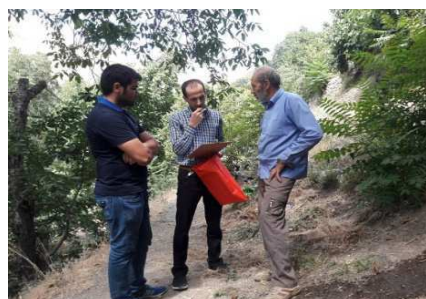
شکل ۲: جمع آوری پرسش نامه در محدوده مورد مطالعه.

تحقیق حاضر رویکردی توصیفی-تحلیلی دارد و روش گردآوری داده‌ها، میدانی و آماری است که ماهیت آن کاربردی است، در حال حاضر کل جمعیت ساکن روستایی در بخش کن سولقان طبق اطلاعات مرکز آمار ۹/۸۲۴ نفر است که وسعت ۳۸۰ کیلومتر مربعی را در اختیار دارند بنابراین جامعه آماری پژوهش را خانواده‌های ساکن در روستای سنگان (باغ دره) تشکیل داده است. روش نمونه گیری پژوهش، باتوجه به اینکه فهرست کاملی از افراد جامعه در دسترس نبود از روش نمونه گیری خوشه‌ای استفاده شد بدین منظور از میان خوشه‌ها به تصادف نمونه گیری‌ها به عمل آمد. در ذیل نمونه هایی از روش میدانی جمع آوری داده ارائه میگردد: