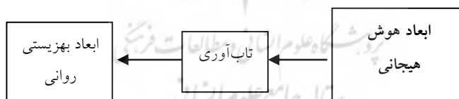
شکل ۱: مدل مفهومی پژوهش حاضر

مرور پژوهش های انجام شده در مورد عوامل موثر بر بهزیستی روانی، حاکی از آن است که بیشتر این مطالعات به بررسی ارتباط ساده یک یا چند متغیر با بهزیستی روانی پرداخته اند، بنابراین، با توجه به عدم مشاهده پژوهشی که رابطه ابعاد هوش هیجانی با ابعاد بهزیستی روانی در دانش آموزان را مورد بررسی قرار داده و در این بین سهم متغیرهای واسطه ای را مشخص کرده باشد و نیز با عنایت به نقش مهم هیجانات و عواطف در زندگی و حفظ و ارتقای سلامت و بهزیستی و نیز نقش مهم تاب آوری در جامعه پراسترس کنونی، پژوهش حاضر به بررسی نقش واسطه گری تاب آوری در رابطه بین ابعاد هوش هیجانی و ابعاد بهزیستی روانی در دانش آموزان پرداخته است. بر این اساس مدل مفهومی پیشنهادی پژوهش حاضر که در شکل ۱ نشان داده شده، شامل ابعاد هوش هیجانی به عنوان متغیر برون زاد، تاب آوری به عنوان متغیر واسطه و ابعاد بهزیستی روانی به عنوان متغیر درون زاد در نظر گرفته شده است.