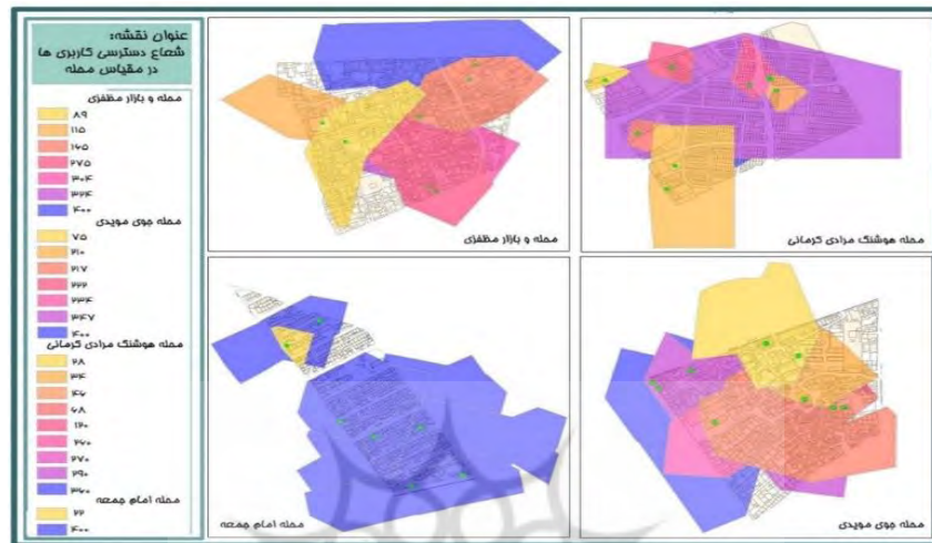
نقشه ۲: شعاع دسترسی کاربری های محله‌ای در محلات نمونه

با توجه به اصل پیاده‌مداری نوشهرگرایی که مراکز خرید روزانه و فضاهای بازرگانی باید در شعاع دسترسی ۴۰۰ متری قرار گیرند تا بتوانند پیاده‌مداری را تشویق کنند، محله امام جمعه بهترین و محله مظفری کمترین شعاع عملکردی کاربری‌ها را دارد.