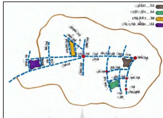
تصویر ۱: موقعیت محلات نمونه در شهر کرمان

- اصل گوناگونی مسکن: برای سنجش تنوع مسکن از ضریب همگونی سیمپستون استفاده شد. هرچه قدر میزان این ضریب به بازه ۰.۷ - ۱ نزدیکتر باشد، میزان انطباق بیشتر است. ضریب بین ۰.۵ - ۰.۳ بیانگر، انطباق متوسط و بین ۰.۱ - ۰ بمعنای کمترین میزان تنوع در موضوع مورد بررسی (در اینجا مسکن) است. به این ترتیب، ابتدا گونه‌های مسکن در محلات مورد مطالعه شناسایی و سپس با قراردادن تعداد مسکن در رابطه ۱ میزان