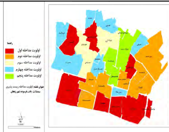
شکل ۵- نقشه اولویت‌های مداخله در محلات بافت فرسوده بخش مرکزی شهر زنجان بر مبنای گونه‌شناسی پژوهش (مأخذ: یافته‌های تحلیلی نگارنده، ۱۳۹۵)