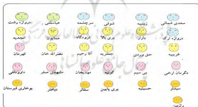
شکل ۴- چهره‌های چرنوف برای توصیف زیست‌پذیری محلات بافت فرسوده مرکزی شهر زنجان

زیست‌پذیری بافت فرسوده می‌تواند بر حسب یافته‌های فوق با آنالیز چرنوف با استفاده از مشاهدات انجام شده و به صورت چهره دو بُعدی که خصیصه‌های آن (شکل چهره، انحناهای دهان، بلندی دماغ، اندازه چشم‌ها، و غیره) با اندازه‌گیری سطوح مختلف زیست‌پذیری تعیین گردد و به منظور دسته‌بندی نهایی با مقایسه تک تک اعضای صورت با یکدیگر انجام شود. مزیت چهره‌های چرنوف، سادگی درک آن است که نیازی به دانش خاصی ندارد. همان‌گونه که در شکل (۴) مشاهده می‌گردد، محلات مختلف نسبت به سطوح مختلف قرارگیری چهره‌های مشابهی باهم دارند.