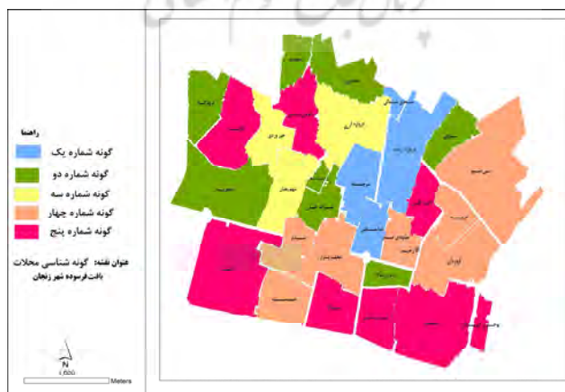
شکل ۳- گونه‌شناسی محلات بافت فرسوده بخش مرکزی شهر زنجان (مأخذ: یافته‌های نگارنده، ۱۳۹۵)

همانگونه که با مقایسه میانگین شاخص‌ها در هر خوشه بر می‌آید، این گونه در هر چهار شاخص کالبدی، اجتماعی، زیست‌محیطی و اقتصادی در بین پنج گونه شناسایی شده از جایگاه مطلوبی برخوردار نمی‌باشد؛ از این رو این گونه «زیست‌پذیری غیرقابل قبول با عدم مطلوبیت در همه ابعاد» نام‌گذاری گردید. گونه مذکور در بُعد اقتصادی و زیست‌محیطی در بین پنج گونه شناسایی شده در رده آخر قرار می‌گیرد و همچنین به لحاظ کالبدی و اجتماعی نیز از جایگاه مطلوبی برخوردار نمی‌باشد، چنان‌که در رده چهارم گونه‌ها قرار می‌گیرد. آن چیزی که در این گونه مدنظر باید قرار بگیرد این است که محلات شناسایی شده در گونه مذکور، در سطح‌بندی زیست‌پذیری بافت نیز در رده غیرقابل قبول قرار گرفته‌اند که این بحث باید در برنامه‌ریزی و اولویت مداخله جهت زیست‌پذیری آن مدنظر قرار بگیرد. شکل (۳) گونه‌های شناسایی شده را به تفکیک محلات در سطح بافت نمایش می‌دهد: