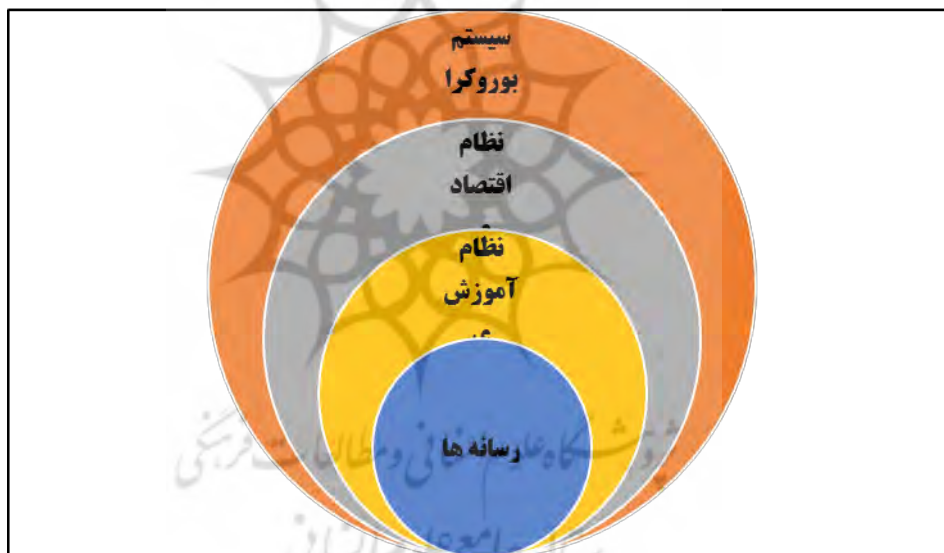
شکل شماره (۱) کارگزاران نوسازی فرهنگ روستا (یافته‌های پژوهش)

آموزش و پرورش، وسایل ارتباط جمعی و کار در کارخانه در فرایند نوسازی بیشترین اهمیت را دارند (Inkeles & Smith, 1974). مک کله لند با تئوری میل و نیاز به پیشرفت به مقوله نوسازی می‌نگرد و عوامل ذهنی و فرهنگی را در توسعه بسیار مؤثر می‌داند. راجرز با تأکید بر متغیرهای فردی و شخصیتی افراد در قالب خرده فرهنگ روستایی به فرایند نوگرایی روستاییان پرداخته است. او عواملی را مانع نوسازی در روستاها می‌داند: ۱- تقدیرگرایی ۲- فقدان همدلی ۳- عدم اعتماد متقابل در روابط شخصی ۴- پایین بودن سطح آرزوها ۵- عدم چشم پوشی از منافع آنی به خاطر منافع آتی ۶- وابستگی به قدرت دولت ۷- خانواده گرایی ۸- محلی گرایی ۹- فقدان نوآوری ۱۰- عدم توجه به عنصر زمان (McClelland, 1988: 590). منظور از نوسازی فرهنگ روستا در این مقاله عوض کردن ماهیت روستا و تبدیل آن به یک حومه شهری که معنی آن کم رنگ شدن اقتدار سنتی و گذار به سمت ارزش‌های عرفی - عقلانی است. این تحول در اثر فعالیت کارگزارانی به وقوع پیوسته است.