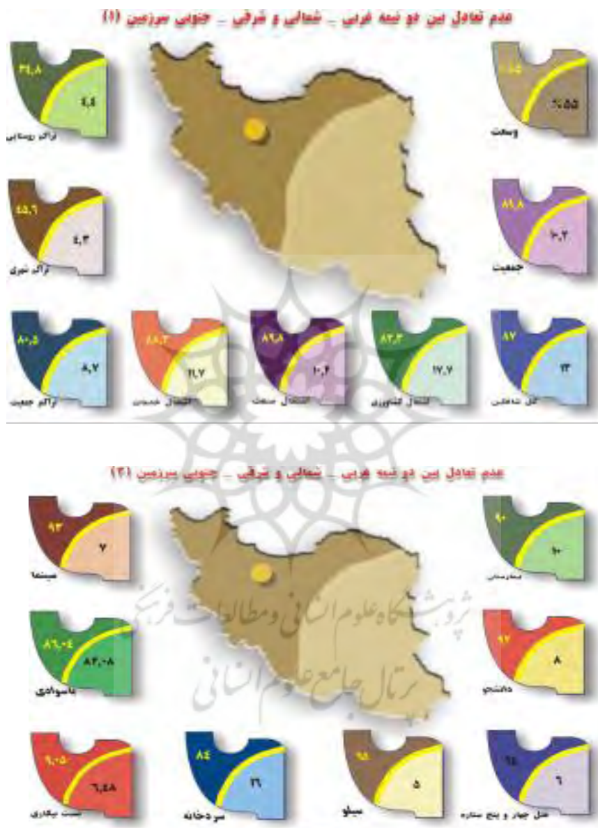
شکل (۲): نابرابری در مناطق مختلف کشور

بدین ترتیب تراکم اکثر عوامل (جمعیت، اشتغال، صنعت، دانشجو، باسوادی و ...) در مناطق نیمه غربی - شمالی کشور تجمع دارند. که نشانه نابرابری و عدم تعادل در بین مناطق را به وضوح نشان می دهد.