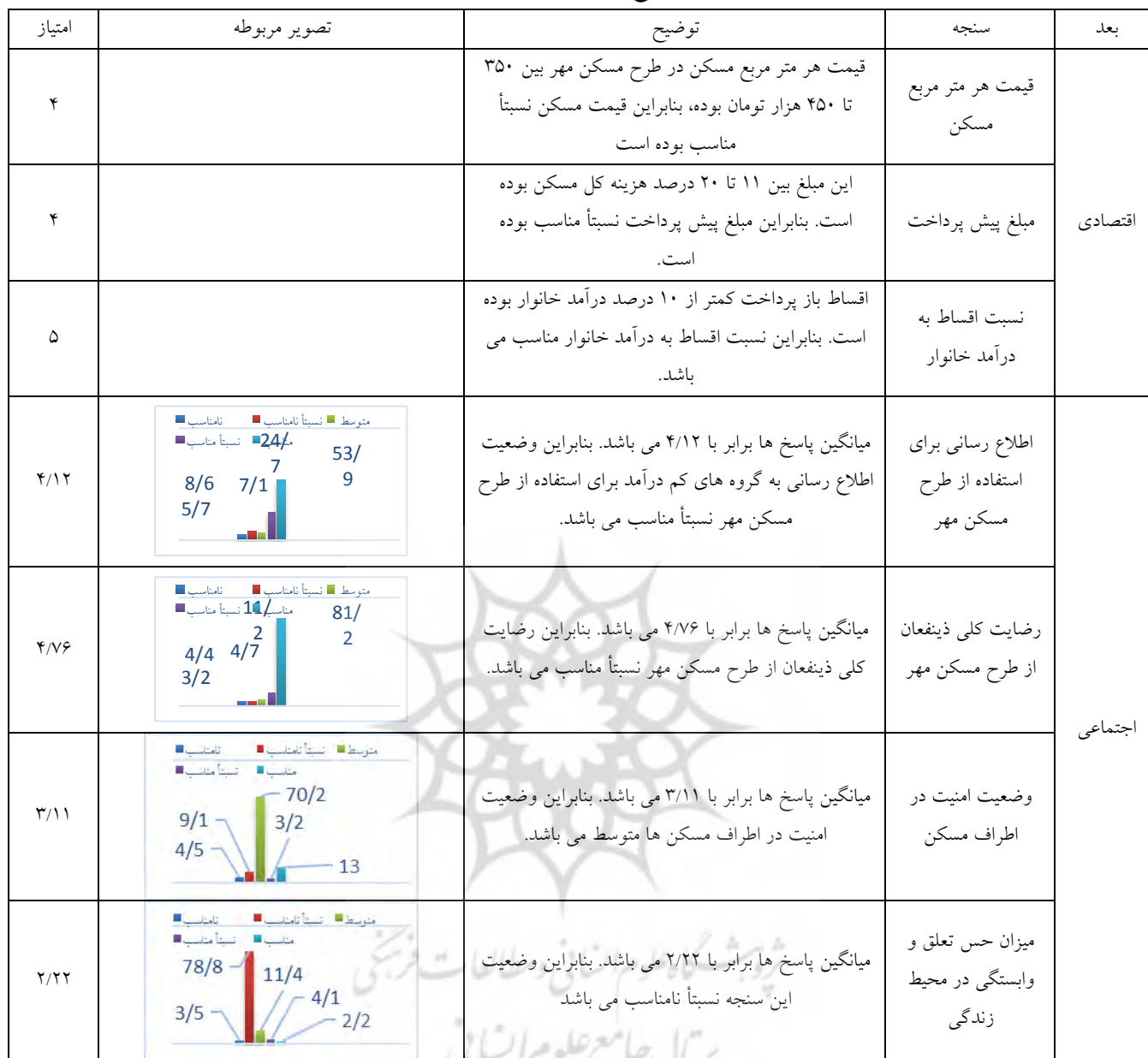
جدول ۵- امتیازدهی سنج‌های ارزیابی طرح مسکن مهر شهر شهرضا به لحاظ ابعاد اقتصادی و اجتماعی