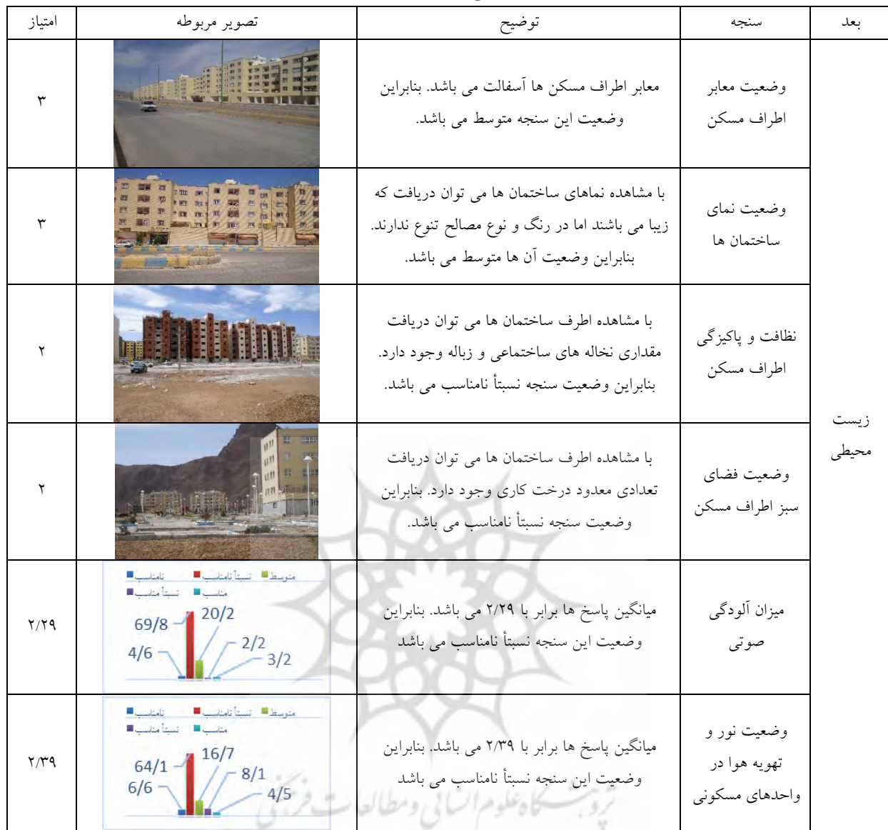
جدول ۶- امتیازدهی سنجه های ارزیابی طرح مسکن مهر شهر شاهرز با به لحاظ بعد زیست محیطی