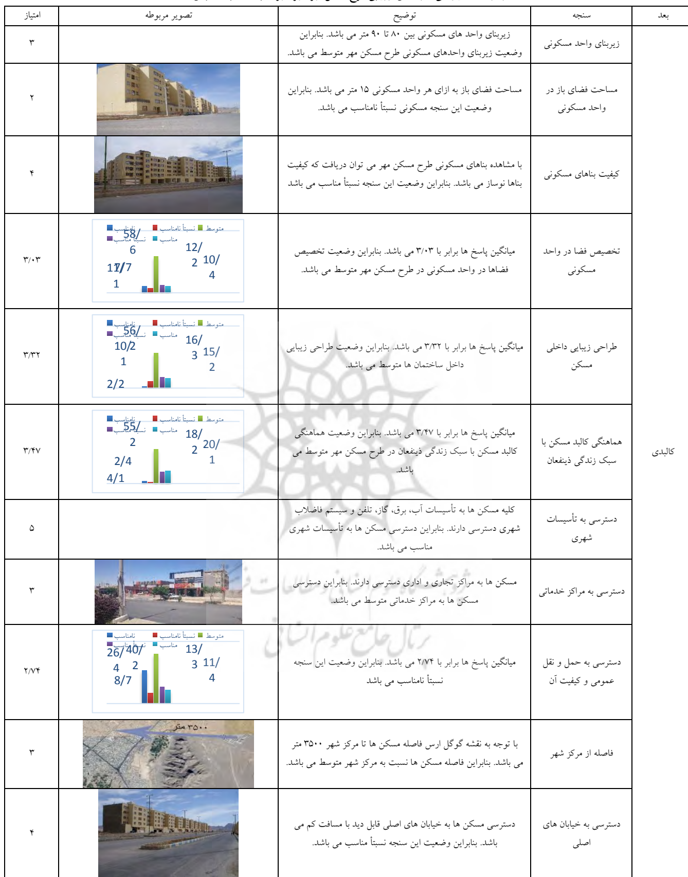
جدول ۷- امتیازدهی سنجه های ارزیابی طرح مسکن مهر شهر شهربان به لحاظ بعد کالبدی