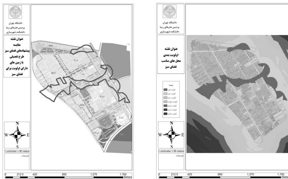
شکل ۴- اولویت بندی محل های مناسب فضای سبز (منبع: نگارندگان، ۱۳۹۷) - شکل ۵- ارزیابی پیشنهادی طرح تفصیلی - منبع: نگارندگان، ۱۳۹۷.

بر اساس مدل تدوین شده در محیط نرم افزار جی آی اس، معیارهای استخراج شده وزن داده شده توسط متخصصین و همپوشانی نقشه‌های تولید شده هر یک از معیارهای پژوهش نقشه اولویت بندی محدوده‌های مناسب ایجاد فضای سبز در ناحیه جوادیه تولید شده است.