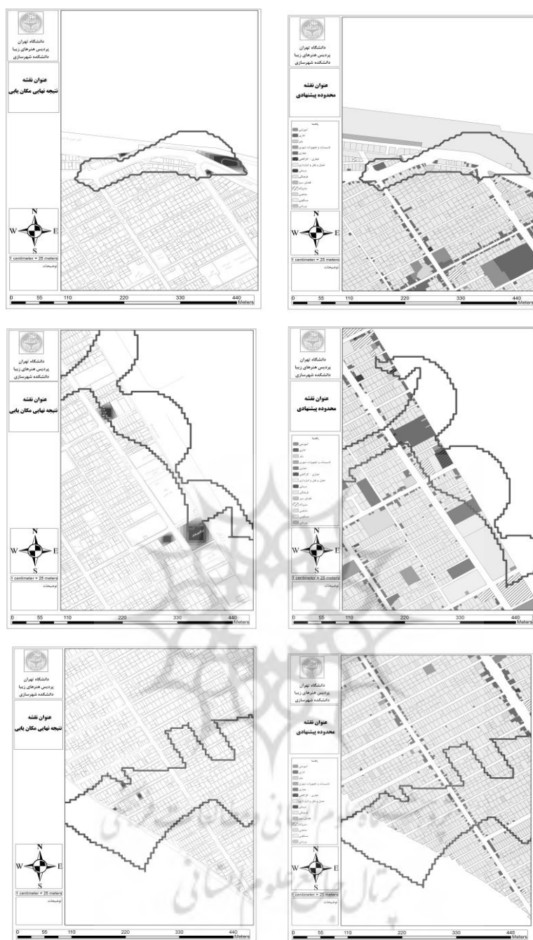
شکل ۶- مکان‌های نهایی پیشنهادی - منبع: نگارندگان، ۱۳۹۷.