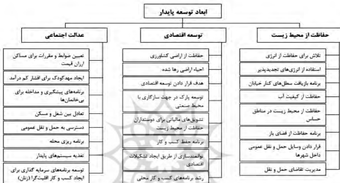
شکل ۱. ابعاد توسعه پایدار

کس ۵ معتقد است توسعه پایدار روندی است که بهبود شرایط اقتصادی، اجتماعی، فرهنگی و فن‌آوری به سوی عدالت اجتماعی را دنبال می‌کند و در جهت جلوگیری از آلودگی اکوسیستم و تخریب منابع طبیعی گام برمی‌دارد (تقوایی و صفربادی، ۱۳۹۲: ۶). ترنر ۶ نیز بر این باور است که توسعه پایدار شهری می‌کوشد تا