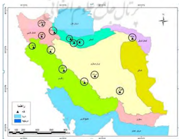
شکل - ۲: موقعیت قله‌های برگزیده در واحدهای ژئومورفیک