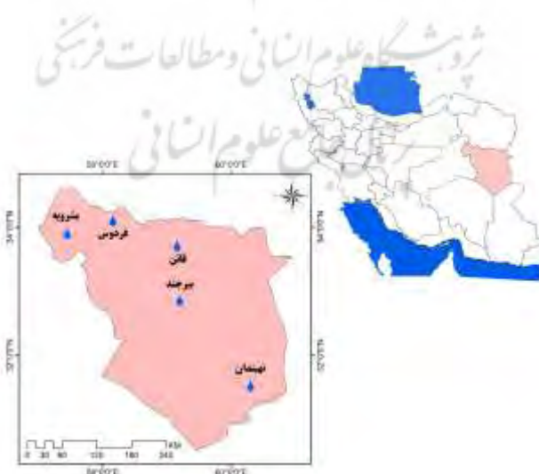
شکل - ۱: موقعیت جغرافیایی منطقه پژوهش به همراه ایستگاه‌های برگزیده

متوسط کمینه دمای روزانه ایستگاه‌های همدید استان نشان می‌دهد ایستگاه‌های قائن و بیرجند به ترتیب با متوسط کمینه دمای روزانه ۶/۷ و ۱۱/۴ درجه سانتی‌گراد، سردترین نقاط دمایی استان‌اند که در بخش شمالی تا مرکزی استان جای گرفته‌اند. نهبندان با متوسط کمینه دمایی حدود ۱۳ درجه سانتی‌گراد نیز، گرم‌ترین پهنه بررسی شده است که در بخش جنوب تا جنوب شرق استان جای گرفته است و پس از آن شمال غرب استان با متوسط کمینه دمایی حدود ۱۰ تا ۱۱ درجه سانتی‌گراد قرار دارد. با توجه به موقعیت ایستگاه‌ها و شرایط ناهمواری منطقه از شمال و شمال شرق به سمت سایر قسمت‌های استان از میزان کمینه دمای روزانه کاسته می‌شود که پیروی درجه حرارت از شرایط ارتفاعی را به خوبی نشان می‌دهد. با توجه به شواهد آماری موجود ماه ژانویه (دی)، سردترین ماه سال منطقه است.