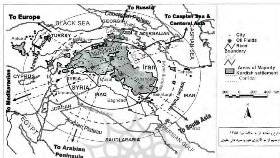
شکل شماره ۱: موقعیت کردها در منطقه ژئوپلیتیک جنوب غرب آسیا