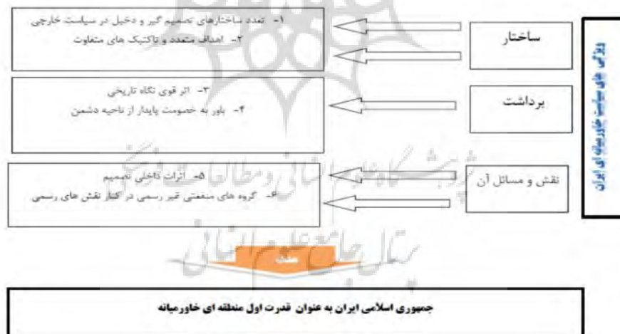
شکل شماره ۱: ساختار و هدف سیاست خاورمیانه‌ای جمهوری اسلامی ایران

الکساندر و هونینگ نقش ساختار دیپلماسی را در اجرای عملیات سیاست خارجی به‌رغم وجود نهادهای متعدد دیگر مهم می‌دانند. سفارتخانه و دیپلمات‌ها به‌عنوان بخش‌های مهم کشور در ارتباط با کشور میزبان عمل نموده و سخنگوی رسمی سیاست خارجی کشور در ارتباط با مقامات کشور میزبان می‌باشند. لذا در هر زمان اجرای سیاست خارجی از طریق ساختار دیپلماسی و با نظر به مؤلفه اصلی منافع ملی یعنی حفظ نظام صورت گرفته و مذاکرات با مقامات هر کشوری را ساختار دیپلماسی کشور سازماندهی می‌کند. اختلافات تاکتیکی بعضاً ممکن است در اجرا به‌خصوص توسط هر دستگاه به‌چشم بخورد. اما عمل‌گرایی سیاست خارجی و حفظ نظام روندهای اجرا را هماهنگ و همبسته می‌سازد (Alexander-Hoenig, 2007: 20). می‌توان با توجه به نکات یادشده، ساختار و هدف نهایی سیاست خاورمیانه‌ای ایران را براساس نمودار ذیل ترسیم کرد.