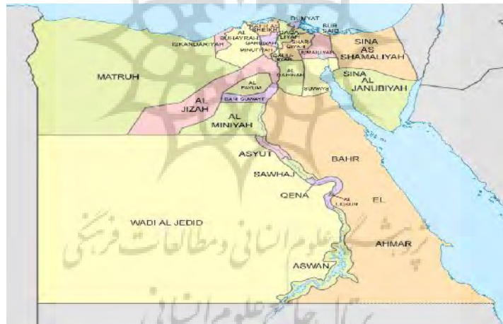
نقشه شماره ۴: تقسیمات سیاسی مصر