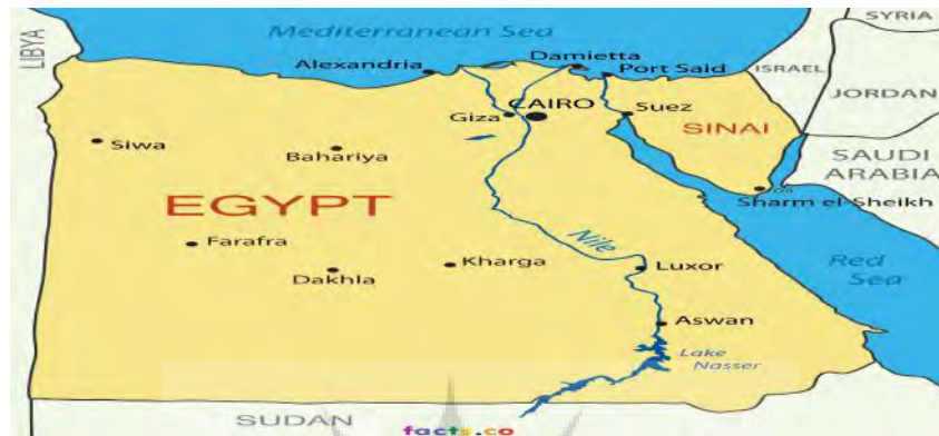
نقشه شماره ۱: موقعیت جغرافیایی کشور مصر