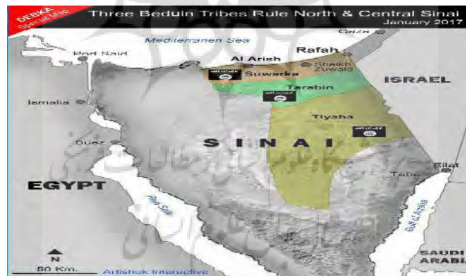
نقشه شماره ۳: موقعیت داعش در صحرای سینا