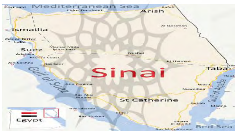
نقشه شماره ۲: موقعیت راهبردی صحرای سینا

آن زمینه‌های واگرایی در سطحی بسیار بالا وجود دارد. زیرا آن تنها قطعه سرزمینی مصر است که آن را خلیج و کانال سوئز از سرزمین اصلی مصر جدا انداخته است، این جدایی سرزمینی؛ بویژه زمانی که دولت مرکزی ضعیف باشد و نتواند کارویژه خود را به درستی انجام دهد و یا اینکه بخواهد در برنامه‌ریزی‌ها و سیاست‌گذاری‌های خود به گونه‌ای تبعیض‌آمیز عمل کند؛ ممکن است ساکنان این شبه جزیره را به تلاش برای جدایی‌طلبی و یا حداقل خودمختاری ترغیب نماید ( http://sis.gov.eg/year2003/html land.htm ).