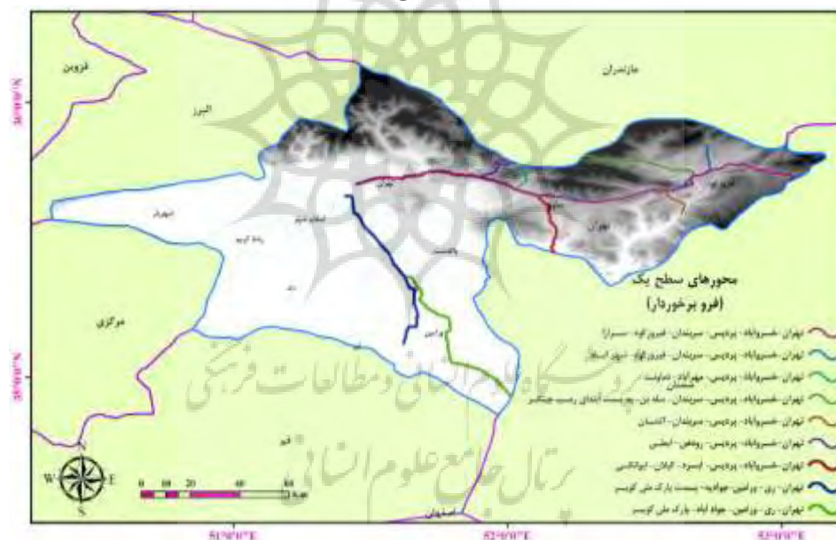
شکل ۴: نقشه محورهای سطح یک (فرو برخوردار)

پس از رتبه‌بندی ۳۸ محور گردشگری استان، در مرحله بعد، چنانچه در شکل (۴ تا ۷) نشان داده شده است، محورهای گردشگری استان را به چهار سطح شامل دو سطح فرورخوردار یا فرو توسعه (سطح یک و دو) و فرابرخوردار یا فرا توسعه (سطح سه و چهار)، تقسیم‌بندی شدند و به‌صورت نقشه ترسیم گردیده است تا با توجه به توانمندی‌ها و قابلیت‌های هر سطح و جایگاه هر محور در فرایند توسعه، به انتظارات معقول و برخوردار منطقی با محورهای گردشگری کمک نماید و متناسب با ظرفیت‌های آن‌ها برنامه‌ریزی و سرمایه‌گذاری صورت پذیرد.