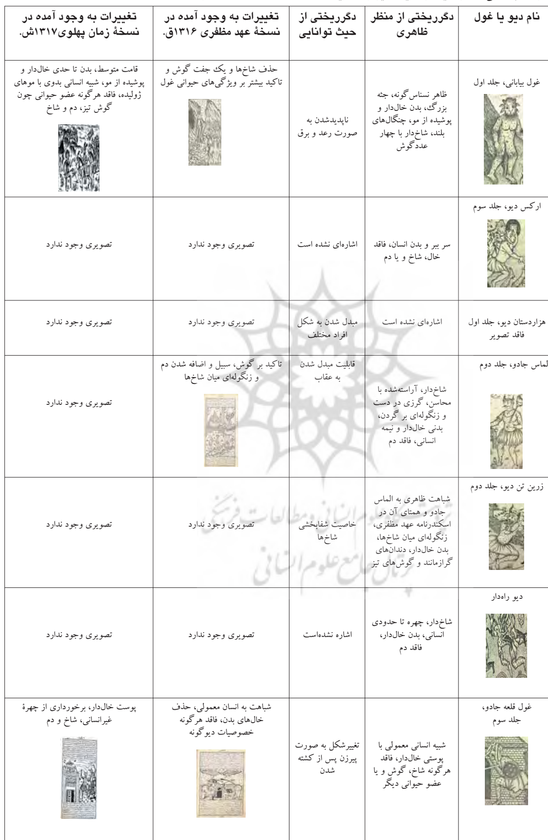
جدول ۲. بررسی خصوصیات و مقایسه دیوان دگرریخت اسکندرنامه. مأخذ: نگارندگان