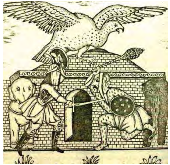
تصویر ۱۸. اسکندرنامه، تهران، ۱۲۷۳-۷۴ق.، تصویر نقابدار که غول را می‌کشد و روانه طلسم گردیده، جزء هفتم از جلد سوم، فاقد رقم، کتابخانه ملی ایران، شماره کتابشناسی ۳۱۹۷۹۶۰