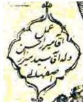
تصویر ۳. رقم میرزا حسن (ب)، اسکندرنامه، تهران، ۷۴-۱۲۷۳ق.