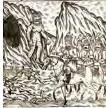
تصویر ۷. اسکندرنامه، تهران، ۱۳۱۶ق، اسکندر و سپاهیان که دور کوه بصید مشغولند که غولی از مغار بیرون می آید، جلد اول، فاقد رقم، مأخذ: همان، شماره کتابشناسی ۶۶۵۸۹