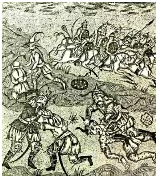
تصویر ۱۷. اسکندرنامه، تهران، ۱۲۷۳-۷۴ ق.، تصویر کشتی گرفتن طوردیمست با سعدان و محاربه نمودن اسحق با دیوراه دار، جلد اول، رقم میرزا حسن، مأخذ: همان، شماره کتابشناسی ۳۱۹۷۹۶۰