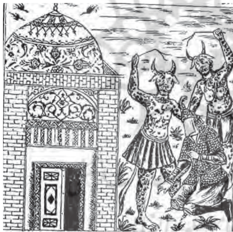
تصویر ۲۰. اسکندرنامه، تهران، ۱۳۱۷ش، تصویر فاقد عنوان است، جلد سوم، فاقد رقم، مأخذ: همان، شماره کتابشناسی (۷۵۲۸۱۱۱۱)

گوش و یا عضو حیوانی دیگری است. بدین ترتیب، او بیشتر در قالب انسانی معمولی با پوستی خال‌دار به تصویر کشیده شده است، تا غولی حیوان‌نما و یا انسانی وحشی. این مسئله در اسکندرنامه (۱۳۱۶ق.) به دلیل حذف پوست خال‌دار، آشکارتر است. شخصیت به نمایش درآمده در این تصویر، کاملاً به انسانی معمولی شباهت دارد و چنانچه خواننده از متن بی‌اطلاع باشد، غول شمردن این موجود، سخت می‌نماید. اما آنچه در اسکندرنامه (۱۳۱۷ش.) به تصویر درآمده، با الگوی متداول دیو یا غول همخوانی دارند. این در حالی است که دو غول به نمایش درآمده در دو اسکندرنامه پیشین، وجه انسانی بیشتری را به نمایش می‌گذارند.