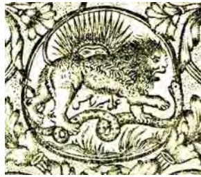
تصویر ۲. رقم میرزا حسن (الف) در سرلوح و صفحه نخست اسکندرنامه، تهران، ۷۴-۱۲۷۳ق.