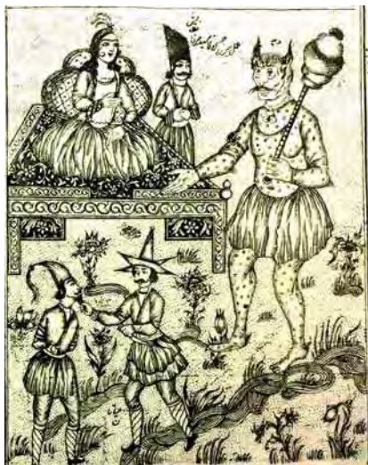
تصویر ۱۴. اسکندرنامه، تهران، ۱۲۷۳-۷۴ ق.م، تصویر بارگاه دامامه و الماس جادو. جزء سوم از جلد دوم. رقم میرزا حسن.

منفاوتی بیان شده است ۲ . اما آنچه از منظر تصویر قابل توجه است و در ادامه به آن خواهیم پرداخت، برخورداری و یا عدم برخورداری برخی از گونه‌ها از شاخ و ویژگی‌های منحصر به فرد هر یک از آن‌هاست.