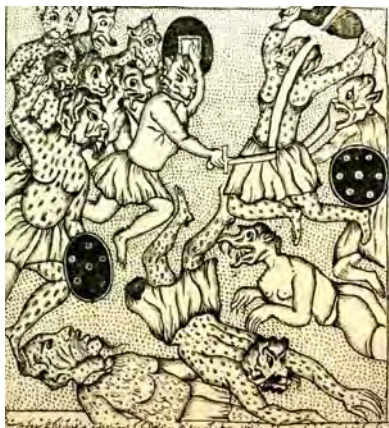
تصویر ۹. اسکندرنامه، تهران، ۷۴-۱۲۷۳ ق.، جنگ کردن ارکس دیو با دیوان دیگر. جزء هشتم از جلد سوم، فاقد رقم، مأخذ: همان، شماره کتابشناسی ۳۱۹۷۹۶۰