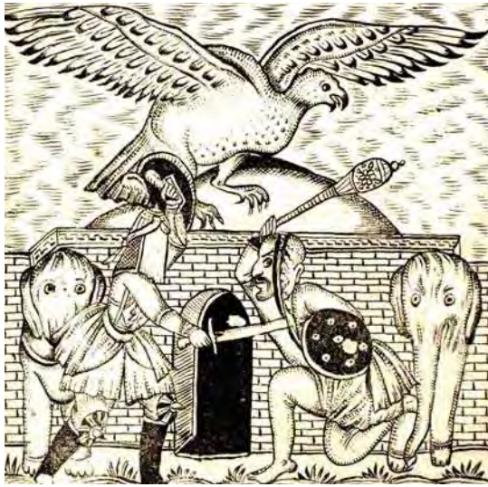
تصویر ۱۹. اسکندرنامه، تهران، ۱۳۱۶ق.، عنوان تصویر مخدوش شده، جلد سوم، فاقد رقم، مأخذ: همان، شماره کتابشناسی ۶۶۵۸۹