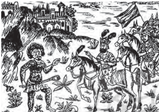
تصویر ۸. اسکندرنامه، تهران، ۱۳۱۷ش. (۱۳۵۷ق)، اسکندر و سپاه که دور کوه بصید مشغولند که غولی از مغار بیرون می آید، جلد اول، فاقد رقم، مأخذ: همان، شماره کتابشناسی ۷۵۲۸۱۱۱۱