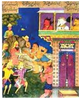
تصویر ۱۱. برگی از یک نسخه شاهنامه مصور شده، شیراز، ایران، ۱۶۵۴ میلادی، مأخذ: Daljeed and Jain, 2006, 51