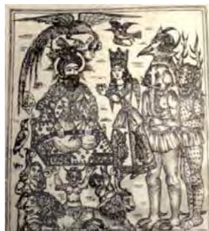
تصویر ۱۳. عجایب المخلوقات، مأخذ: مارزولف، ۱۳۹۰، ۲۲