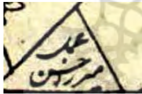
تصویر ۴. رقم میرزا حسن (ج)، اسکندرنامه، تهران، ۷۴-۱۲۷۳ق.