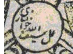
تصویر ۵. رقم سیف الله خوانساری (الف)، اسکندرنامه، تهران، ۷۴-۱۲۷۳ق