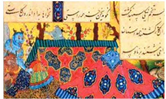
تصویر ۱۰. کاوه طومار ضحاک را پاره می‌کند (بخشی از نگاره)، شاهنامه شاه تهماسبی، منسوب به قدیمی، حدود ۹۳۰ ه.ق، موزه هنرهای معاصر تهران، مأخذ: حسینی راد و دیگران، ۱۳۸۴، ۲۳۴.