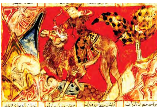
تصویر ۵. بهرام گور و آزاده در شکارگاه، شاهنامه ۵۷۲ ه.ق، شیراز، اندازه صفحه: ۲۹.۲×۲۱.۱ سانتیمتر.

پیکره زن و مرد در هر سه تصویر یکسان است. حالت مرد مطابق است با قراردادهای کهن: بسیار مصمم، چهره‌ای سه‌رخ، بالاتنه از روبرو و پاها از نیم‌رخ، که دقیقاً همانند گونه تاریخی آن است (تصویر ۶) (این نمونه تاریخی بخشی است از صحنه شکار خسرو دوم (۵۹۰-۶۲۸ م) در طاق بستان). زن بدون نیم‌تاج، با چهره‌ای سه‌رخ و بدنی نیم‌رخ در حال جان سپردن، با ساز چنگی به رنگ سفید در کنار خود (البته در ۲ نگاره). حالت شتر نیز در این تصاویر مشابه است: بسیار خشمگین، با نگاهی نافذ و مستقیم به جلو در حالی که پاهای خود را سخت بر زمین و پیکره بیجان زن می‌کوبد. مرد تاجی بر سر و جامه‌ای زریفت و فاخر بر تن دارد. در نگاره شاهنامه ۷۳۱ و ۷۳۳ ه. ق این تاج به شکل گل نیلوفر است.