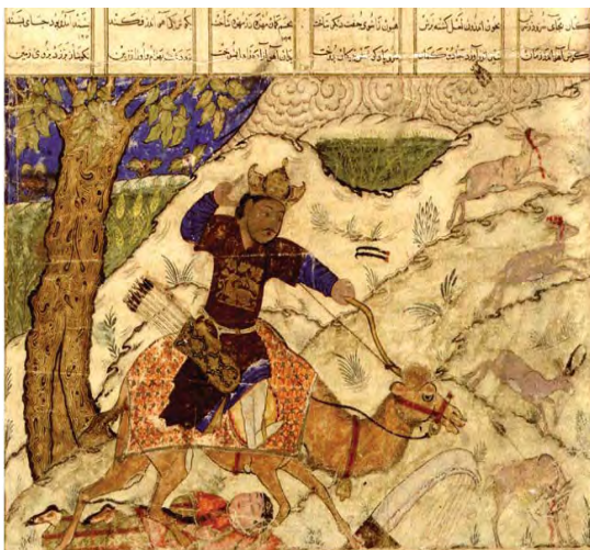
تصویر ۱۶. بهرام گور، آزاده را لگدمال می‌کند. شاهنامه بزرگ ایلخانی، ۱۱۳۳۰/۷۳۰ق.

تفسیر شمایل‌شناسانه نگاره «بهرام گور و آزاده در شکارگاه» در شاهنامه‌های آل اینجو (۷۲۵- ۷۵۸ق) بر مبنای آرای پانوفسکی