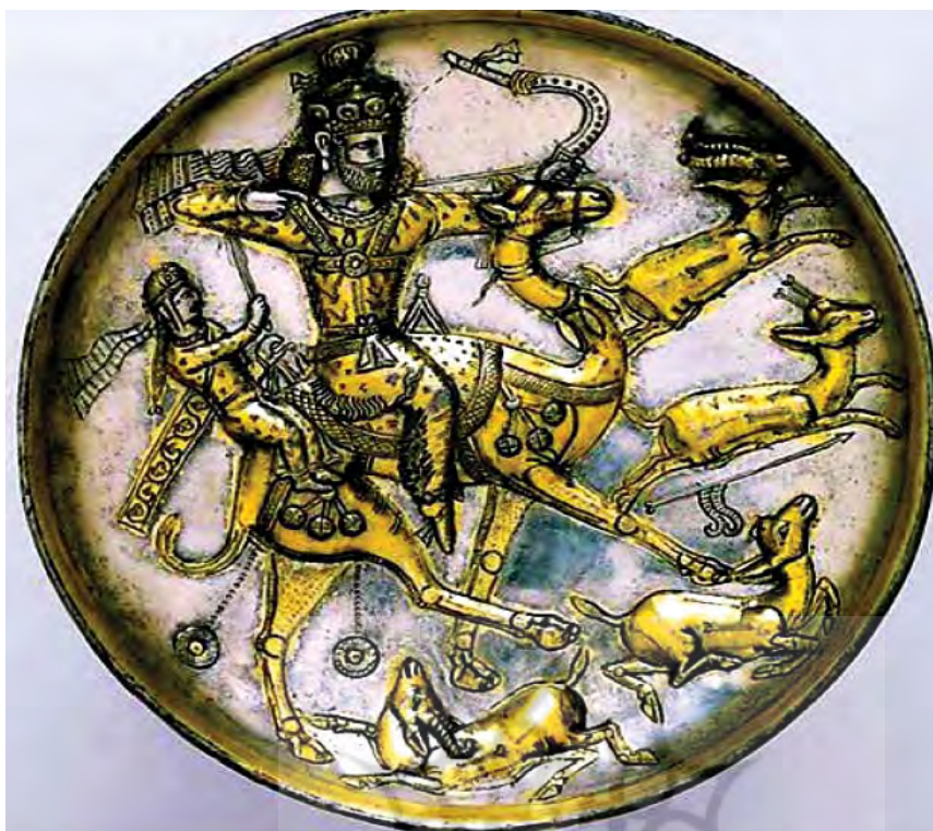
تصویر ۱۳. بشقاب زراندوده، قرن ۵ و ۶ میلادی، موزه متروپولیتن، مأخذ: Harper, 1978, 48

زخمی تصویر شده‌اند، بنابراین مضمون همان مضمون دوره باستان است، که در قرون اسلامی مجدداً احیا شده و در این مسیر، استحاله یا تغییر جزئی نیز یافته است، بدین‌گونه که در این دو سفالینه، شاهد تغییر جزئی تاج و فرم و طرح جامه بهرام ساسانی به عمامه و جامه با طرح و نقش سلجوقی هستیم. زن اسب‌سوار و مردی که در پس‌زمینه این دو سفال جای گرفتند، در حکم تحریفات تجسمی هستند که در تولید انبوه آثار دیده می‌شوند. ۱ باید به این مهم اشاره کرد، که در نگاره‌های شاهنامه‌های اینجو (تصاویر ۱ تا ۵) شاهد حضور عوامل و عناصر تصویری هستیم که نقشی بسزا در «بیان» حماسی تصویر دارد. عناصر ترکیب‌بندی در فضایی کاملاً فشرده به گونه‌ای در کنار یکدیگر قرار گرفته‌اند که بر مرکز کادر و بر کنش مرد کمان‌دار و عمل مرکب او که همانا لگد زدن به کنیزک است دلالت و تاکید دارند. رنگهای گرم قرمز و سرخ و نارنجی به کار رفته در پس‌زمینه، به وقوع اتفاقی مهم و خونین اشاره دارند و بر عمق ماجرا می‌افزایند. آیت‌اللهی معتقد است در آثار مکتب شیراز یک «مرزبندی خطوط به کمک بیان احساس و ایفای نقش رنگ‌ها می‌آید» (آیت‌اللهی، ۱۳۸۶: ۳۸). این خطوط زنده و پویا که رنگها از مرز آن‌ها تعدی کرده و منجر به کیفیتی نقاشانه در آثار این دوره شده، بر جنبه خشونت موضوع و انتقال حس نوستالژیک آن به بیننده تأکید کرده و بسیار تأثیرگذار است.