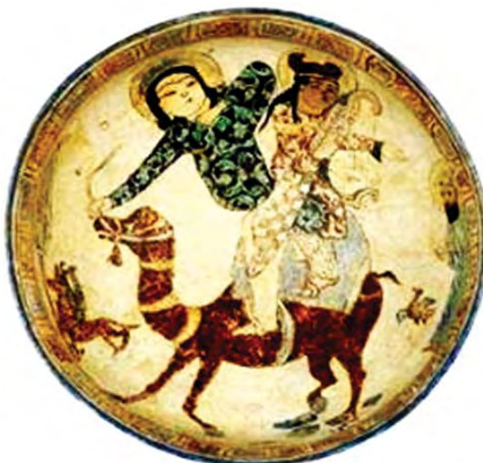
تصویر ۱۵. بهرام گور و آزاده در حال شکار، سفالینه دوره سلجوقی.

چارپایان کشته شدند (حسنی، ۱۳۹۲). شواهد تاریخی که در بالا ارایه شد نشان می‌دهد با توجه به روحیه و اخلاق و فرهنگ سلاطین سلجوقی، مخالفان شاه برای اولین مرتبه بخشیده می‌شدند، اما نمونه‌ای که از تاریخ ایلخانی (کونجاک خاتون و مرگش) ارایه شد، مبین آن است که شاه ایلخانی به شدت با فردی که به دشمنی با او می‌پرداخت، برخورد می‌کرد. پس به احتمال زیاد، با تغییر فرهنگ، اخلاق و بستر فکری و سیاسی دوران مغول، ما شاهد تغییر و استحاله در نقشمایه «آزاده سوار بر شتر» به «آزاده مرده» هستیم. میرچا الیاده ۱ نشان داده که: «گرایش اسطوره‌شناسی جهانی عبارت است از تبدیل پیچیدگی چندگانه بازیگران تاریخ به بزرگ نمونه‌های کردار قهرمانانه که به کمک افسانه‌ها جنبه تقدس به خود می‌گیرند. فردوسی و بعد از آن نظامی، از رهگذر تصویرهای گوناگون خود، از چهره خدای کهن ایرانی که زیر نقاب بهرام گور پنهان شده است، پرده برمی‌دارند» (بری، ۱۳۹۴: ۷۷) بهرام گور در پایان دوره اسطوره‌ای ایران ظهور می‌کند و ویژگی ایزدان را به خود می‌گیرد. او بیش از همه، کمالات و رترغنه، خدای پیروزی را متجلی می‌کند. از نظر مایکل بری، بهرام گور «تنها یک شاه زمینی نیست، بلکه قهرمانی به مفهوم سنتی حماسه‌ها؛ یعنی، اغلب یک نیمه خدا، یا در هر حال تجلی یک اصل الهی فعال با چهره انسان فانی شکوهمند است» (همان منبع). این شخصیت تاریخی بدلیل دلآوری‌هایش در نبرد با هون‌ها و شکست آنان - در مرزهای شرقی ایران در سال ۴۲۷ میلادی - در ادبیات ایران دارای تقدس می‌شود (همان منبع: ۷۲). از سوی دیگر بهرام یکی از مهم‌ترین ایزدان زرتشتی است که در اسطوره‌شناسی به عنوان فرشته پیروزی و نصرت از وی یاد می‌شود. نام