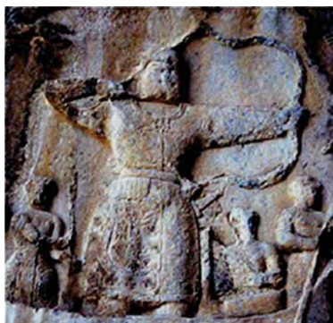
تصویر ۶. صحنه شکار خسرو دوم (۵۹۰-۶۲۸ م). طاق بستان.

تفسیر شمایل‌شناسانه نگاره «بهرام گور و آزاده در شکارگاه» در شاهنامه‌های آل اینجو (۷۲۵-۷۵۸ ه.ق) بر مبنای آرای پلنوفسکی