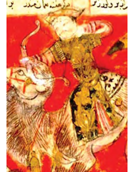
تصاویر ۷ و ۸. بخشهایی از تصویر ۵، متعلق به شاهنامه ۷۵۳ق شیراز، که در آن‌ها طراحی از زیر لایه‌های آبرنگی، مشخص است.