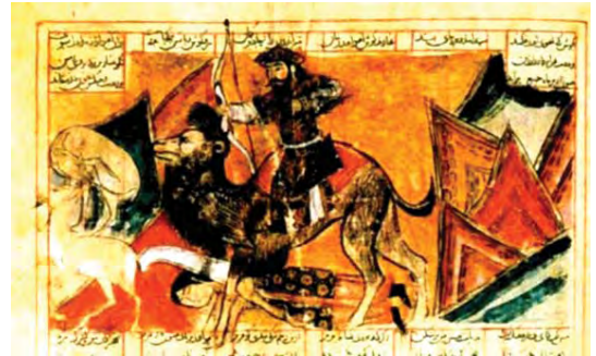
تصویر ۱. بهرام گورو شکار غزال، شاهنامه ۷۳۱ ق. شیراز، مأخذ: www.google.com