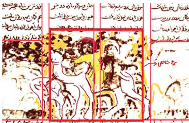
تصویر ۱۰. نمایش مربع شاخص در مرکز قاب و انطباق نقشمایه‌های اصلی تصویر بر خطوط رهنمای عمودی در نگاره کاما

بر سر آهوی ماده می‌نشانند. سپس شتر را به سوی جفت دیگر می‌راند و سر و پای و گوشش را یکجا می‌دوزد. در این لحظه آزاده، گریان به بهرام می‌گوید که این رسم مردانگی نیست و تو دیوانه هستی.