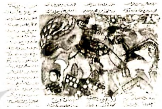
تصویر ۲. بهرام گورو آزاده در شکارگاه، شاهنامه فردوسی ۷۳۳ ق. شیراز، مأخذ: ادامووا، کیوزالیان، ۱۳۸۶: ۱۸۷۹.

نگاره «بهرام گورو و آزاده در شکارگاه» در سه شاهنامه از شاهنامه‌های اینجو و دو شاهنامه سلجوقی و تیموری پرداخته می‌شود. سپس به تحلیل شمایل‌نگارانه و تفسیر شمایل‌شناسانه صحنه مذکور بر اساس رویکرد پانوفسکی در شاهنامه‌های اینجو می‌پردازیم و در پایان نیز حاصل کلام ارایه می‌گردد.