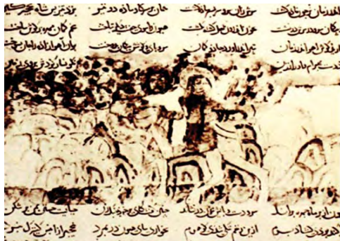
تصویر ۹. بهرام گور و کنیزک در شکارگاه، شاهنامه کاما، اوایل قرن ۷ق. (مأخذ: معرفی نسخه‌های شاهنامه فردوسی، ۱۳۶۹: ۱۶).