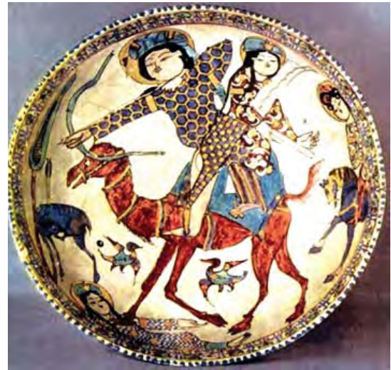
تصویر ۱۴. بهرام گورو آزاده در حال شکار، سفالینه سلجوقی، کاشان، سده ۶ و ۷ ه. ق، مأخذ: بهدانی، مهرپویا، ۱۳۹۰: ۱۱.

ابن اثیر که بزرگترین مورخ هم عصر چنگیزخان در دنیای اسلام محسوب می‌شود و در طی حمله اول مغول در عراق به دور از شهرهای مورد هجوم زندگی می‌کرده است می‌نویسد: «حتی دجال ۳ ، کسانی را که مطیع او گردند، امان می‌دهد و فقط کسانی را که در برابر او پایداری کنند، نابود می‌سازد. ولی اینان به هیچکس رحم نکردند و زنان و کودکان را کشتند.» (ابن اثیر، ۱۳۵۳، ج ۱۲: ۱۹۰) بنا به قول جوینی، شیوه وحشیانه مغولها کشتار هر جنبنده‌ای از آدمیزاد گرفته تا حیوانات از قبیل سگ و گربه و بپاکردن مجالس جشن پس از کشتار جمعی بوده است. عدالت می‌نویسد: «همگی این اعمال برای انتقام‌جویی ولی در کمال خونسردی انجام می‌گرفته است» (عدالت، ۱۳۸۹: ۲۳۶).