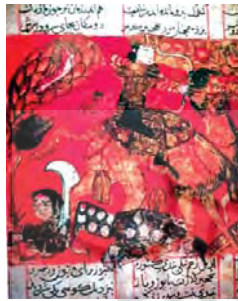
تصویر ۴. بخشی از نگاره بهرام گورو آزاده به صورت رنگی، شاهنامه ۷۳۳ ق.