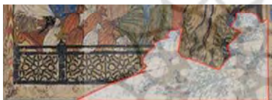
تصویر ۱. آمدن انوشیروان نزد بزرگمهر، شاهنامه بزرگ، نگارخانه فریر واشنگتن دی.سی، مأخذ: هیلن برن، ۲۰۰۲: ۱۱۹

ب. برش تصاویر و تغییر ساختار صفحه بخشی از فرآیند کار دموت برش تصاویر و الطاق آن‌ها بر روی صفحات گوناگون بوده که هم باعث برهم ریختن ساختار صفحات شده و هم منجر به بریده شدن بخشی از نگاره‌هایی که در پشت هم قرار گرفته بودند شده است. همچنین احتمالاً در دوباره‌چسبانی اثر به یکدیگر بخش‌هایی از نگاره‌ها جدا شده و نگاره‌ها کوچک‌تر شده‌اند و در زمان الصاق در مکان جدید منجر به ایجاد فضاهای خالی و ناقص شدن نگاره‌ها شده است (جدول ۵).