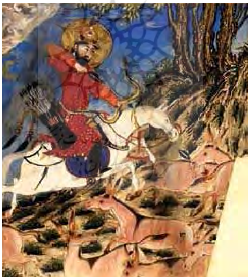
بهرام گور در حال شکار، شاهنامه بزرگ، موزه هنر دانشگاه هاروارد