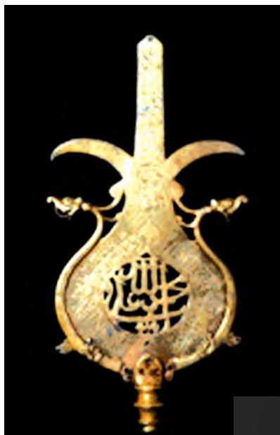
تصویر ۱۴. سردرفش صفوی با اسما مقدس الله، محمد و علی، موزه دیوید، مأخذ: www.davidmus.dk