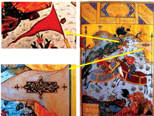
تصویر ۳. فریبرز در مقابل کلبا، منسوب به شیخ محمد، مأخذ: موزه آقاخان.

تشیع در قالب نمادهای تصویری و یا نوشتاری مرتبط با نخستین امام شیعیان حضرت علی (ع) و فرزندانش به صورت مستقیم و یا غیرمستقیم متجلی می‌شود.