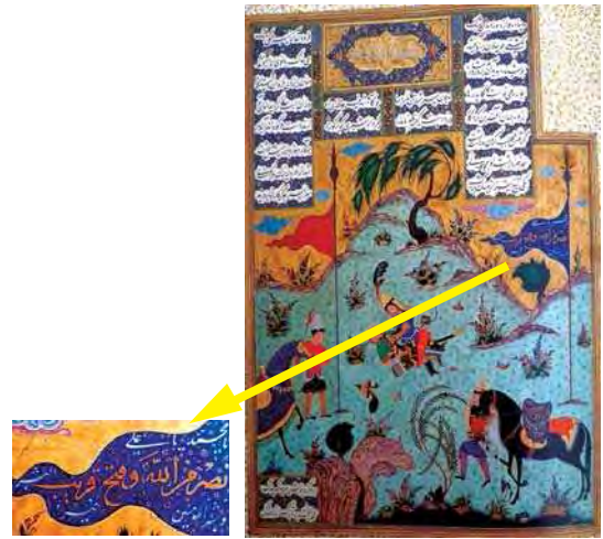
تصویر ۶. کشته شدن شیده به دست کیخسرو، منسوب به قاسم علی، موزه هنرهای معاصر

در اواخر سلطنت خسرو پرویز شورشی در می‌گیرد و شورشیان به اعتراض بر بی‌عدالتی خسرو و به نفع شیرویه