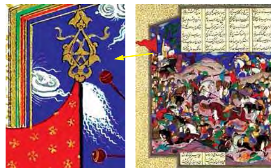
تصویر ۱۷. بهرام تاج ریونیز را به دست می‌آورد، منسوب به قدیمی، موزه متروپولیتن، مأخذ: همان: ۲۱۰.