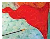
تصویر ۴. رزم رهام با بارمان، منسوب به قاسم علی، مأخذ: موزه متروپولیتن.