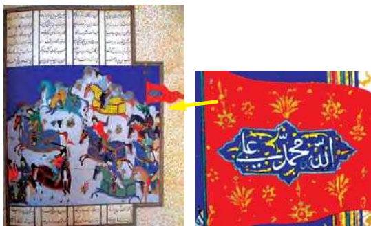
تصویر ۱۱. کودتا علیه شاه فرابین گراز، منسوب به دوست محمد، مأخذ: موزه متروپولیتن (Ibid: 323).