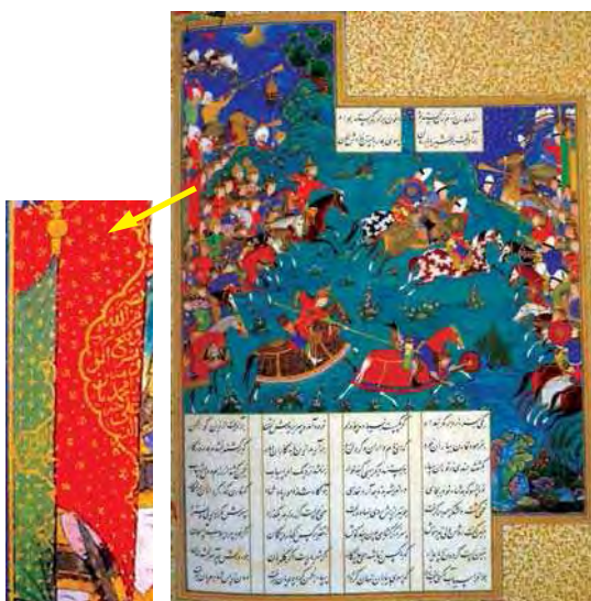
تصویر ۸. کشته شدن بارمان به دست قارن، منسوب به سلطان محمد و میر سید علی، مجموعه خصوصی.