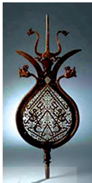
تصویر ۱۳. سردرفش صفوی با اسما مقدس الله، محمد و علی، موزه آقاخان تورنتو، مأخذ: www.agakhanmuseum.org