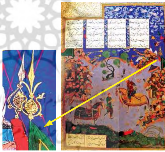
تصویر ۱۵. پیران نظر رستم را برای صلح می‌شنود، منسوب به عبدالوهاب، موزه هنرهای معاصر