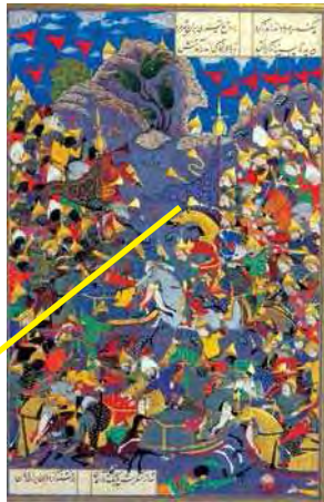
تصویر ۹. جنگ اسکندر با فور هندی، منسوب به عبدالوهاب، موزه هنرهای معاصر، مأخذ: (Ibid: 275).

تصویر ۹. جنگ اسکندر با فور هندی، منسوب به عبدالوهاب، موزه هنرهای معاصر، مأخذ: (Ibid: 275). (سپاه تورانیان) به چشم می‌خورد که به حرف اول اسم حضرت علی (ع) اشاره دارد و به گونه‌ای طراحی شده که نام این امام بزرگوار را تداعی می‌کند (تصویر ۱۷). تشابه حرف عین در این سردرفش با حرف عین استفاده شده در بسیاری از سردرفش‌های باقیمانده از دوره صفویه همچون نمونه آورده شده از موزه آقاخان در تورنتو در همین پژوهش این ظن را قوی‌تر می‌سازد. این اثر ارزشمند متعلق به موزه متروپولیتن و جزء نگاره‌های اهدا شده از سوی هوتون است.