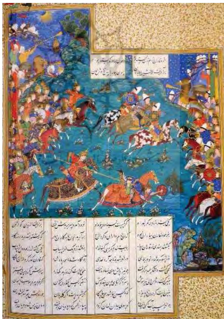
کشته شدن بارمان به دست قارن، منسوب به سلطان محمد و میر سید علی.