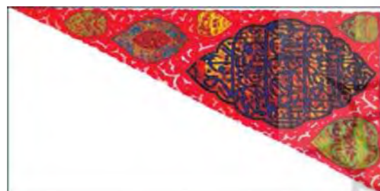
تصویر ۵. نمونه درفش نصرت آیات دوره صفوی

به نصر من الله و فتح قریب» (سنجر، ۱۳۸۷: ۴۴۹) وحید قزوینی نیز در کتاب عباسنامه در شرح زندگی شاه عباس دوم به کرات از عباراتی همچون «ایات نصرت آیات» یا «اعلام نصرت شعاع» سخن گفته که اشاره‌ای است بر نقش این درفش‌ها و طلب یمن از این آیات در میدان نبرد (وحید قزوینی، ۱۳۲۹: ۲۲-۲۰ و ۱۸۹-۱۸۷: تصویر ۵). به همین دلیل نقش درفش‌های واقعی صفویان را به وفور می‌توان بر روی نگاره‌ها و در داستان قهرمانان اسطوره‌های نقش شده