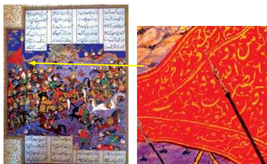
تصویر ۱۰. شکست نگهبانان خسرو پرویز از شورشیان، منسوب به عبدالوهاب و باشند قراء، مأخذ: همان: ۳۲۱.

پوشاک افراد حاضر در صحنه‌ها از پوشاک دوره صفویه تبعیت می‌کند، پوشش سر نیز از این قاعده مستثنی نیست. بدین ترتیب نگارگران برگ‌های این شاهنامه افراد حاضر در صحنه‌ها را با پوشش سری تصویر کرده‌اند که گویا استفاده از کلاه دوازده ترک با نشان شیعی برای تمامی افراد بشر، امری است بدیهی. در این بخش تنها اشاره به یک نمونه از این نگاره‌ها بسنده شده است.