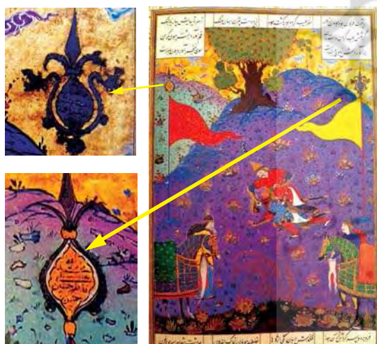
تصویر ۱۶. کشته شدن هومان به دست بیژن، منسوب به عبدالوهاب، موزه هنرهای معاصر، مأخذ: (Ibid: 235).