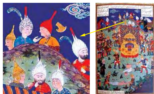
تصویر ۱۸. کشته شدن افراسیاب به دست کیخسرو، منسوب به باشدن قراء، موزه هنرهای معاصر، مأخذ: همان: ۲۵۱.