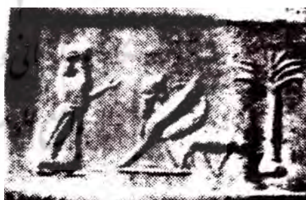
تصویر ۷. مهر استوانه‌ای دوره هخامنشی. مأخذ: صمدی، ۱۳۶۷: ۱۸۲.

شیر گریفین به دو صورت دیگر نیز یعنی «شیر گریفین شاخ‌دار» و «شیر گریفین شاخ‌دار با دم عقرب» در نقش برجسته‌های هخامنشی دیده می‌شود. شیر گریفین شاخ‌دار با دم عقرب بر روی درهای سه‌طرفه کاخ تچر هخامنشی و بر روی درهای چهار طرفه تالار صد ستون نقش بسته شده است. در این تصویر آنچه مظهر عناصر نامطلوب اهریمنی به شمار می‌رود مانند اندام زشت و دهشت‌آفرین وجود دارد. در این اثر موجود افسانه‌ای دم عقرب و پنجه‌هایی مانند عقاب و بدنی همانند بدن شیر اندامی چون گاو وحشی دارد (تصویر ۳).