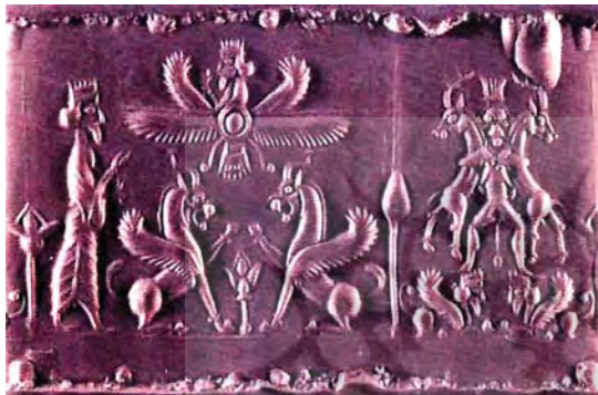
تصویر ۱۰. دو گریفین روبه روی هم. مأخذ: ملک‌زاده بیانی، ۱۳۶۳: ۹۸