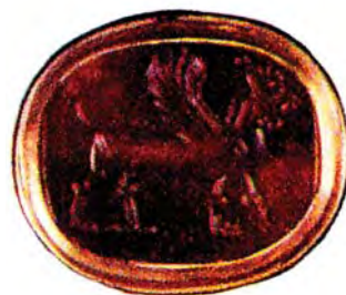
تصویر ۸. مهر هخامنشی، مجموعه کاپیتان اسپنسر.

در نقش برجسته‌ای بر روی آجر لعاب‌دار درشوش تصویر شیر گریفین شاخ‌داری نقش شده است. دو بال شیر به صورت افراشته و شاخ و دم نیز به حالت حلزونی