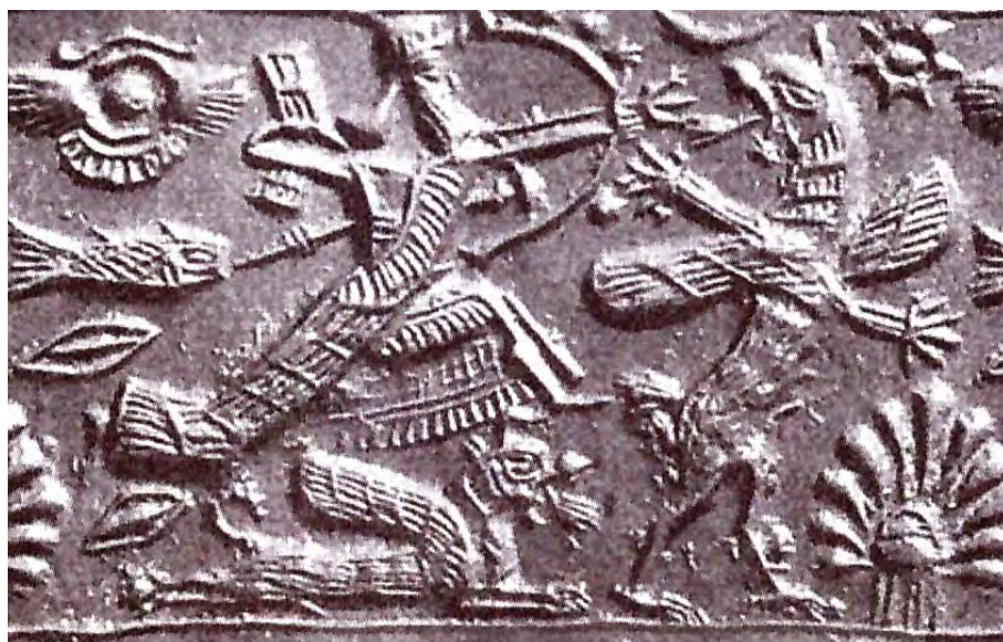
تصویر ۳۶. نبرد خدا با یک گریفین. مأخذ: دادور و مبینی، ۱۳۸۸: ۱۹۳.

جدول ۵. بررسی تطبیقی گاو نر بالدار با سر انسان بر روی مهرهای هخامنشی و آشوری. مأخذ: نگارندگان.