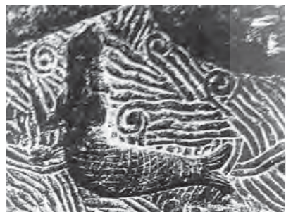
۲۹. یک مرد دریایی در حال شنا. برگرفته از سنگ بنای حجاری شده در کاخ سلطنتی سارگون دوم، دور شروکین، ارتفاع ۲۵۵ سانتی متر.