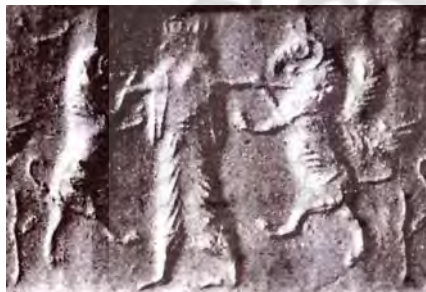
تصویر ۱۱. دو گریفین در حال نبرد با پادشاه. مأخذ: Reva, 1960: 163