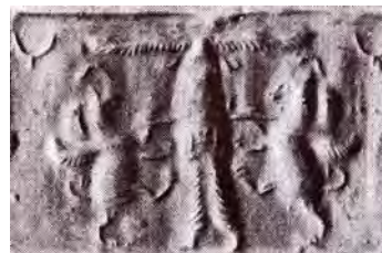
تصویر ۱۶. اثر مهر استوانه‌ای هخامنشی. مأخذ: دادور و مبینی، ۱۳۸۸: ۱۹۶