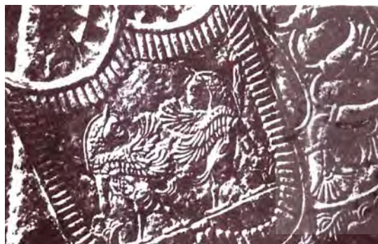
تصویر ۲. شیر گریفین، غلاف شمشیر یکی از بزرگ‌زادگان در نقش برجسته تالار بار عام داریوش.

اندک توضیحی درباره آن‌ها مشاهده کرد، اما کتابی که به‌طور جامع معرف این جانوران در هنر ایران باستان است کتاب «جانوران ترکیبی در هنر ایران باستان» نوشته دکتر ابوالقاسم دادور و مهتاب مبینی (۱۳۸۸) است که به‌خوبی این موجودات را طبقه‌بندی و معرفی کرده و در شناخت این موجودات و در بخش هنر هخامنشی بسیار راهگشاست. همچنین، حسین عابدوست مقاله‌ای با عنوان «تداوم حیات اسفنگس‌ها و هارپی‌های باستانی