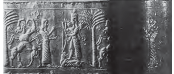
تصویر ۳۲. گاو با سر انسان.

جانوران ترکیبی مشترک در هنر نقش‌برجسته هخامنشی و آشوری، لاماسو و اسفنکس و بر مهرها گریفین و گاو بالدار با سر انسان است که بررسی تطبیقی