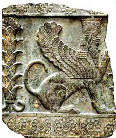
تصویر ۵. اسفنگس، نقش برجسته بر روی سنگ، از کاخ پرسپولیس، ۵۰۰ قبل از میلاد.

«نقش موجودات ترکیبی در انواع آثار هنری و صنایع دستی ایران بر دو نوع است: نخستین ترکیب انسان- حیوان که در اساطیر مصر، بین‌النهرین، آشور، چین، ژاپن، یونان و ... نیز دیده شده و شامل انسان- مار، انسان- عقاب، انسان- گاو، انسان- شیر، انسان- مرغ و ... است و دیگری ترکیب حیوان- حیوان مانند شیر- عقاب، گاو بالدار، بز بالدار و ...» (زمردی، ۱۳۸۲: ۲۵۶).