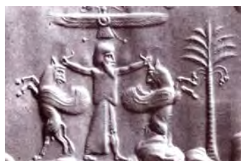
تصویر ۱۴. اثر مهر استوانه‌ای هخامنشی.