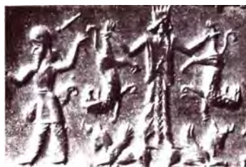
تصویر ۱۳. اثر مهر استوانه‌ای هخامنشی.