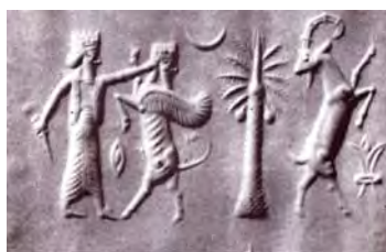
تصویر ۱۷. اثر مهر استوانه‌ای هخامنشی.