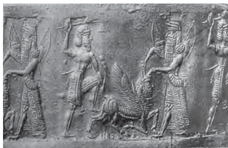
تصویر ۳۰. گیلگمش و انکیدو در حال قربانی گاو بالدار با سر انسان.