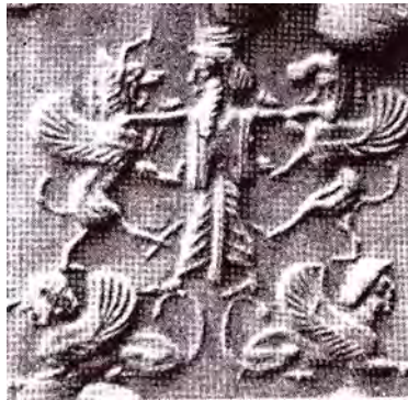
تصویر ۹. نبرد شاه با دو شیر گریفین، ایستاده بر روی دم دو اسفنگس مهر استوانه‌ای دوره هخامنشی.