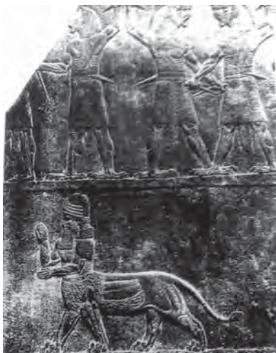
تصویر ۲۸. شیر دیوها و یک شیر قنطورس.