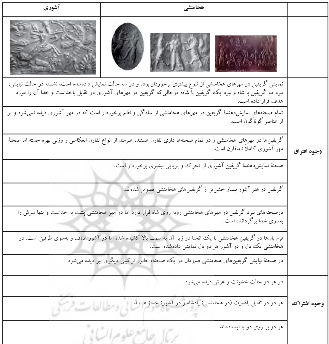
جدول ۴: بررسی تطبیقی گریفین هخامنشی و گریفین آشوری (بر روی مهرها).

در صحنه‌هایی که نقش «گوی بالدار» وجود دارد، این نقش فراتر از همه نقوش حک شده و جانور ترکیبی در زیر آن قرار دارد و از نظر اندازه نیز کوچک‌تر از تصویر شاه دیده می‌شود. قابل ذکر است که جانور ترکیبی در مهرهای هخامنشی به‌جز چند مورد همیشه در ارتباط با شاه تصویر شده و این نقش شاه است که در کانون تصویر نقش گردیده است. در حقیقت، سادگی و نظمی که در مهرهای هخامنشی دیده می‌شود در مهرهای آشور مشاهده نمی‌شود، جانور ترکیبی در کنار عناصر بسیاری شامل اشکال نمادین و خطوط قرار گرفته و در ترکیب‌بندی در مرکز توجه نیست.