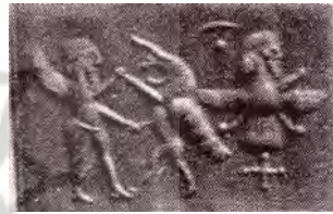
تصویر ۱۹. مهر هخامنشی با تصویر تک شاخ بالدار.

این جانور ترکیبی نقشی کم‌نظیر است زیرا در بیشتر نقوش جانوران شاخ‌دار، دوشاخ بر روی سر آن‌ها نقش بسته است (تصویر ۱۹).