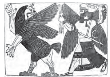
تصویر ۲۵. طرحی از یک نقش برجسته کشف شده از کاخ نینورته آشوریان در شهر نمرود.

اپکال لو ۲ است. اپکال لو جانوری با سر و بال عقاب و بدن انسان است. نقش این اپکال لوها در کنار درخت مقدس تصویر شده است، درخت مقدس بین دو اپکال لو به صورت یکی در میان حجاری شده (تصویر ۲۳)، جامه بلند حاشیه دارش با کمر بندی بسته شده، دشنه ای بر کمر بسته و صندل به پا دارد. این نقش برجسته از مرمر است (قفقوری، ۱۳۸۹: ۹۸). در نقش برجسته دیگری، تصویر پادشاه که به سمت درخت مقدس می رود به همراه دو اپکال لو در اطرافش که در حال حفاظت هستند و درخت مقدس که در سمت چپ تصویر است حجاری شده است (تصویر ۲۴).