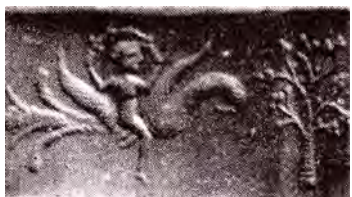
تصویر ۲۱. مهر هخامنشی با تصویر مرغ وارغن. مأخذ: همایون فرخ، ۱۳۴۹: ۷۸