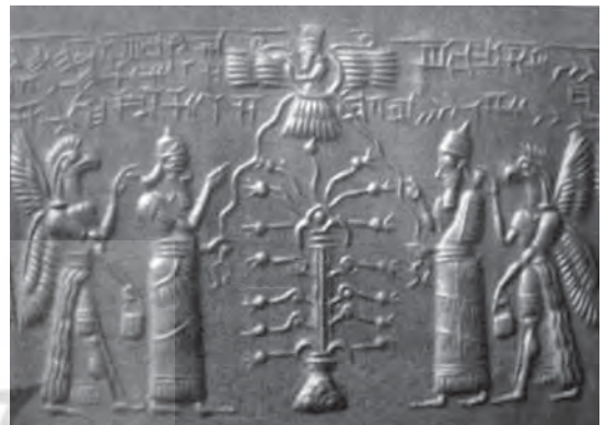
تصویر ۳۳. دو اپکاللو بر روی مهر استوانه‌ای.