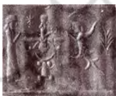
تصویر ۲۰. نقش انسان-پرنده.