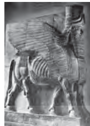
تصویر ۲۶. لاماسو آشوری.