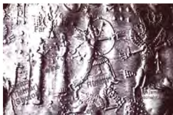
تصویر ۱۵. اثر مهر هخامنشی، شوش. مأخذ: بد، ۱۳۵۲: ۸۳