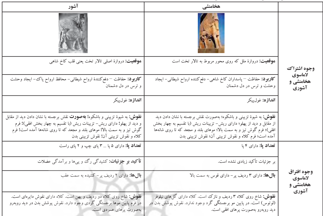
جدول ۲. بررسی تطبیقی لاماسو هخامنشی و لاماسو آشوری (بر روی نقوش برجسته).