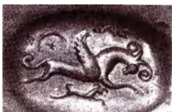
تصویر ۱۸. مهر هخامنشی با نقش قوچ بالدار.