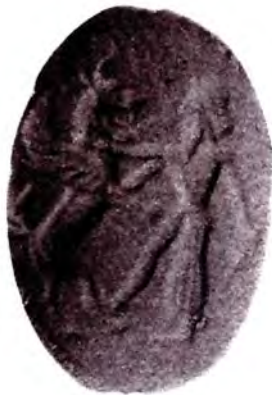
تصویر ۱۲. گریفین در حال نبرد با پادشاه. مأخذ: همایون فرخ، ۱۳۴۹: ۶۲