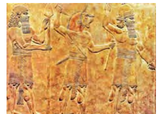
۲۲. نقش برجسته آشوری، تصویر یک اوگال لو.