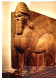
۲۷. (اسفنکس) شیر بالدار با سر انسان - موزه متروپولیتن.