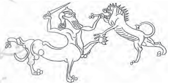
تصویر ۳۴. حمله قنطورس به دیوی به شکل شیر.