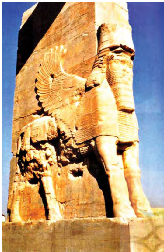
تصویر ۱. لاماسو، دروازه خشایار شاه، تخت جمشید.

اگرچه در کتاب‌هایی که مربوط به هنر ایران و همین‌طور بین‌النهرین است می‌توان تصاویر این جانوران را با