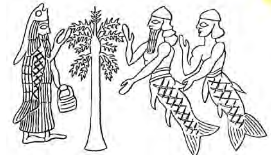
تصویر ۳۵. مرد دریایی و پری دریایی.