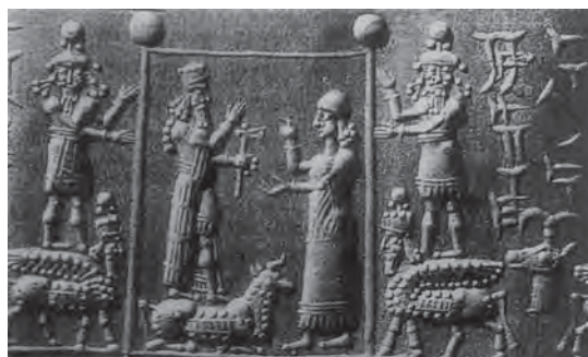
تصویر ۳۱. گاو بالدار با سر انسان.

پای پنجم که از نمای کناری دیده می‌شود نشان‌دهنده آن است که مجسمه‌ساز آن‌ها را به‌عنوان مجسمه‌های دارای بُعد در دو سوی قطعه سنگ می‌دانسته، به صورتی که پیکره‌ها هم از روبه‌رو و هم از نیمرخ دیده شوند. این پیکره‌ها که از سنگ آهک ساخته شده‌اند از جهتی با بنا یکی هستند و به دلیل داشتن سرپوش‌های بلند به همراه شاخ، چشم‌های فرورفته، پاها و بدن عضلانی و الگوی ظریف ریش، بیننده را محو تماشای خود کرده، اقتدار رعب‌آور پادشاه را به یاد می‌آورند. آشوری‌ها احتمالاً به این مسئله اعتقاد داشتند که این موجودات دورگه توانایی دور کردن شیطان را دارند (دیویس، ۱۳۸۸: ۳۱۵؛ تصویر ۲۶).