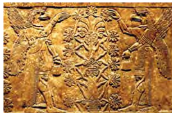
تصویر ۲۳. اپکال لو.