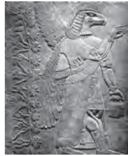
تصویر ۲۴. بخشی از نقش برجسته دیواری کاخ شمال غربی آشور نصیر پال دوم از مرمر سفید. مأخذ: مورتگارت، ۱۳۷۷: لوح ۲۵۸.