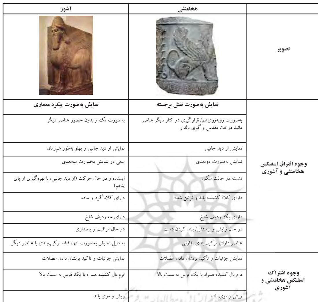
جدول ۳. بررسی تطبیقی اسفنگس هخامنشی و اسفنگس آشوری (بر روی نقوش برجسته). مأخذ: نگارندگان.

آرامش» و «سرد، خشک و رسمی» هستند درحالی که در تصاویر آشوری حس تحرک و پویایی و خشونت بیشتری به چشم می خورد. همچنین، در دوره آشوری به نمایش جزئیات توجه ویژه ای شده است (مانند تزئینات روی لباس و بدن، نمایش عضلات و...) که این ویژگی در دوره هخامنشی کمتر دیده می شود. در دوره آشوری مباحث هماهنگ (هارمونیک)، همچون تقارن، وحدت و یکپارچگی، دکوراتیو و مسطح، تکرار و تسلسل دیده می شود که تقارن انعکاسی (آینه ای) را می توان بارزترین ویژگی هماهنگ آن ها بیان کرد. در این دوره کمپوزسیون یا ترکیب بندی در دو حالت مشاهده می شود: در حالت اول، معیار و ملاک اصلی بر پایه «موقعیت و شأن» استوار بوده که در بیشتر تصاویر درخت مقدس در وسط تصویر، خدا و شاه در دو طرف آن و جانور ترکیبی در پشت آن ها نقش شده است و یا به صورت ردیفی از جانوران ترکیبی است که به صورت