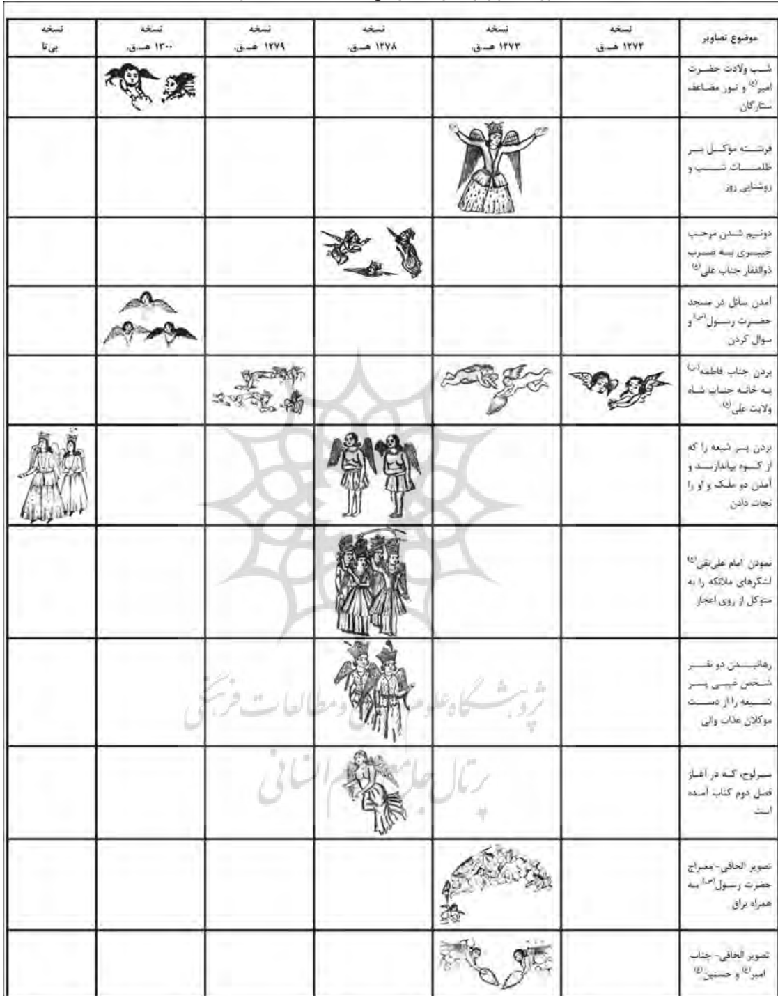
جدول ۲. تصاویر فرشتگان آمده در نسخ تحفة المجالس (ماخذ: نگارنده)