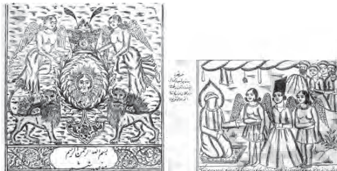
تصویر ۶- راست: بردن پسر شیعه را که از کوه بیاندازند و آمدن دو ملک و او را از موکلان عذاب نجات دادن و نزد امام محمدتقی (ع) بردن (نسخه ۱۲۷۸ هـ.ق.); چپ: تصویر سرلوح (نسخه ۱۲۷۸ هـ.ق.).