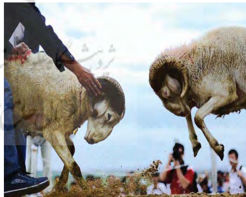
تصویر ۳- جنگ قوچ، از رسوم کهن ترکمن‌ها

از رسم دیگر جشن عروسی، می‌توان رسم اوچ (قوچ جوان) را نام برد که در واقع، به‌مانند گرفتن رضایت داماد از عروس بود؛ بدین ترتیب که، عروس در دستش یک بره قوچ می‌گیرد و سوار بر اسب می‌شود و می‌تازد؛ داماد که چند تن از دوستانش او را همراهی می‌کنند، در تعقیب عروس، سوار بر اسب می‌رود تا بره را از دست او بگیرد. این عمل، نماد گرفتن جواب مثبت از عروس است.