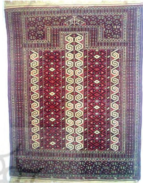
تصویر ۵- قالی سجاده‌ای ترکمن با نقش قوچ در نوارهای متن (اشنبرنر، ۱۳۷۴: ۱۰۷)

می‌شوند- که به آن واگیره می‌گویند. در قالی‌های ترکمن، واگیره اصلی هر نقش، عمدتاً به دو صورت تکرار می‌شوند، یا با یک محور تقارن یا با دو محور تقارن.