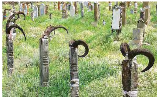
تصویر ۲- تزیین آیینی با شاخ‌های قوچ در یک قبرستان متعلق به ترکمن‌ها.

پانزده قرن زندگی عشایری و کوچ نشینی، اساس زندگی آن‌ها را بر صبر و مقاومت بنا نهاد. ترکمن‌ها اهل کشت و زرع نبودند و به دامداری و گله‌چرانی اشتغال داشتند؛ آن‌ها از ابتدای این حرکت بزرگ، همواره سعی بر حفظ و پرورش دام‌های خویش داشتند؛ تا بدین طریق زندگی و اقتصاد مستحکم خود را حفظ کنند.