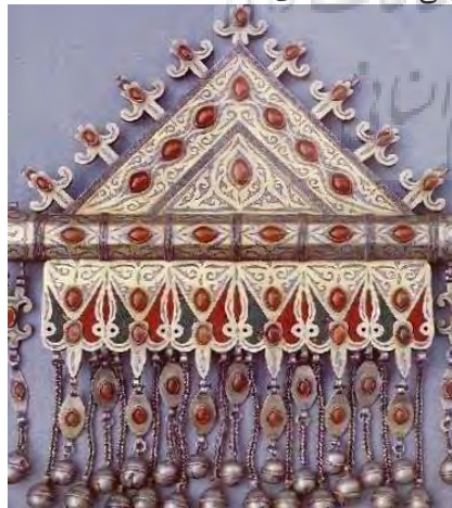
تصویر ۴- زیور آلات ترکمنی با نقش مایه شاخ قوچ (محمدی، ۱۳۸۸: ۷۵)

از اصول سنتی و فرهنگی ترکمن‌ها، لباس و پوشاک خاص آن‌هاست که با هنرهای گوناگون تزیین می‌شوند. در جامعه سنتی این قوم، هم برای مردان و هم برای زنان، لباسی با ارزش و دارای اصالت قومی است که مزین به هنر سوزن دوزی باشد؛ حتی تن پوش مردان نیز خالی از نقش و نگار و سوزن‌دوزی نیست. از مهم‌ترین نقوش به کار رفته در سوزن‌دوزی‌ها نقش معروف «قوچوق» است؛ این نقش بیش‌تر روی شلوار زنانه، کلاه، یقه، سر آستین‌ها و روسری دوخته می‌شود. این نقش در زیور آلات زنان ترکمن نیز به‌کار رفته است. تصویر ۴، یک گلوبند با نقش قوچ را نشان می‌دهد (محمدی، ۱۳۸۸: ۹۶).