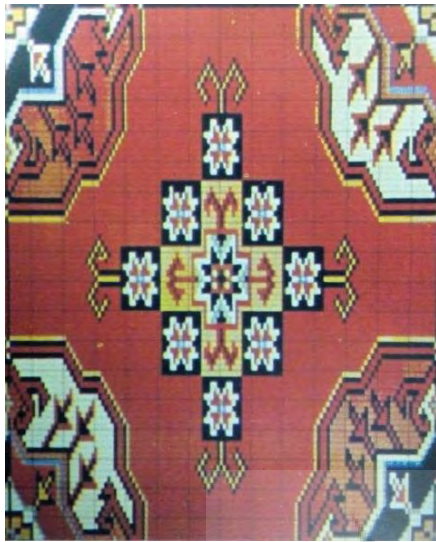
تصویر ۱- بخشی از نقشه یک قالی ترکمن (حصوری، ۱۳۷۱: ۲۴۱)

در این پژوهش، نقش قوچ را از چند دیدگاه مورد بررسی قرار داده‌ایم که در نمودار ۱، به شکل مختصر مشاهده می‌شود.