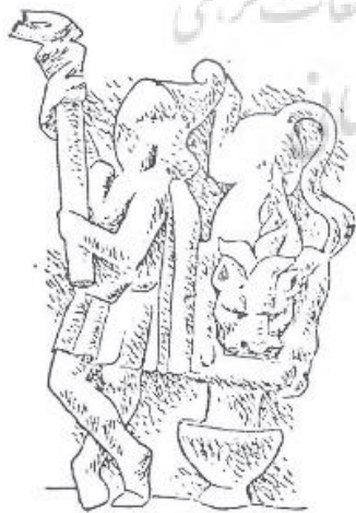
تصویر ۱۳: کوتس و شیری روی یک ظرف (ورمازرن، ۱۳۷۵: ۱۷۸)

در آیین مهر در موارد زیادی تصویر شیر را نزدیک یا روی یک کوزه (تصویر ۱۳) می‌بینیم (ورمازرن، ۱۳۷۵: ۱۷۷).