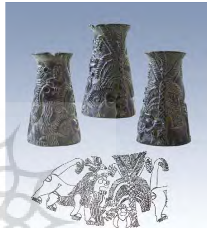
تصویر ۱۵: تنگ کوچک مخروطی، ظرف سنگ صابونی (مجیدزاده، ۱۳۸۲: ۳۷)

شد، می‌توان به وجود برخی از نشانه‌های مهری در نقوش جیرفت (تصویر ۱۲) پی برد.