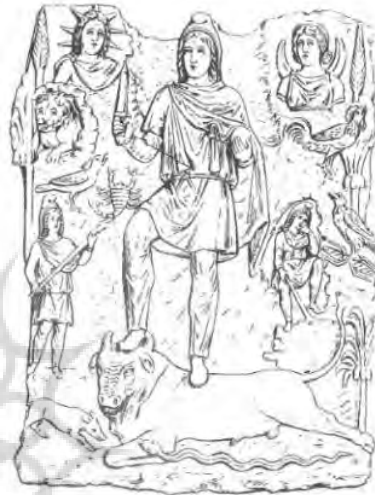
تصویر ۵: تصاویر میتراپی. نقش برجسته‌ای از مرمر سفید(رضی، ۱۳۸۱: ۸۲۷)

است(همان: ۸۲). ایزد خورشید و ایزد ماه روی حاشیه غار در بسیاری از نقش برجسته‌های مهری دیده می‌شود (تصویر ۴-۵). خورشید و ماه، به غیر از وظیفه‌ای که در موقع ذبح گاو به آنان محول گشته، سمتی هم در مراتب سیارات هفتگانه دارند (همان: ۱۹۱). از دید مهریان، خورشید فرمانروای آسمان‌ها بود که بر گردش و نظم اجرام آسمانی، نظارت می‌کرد و زندگی را روی زمین با تابش و روشنایی و گرمای خود سرشار می‌نمود (کومون، ۱۳۸۰: ۱۹۰).