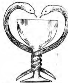
تصویر ۱۱: دوستکامی مهری که دو مار در آن زندگی می‌ریزند (حامی، ۲۵۳۵: ۱۳۴)

در آیین مهر، پس از این که شکار توانفرسای گاو و ذبح هیجان‌آور آن، انجام گرفت، در ضیافتی که به عنوان حسن ختام برپا می‌شود، به همراه سل گوشت چهارپای قربانی شده، صرف می‌شود (همان: ۱۱۷-۱۱۸). همچنین در شهر سردیکا ۱۴ (سوفیا) پرده‌ای هست که میترا و سل را بر سر سفره طعام نشان می‌دهد و کوزه‌ای روی زمین نهاده شده است (همان: ۱۱۱). کوزه حاوی گوشت قربانی شده که در سفره طعام سل و میترا پس از قربانی شدن گاو وجود دارد، در بسیاری از مهرکده‌ها نقش بسته شده است. شاید ظرفی که به زیبایی تمام، به شکل سر گاو، در ظرف جیرفت (تصویر ۱۰) نقش بسته شده و درون آن تکه‌هایی دیده می‌شود، ظرف حاوی گوشت قربانی شده باشد که پس از قربانی گاو، صرف شده و جاودانگی می‌بخشد. به علاوه نان و شراب معرف و جانشین گوشت و خون گاو مقدس است (همان: ۶۱). مارانی که در تصویر ۱۰، دیده می‌شوند، ذهن را به سمت نقش مارهای موجود در مهرکده‌ها که سر در دوستکامی ۱۵ کرده‌اند، می‌کشاند (تصویر ۱۱). مقایسه نشانه‌های مهری ذکر شده با نقوش ظرف سنگ صابونی جیرفت (تصویر ۱۰) به وجود نشانه‌های آیین میترا در نقوش این ظرف (تصویر ۱۰) گواهی می‌دهد.