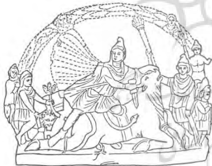
تصویر ۹: میترا در حال کشتن گاو (ورمازن، ۱۳۷۵: ۷۹)

دانه‌هایی دیده می‌شود. نقوش این ظرف جیرفت (تصویر ۸)، ما را به یاد آنچه، در مورد آیین مهر و نمونه‌هایی از مهرکده‌ها آمده است، می‌اندازد: در مهرکده‌ای نقش برجسته‌ای (تصویر ۹)، مربوط به قربانی گاو توسط میترا یافت شده است که روی آن هنوز بقایای دانه‌های قرمز رنگ پدیدار است (همان: ۷۹-۸۰). این دانه‌های قرمز رنگ در برخی از نقوش جیرفت نیز بر روی بدن گاوها دیده می‌شوند. در این نقش برجسته مهری، ماری میان میترا و گاو مورد ذبح، قرار گرفته که سر را به طرف ناحیه مجروح بدن گاو می‌کشاند (همان: ۸۰). در آیین مهر، قربانی گاو در جایی تاریک، دور از نور خورشید یا هنگام شب انجام می‌شد (رضی، ۱۳۸۱: ۱۳۴). مهرکده‌ای یافت شده (تصویر ۹) که، ورمازرن در مورد نقوش آن می‌گوید: لبه غار به شکل دایره است و از شاخ و برگ بسیار پوشیده شده، و این اشاره رمز آمیزی است به این اصل که کشتن گاو، باعث وفور نعمت و فراوانی در جهان می‌گردد. حاشیه غار، مزین به تندیس‌های نیم تنه از خدای خورشید (سل) و خدای ماه (لونا) و کلاغ (مبشر میترا) است (ورمازن، ۱۳۷۵: ۸۰). در آیین میترا، در جایی که دشنه مهر در کتف گاو نر فرو رفته و ناحیه مجروح بدن گاو، بته رز و خوشه گندم می‌روید (حامی، ۲۵۳۵: ۱۵).