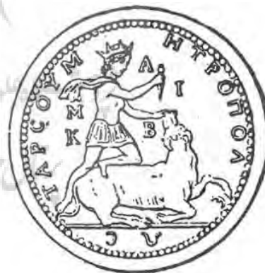
تصویر ۶: سکه‌ای که مربوط به زمان گردیانوس سوم است و میترای کشته گاو را نشان می‌دهد.(ورمازن، ۱۳۷۵: ۳۲)

در نقوش این ظرف(تصویر ۷)، دو پیکره شاخ‌دار، به نظر می‌رسد که در حال نبرد با مارها هستند. در این نقش (تصویر)، گاوها در ردیف بالایی کادر قرار گرفته‌اند. عقربی نزدیک و درست در زیر شکم گاو سمت چپ بالای تصویر قرار دارد و چنگال‌های خود را باز کرده است. قابل توجه است که موجود شاخ‌دار سمت راست که به نظر می‌رسد، اهریمن است، چنگال‌هایی شبیه عقربی دارد که در زیر شکم گاو، قرار گرفته است. اکنون به مقایسه نقش ظرف جیرفت (تصویر ۷) با نشانه‌های مهری می‌پردازیم. ورمازن ۱۳ درباره اهریمن