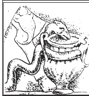
تصویر ۱۴: مهرابه نزدیک شهر وین پایتخت اتریش (حامی، ۲۵۳۵: ۱۳۵)