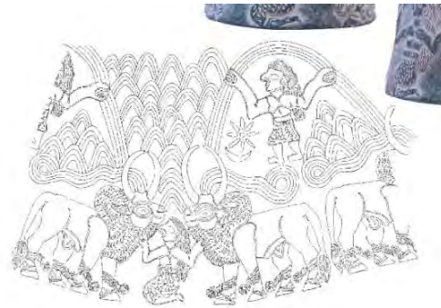
تصویر ۱: تنگ مخروطی بلند، سنگ صابونی (مجیدزاده، ۱۳۸۲: ۱۴)

۹۱). تولد میترا از صخره، به صورت‌های مختلفی در مهرکده‌های گوناگون نشان داده شده است. در مهرابه فرانکفورت ۵ ، نقش برجسته‌ای وجود دارد که تولد مهر از صخره را به تصویر کشیده است (تصویر ۲).