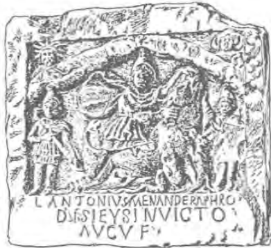
تصویر ۳: میترا در حال کشتن گاو، موزه واتیکان. (رضی، ۱۳۸۱: ۸۲۷)