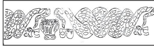
تصویر ۱۰: ظرف استوانه‌ای، سنگ صابونی، سر تمام رخ گاو در میان مارها (مجیدزاده، ۱۳۸۲: ۱۰۱)

اینجا به واکاوی نشانه‌های آیین میترا در نقوش آن می‌پردازیم، تصویر ۱۰، است که در نقوش آن، دو مار به طرف ظرفی که شبیه به سر گاو است و در آن تکه- های کوچکی وجود دارد، خزیده‌اند.