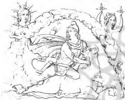
تصویر ۴: تصاویر میترا. نقش برجسته‌ای از مرمر سفید (ورمازن، ۱۳۷۵: ۲۲۳)