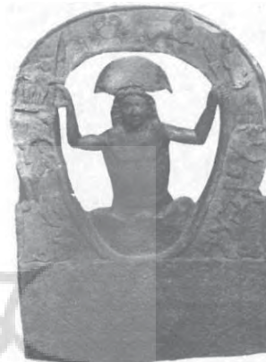
تصویر ۲: زایش مهر از صخره سنگ مهرابه فرانکفورت (رضی، ۱۳۸۱: ۱۶۳)

سنگ و صخره، نماد آسمان است (رضی، ۱۳۸۱: ۳۸۷). مشابه بودن جنس آسمان و شهاب سنگ موجب شد، غار میترا، بی‌چون و چرا، به عنوان تصویری از جهان هستی پذیرفته شود و جهان، غار عظیمی فرض گردد (مرکلباخ، ۱۳۸۷: ۱۳۳). در مهرابه دوچ آلتن بورگ ۶ ، نزدیک وین ۷ نقش جالب توجهی از میترا در حالی که، از یک صخره مخروطی شکل زاده می‌شود، وجود دارد (رضی، ۱۳۸۱: ۲۸۵ و ۲۸۶). در محراب مهرکده سنت پریسک ۸ در رم نیز نقش قربانی گاو که در غاری انجام می‌گیرد، دیده می‌شود (ورمازن، ۱۳۷۵: ۲۲۳). همچنین نمونه‌ای از تصاویری که میترا در غاری گنبدی شکل، مشغول ذبح گاو مقدس است، چه در نقش برجسته باز یافته در یوگوسلاوی ۹ یا بخش‌های دیگر امپراطوری روم دیده شده است (همان: ۲۲۲ و ۲۲۳). به علاوه، نمونه‌ای از نقش پیکر ایزد خورشید (سُل) و ایزد ماه (لونا) ۱۰ ، روی حاشیه غار، مربوط به آیین میترا در بولونی ۱۱ پیدا شده