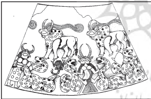
تصویر ۷: تنگ مخروطی، سنگ صابونی (مجید زاده، ۱۳۸۴: ۳۴)

از مقایسه تصویر ۱ (نقوش ظرف سنگی جیرفت)، با نقوش مهرکده‌ها و نشانه‌های آیین مهری ذکر شده، می‌توان به شباهت آن‌ها پی برد. تصویر ۷، تنگ مخروطی از دیگر آثار باز مانده از تمدن جیرفت را نشان می‌دهد که در اینجا، به بررسی ارتباط نقوش آن با آیین میترا می‌پردازیم: