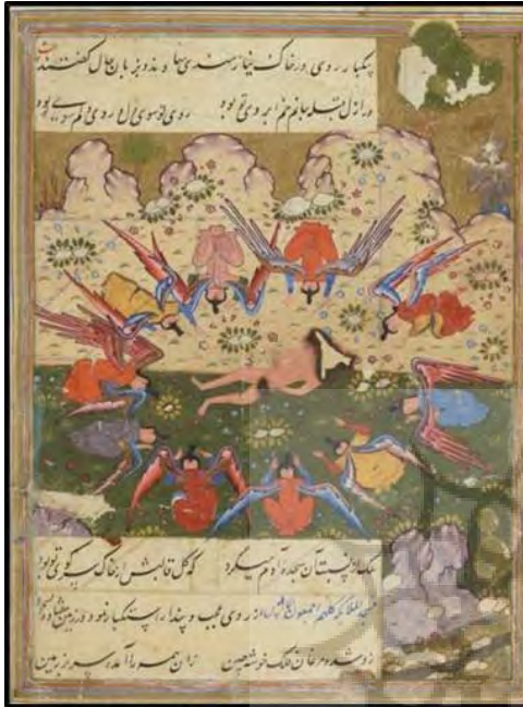
تصویر ۱: حضرت آدم برهنه بر روی زمین، مجالس العشاق، صفوی، ۱۵۶۰ م، کتابخانه ملی پاریس به شماره ۷۷۵ متمم فارسی www.gallica.bnf.fr

است درحالی‌که فرشتگان در حال سجده کردن در برابر او هستند. در این نگاره نگارگر نشانه‌های دیگری غیر از هاله مقدس را برای حضرت آدم در نظر گرفته است و حتی برای تأکید بیشتر نام آدم عدم را نیز در کنار تصویر حضرت آدم (ع) نوشته است. (تصویر شماره ۲)