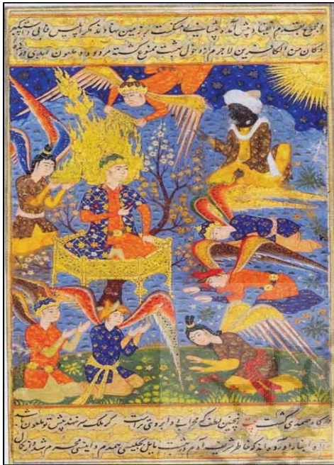
تصویر ۵: فرشته‌هایی که برای حضرت آدم شعله مقدس می‌آورند. نسخه، ۱۵۷۰ م، موزه لوور پاریس (Romani, 2008: 156)

طبق‌هایی از شعله‌های زرین به نشانه تقدس به‌نوعی اغراق در زمینه فرامادی بودن جایگاه حضرت آدم در این نگاره‌ها دارد و نشانگر پاکی و نورانیتی است که به‌عنوان موهبتی الهی بر انبیاء اهداء شده است. (تصاویر شماره ۴ و شماره ۵)