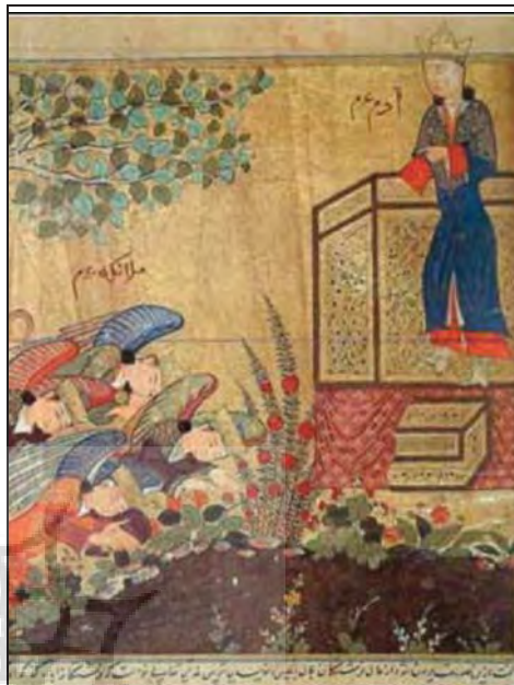
تصویر ۶: آدم (ع) با تاج و تخت خلیفه الهی. (بخشی از تصویر شماره ۲)

آدم حتی از کادر نگاره نیز بیرون زده و بالاتر قرار گرفته است و نوشتن عنوان آدم در کنار پیکره او در نگاره، همه و همه از نشانه‌هایی است که برای تأکید بیشتر بر موقعیت و جایگاه آدم (ع) توسط نگارگر به کار گرفته شده است. (تصویر شماره ۶)