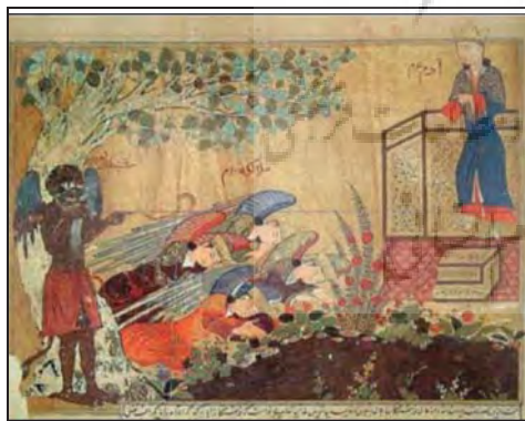
تصویر ۲: حضرت آدم (ع) با تاجی بر سر، ایستاده بر تخت خلیفه الهی، تاریخ طبری، ۱۴۱۶ م، موزه توپقاپی، استانبول B۲۸۲. (Sheila R, 1990: 17)

تعداد ۸ نگاره باقیمانده که همگی به قرون ده و اوایل یازده هجری قمری اختصاص دارد، برای نشان دادن تقدس حضرت آدم، او را با شعله مقدس در اطراف سرش به تصویر درآورده‌اند که در ذیل، بخشی از این نگاره‌ها که شمایل حضرت آدم را همراه با شعله