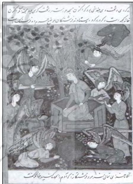
تصویر ۴: فرشته‌هایی که برای حضرت آدم شعله مقدس می‌آورند. قصص الانبیاء، صفوی، ۹۸۲ ه.ق، توپقاپی سرای، استانبول به شماره H1۲۲۷ (Milstein, 1999: 293)

۱ - ۲ - فرشته‌ها با طبق‌هایی از نور: فرشتگان پیام‌آوران بالداری هستند که میان خدایان و بشر ارتباط ایجاد می‌کنند (هال، ۱۳۸۳، ۲۶۰) می‌توان گفت تلفیق پیکر انسان با بال‌های بزرگ از دیرباز نمادی از انسان - خدا محسوب می‌شده است و حضور فرشته‌ها در درگاه خداوند و واسطه بودن آنان میان بارگاه الهی و انسان باعث شده که فرشته‌ها در ترکیبی از پیکر انسان و بال‌های پرنده به ظهور برسند. حضور فرشته‌ها در بسیاری از نگاره‌ها تداعی‌کننده فضایی قدسی و آسمانی است بنابراین در اکثر نگاره‌هایی که مربوط به حکایت آدم (ع) و حوا است دیده می‌شوند.