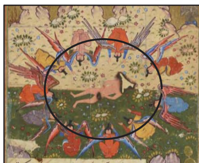
تصویر ۸: حضرت آدم (ع) در مرکز ترکیب‌بندی دایره. (بخشی از تصویر شماره ۱)

۱ - ۴- ترکیب‌بندی: از دیگر مواردی که نگارگران برای تأکید بیشتر بر جایگاه پیکره حضرت آدم در نگاره‌ها به کار بسته‌اند قرار دادن آدم (ع) در مرکز ترکیب‌بندی و کادر نگاره است. در تعداد زیادی از نگاره‌ها جایگاه حضرت آدم در مرکز توجه نگاره قرار داده شده است، حتی در مواردی که تخت آدم (ع) در میان نگاره قرار نگرفته باز چیدمان عناصر بر روی یک قوس حلزونی به گونه‌ای است که او در نقطه شروع این گردش و کانون توجه نگاره است؛ اما در بیشتر نگاره‌های این مضمون، با ترکیب‌بندی قرینه روبرو هستیم. به عنوان مثال در نگاره‌ای از قصص الانبیاء تخت حضرت آدم بر روی خط میانی نگاره قرار گرفته و فرشتگان در برابر او و در دو طرف حضرت آدم در حال سجده هستند و این موضوع باعث شده تا توجه‌ها بیشتر به سمت حضرت آدم که در میان این ترکیب‌بندی قرینه قرار گرفته جلب شود. در نگاره‌ای از مجالس العشاق آدم (ع) درست در مرکز نگاره و بر روی خطی که حدفاصل بین طبیعت سرسبز و رنگ خاکی صخره‌هاست، با بدنی عریان تصویر شده است. در این تصویر، حضرت آدم هم در مرکز نگاره قرار گرفته و هم در مرکز دایره‌ای که محیطش را فرشتگانی که بر او سجده می‌کنند تشکیل داده‌اند. (تصویر شماره ۸) ترکیب‌بندی خاص این تصویر به وضوح تمام بر مرکزیت وجود آدم تأکید نموده و برتری و محور بودن او را در خلقت هستی نشان می‌دهد.