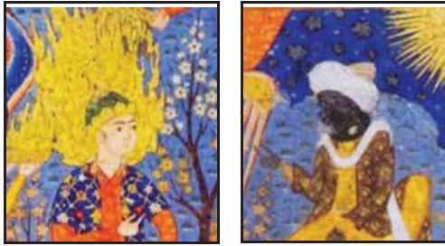
تصویر ۱۱: نمونه‌ای دیگر از تقابل سیمای جوان حضرت آدم در برابر شمایل سالخورده و تیره ابلیس. (بخشی از تصویر شماره ۵)