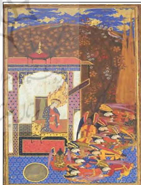
تصویر ۷: آدم (ع) نشسته بر تخت خلیفه الهی. حبیب السیر، جلد اول، ص ۲۸، اوایل سده ۱۱ ه.ق. مجموعه کاخ گلستان به شماره ۲۲۳۷ (نگارنده)

در نگاره‌ای دیگر که به حبیب السیر اختصاص دارد نیز، آدم (ع) بر تختی از زر سرخ که در بارگاهی قرار گرفته نشسته و لباس‌های فاخری بر تن دارد، علاوه بر این نگارگر از شعله مقدس نیز در اطراف سر