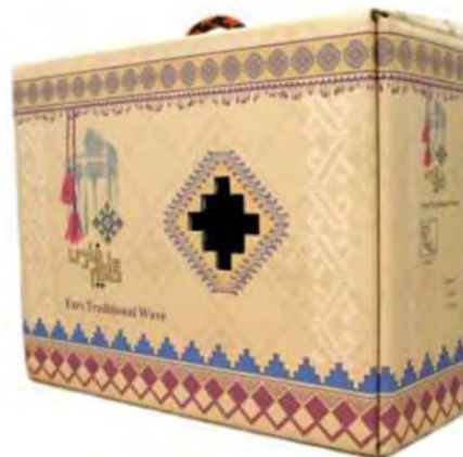
تصویر ۱: بسته‌بندی گلیم فارس. بسته‌بندی یک کالای هویتی می‌تواند با استفاده از نشانه‌های آشنای محلی یا ملی شکل گیرد. Image. 1: Felicion packing. The packaging of an item of goods can be made using familiar local or national indications (Gasemkhani, 1389).

طراحی بسته‌بندی نشان می‌دهد که ارزش‌های فرهنگی زیادی در بازار وجود دارد. از زمانی که طراحی بسته‌بندی به صورت ابتدایی در بازار شکل گرفت (سوپرمارکت، کالاهای جمعی یا فروشگاه‌های بزرگ) جایی که مردم پیش‌زمینه‌ی فرهنگی متنوع و باارزش در کنار هم دارند، فوراً باید توجه مصرف‌کننده را جلب کنند. از طریق تحقیقات گسترده در بازار و برنامه‌ریزی به کارگیری از عناصر طراحی، نشانه‌های فرهنگی در خدمت ارزش‌های فرهنگی قرار می‌گیرند. تأثیر واقعی طراحی بسته‌بندی مصرف‌کننده را وادار می‌کند که خود و آرمان‌هایش را در طراحی عناصر بسته‌بندی ببیند.