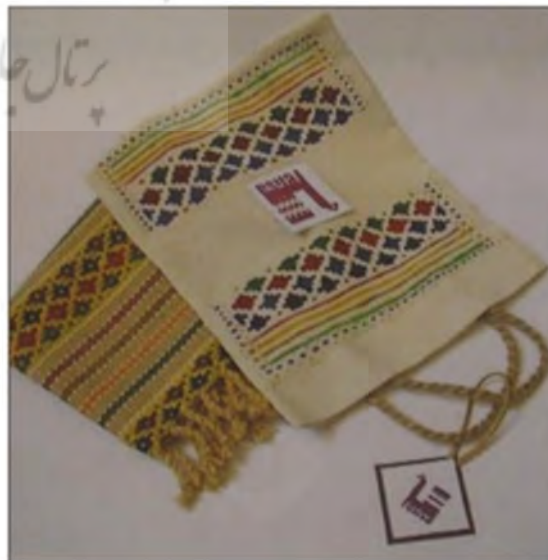
تصویر ۲: طراحی بسته‌بندی مصرفی منسوجات صنایع‌دستی، بسته‌بندی محصولات سرامیکی از جنس مقوا. Image. 2: Design of consumer packaging of handmade textiles, Cardboard ceramic carton packaging (Qasemkhani, 2010)