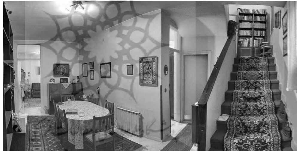
تصویر ۲: فضای داخلی خانه‌ای در خیابان پاستور