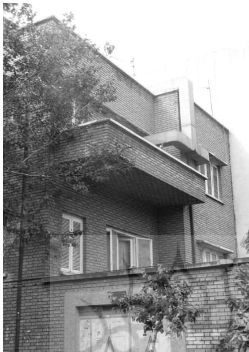
تصویر ۱: نمای بیرونی خانه‌ای در محله ایرانشهر کوچه فریدونشهر

برای نگارش روایت‌های خانه‌ها، ضمناً محقق باید فهم بهتری از سیاق اجتماعی و فرهنگی زندگی در خانه‌های آن دوره پیدا می‌کند. از این رو به موازات بررسی خانه‌ها، به مطالعه داستان‌هایی از نویسندگان این دوره از ادبیات ایران پرداخت که بیانگر شرایط زندگی و شهر در این سال‌ها بود تا این فهم اجمالی از سیاق، علاوه بر غنی‌تر کردن تعامل در مصاحبه‌ها، به نوشتن روایت خانه‌ها نیز کمک کند.