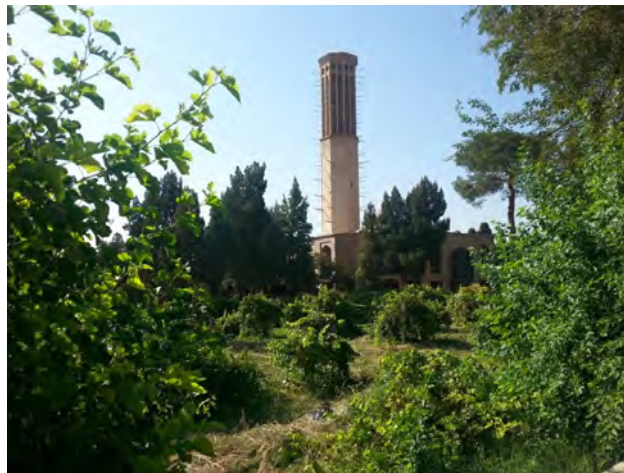
تصویر ۵: باغیانی منظرساز در باغ دولت‌آباد یزد. عکس: سید محمدرضا خلیل‌نژاد، ۱۳۹۶.

منظر و طراحی محیط‌های شهری می‌توان یافت. اوج این افول را در باغ فین کاشان می‌توان دید که درختان میوه بومی و ایرانی جای خود را به سطوح چمنی با بذرهای خارجی داده‌اند. این وضعیت امروز جامعه ماست. جامعه‌ای که با دارا بودن یکی از استثنای‌ترین اقلیم‌های حیاتی در محدوده مرزهای فیزیکی و معرفت فلاحی در محدوده مرزهای فرهنگی خویش می‌تواند متنوع‌ترین شیوه‌های منظرسازی مثمر را احیا نموده و با رویکردی اقتصادی-بوم‌شناختی و رای آرایش صوری محیط، به آرایه‌های باطنی فرهنگ خویش گوش فرا دهد.