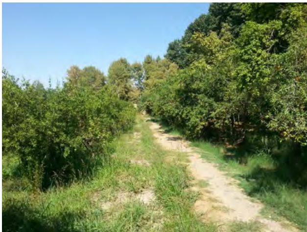
تصویر ۶: منظر مثمر در باغ پهلوان پور مهریز. عکس: سید محمدرضا خلیل‌نژاد، ۱۳۹۶.