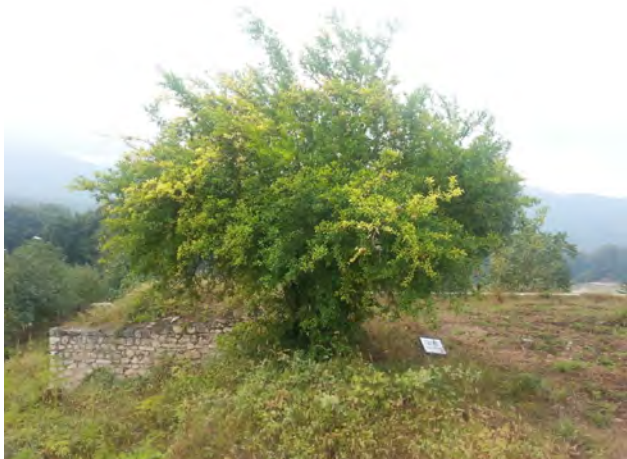
تصویر ۲: درختچه خودروی انار در باغ عباس‌آباد بهشهر. عکس: سید محمدرضا خلیل‌نژاد، ۱۳۹۶.