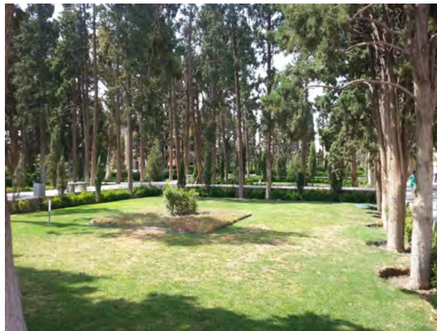
تصویر ۳: تغییر کاربری کرت‌های میوه‌کاری به سطوح چمن‌کاری در باغ فین کاشان. عکس: سید محمدرضا خلیل‌نژاد، ۱۳۹۶.