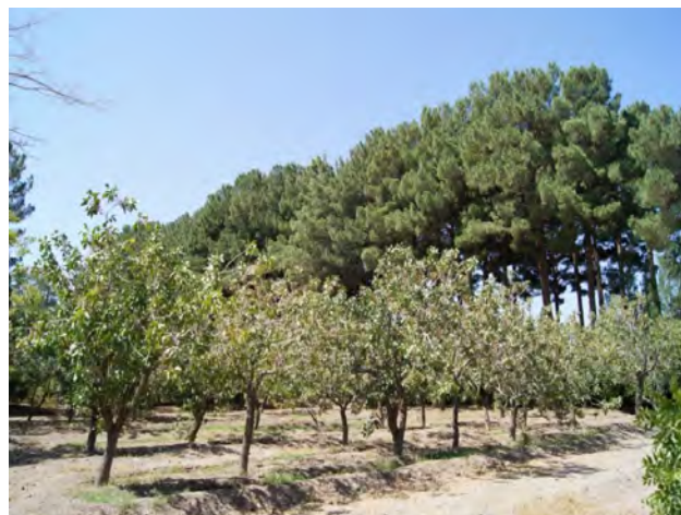
تصویر ۱: کرت پسته در باغ اکبریه در بیرجند. ناظر علاوه بر منظر تولیدی در پیش‌زمینه، منظر زینتی پس‌زمینه (محور اصلی) را نیز می‌بیند.