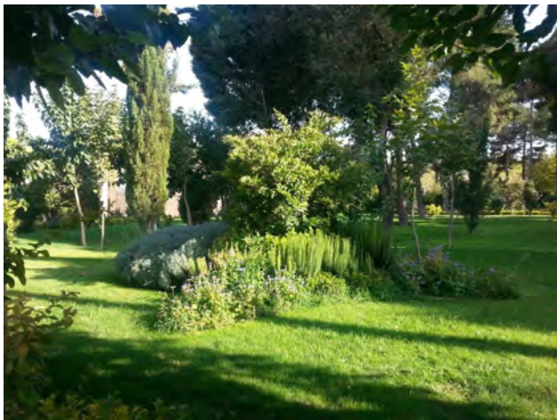
تصویر ۴: گل‌کاری، چمن‌کاری و کاشت درختچه‌های گسترده در باغ چهلستون اصفهان. عکس: سید محمدرضا خلیل‌نژاد، ۱۳۹۶.