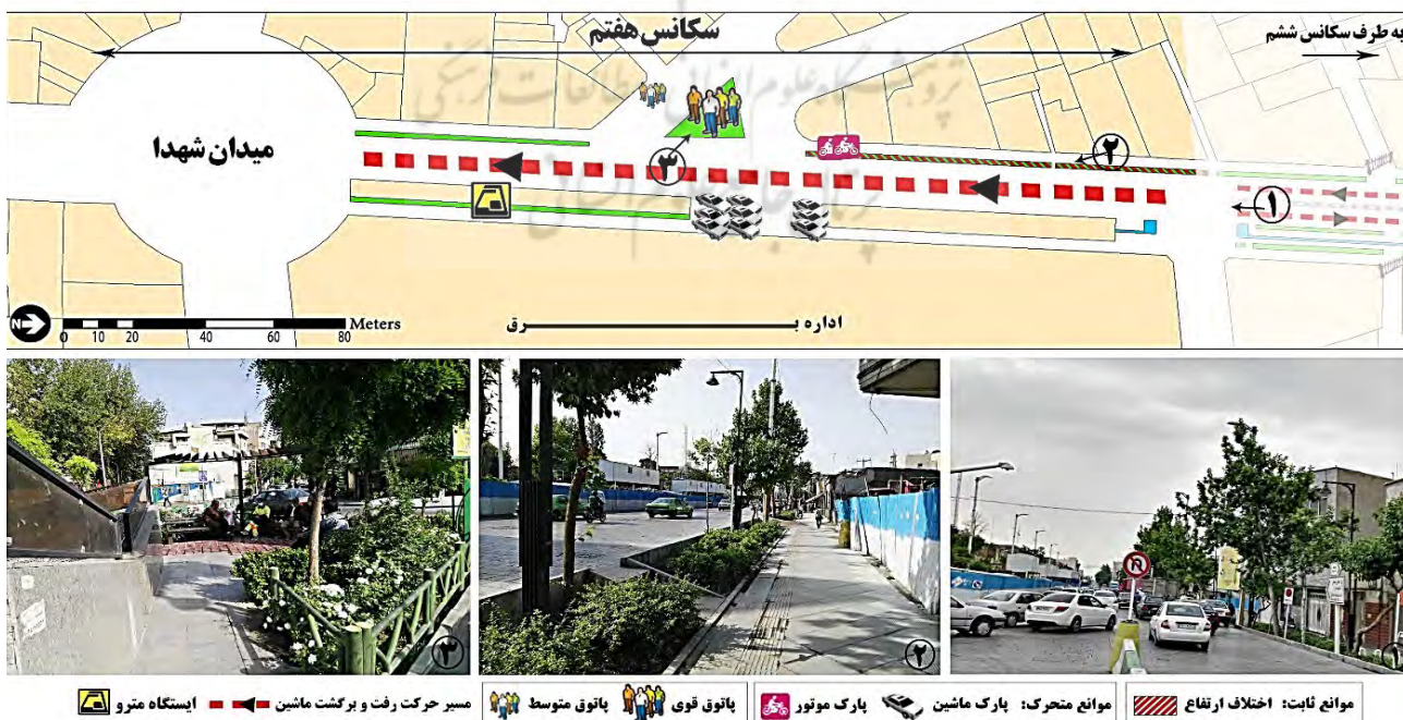
تصویر ۶: بیان تصویری خصوصیات مهم زندگی جمعی سکانس هفتم. ۱. شلوغی و ترافیک زیاد حرکت سواره در عصرها. ۲. اختلال در حرکت پیاده ناشی از اختلاف ارتفاع زیاد بین پیاده‌رو و سواره‌رو. ۳. وجود پاتوق سازماندهی‌شده با کیفیت محیطی قابل قبول، مأخذ: نگارندگان.

در فضا کم‌تر مشاهده می‌شود. حجم زیاد وسایل نقلیه عبوری با سرعت‌های گاهاً زیاد و ترافیک‌های نسبتاً شدید (معمولاً در عصرها)، در کنار ملک وسیع اداره برق که در یک طرف مسیر، جداره غیرفعال و بسته‌ای را ایجاد کرده، سبب تسلط خودرو و خودرومداری و افت شدید کیفیت زندگی افراد پیاده شده است (تصویر ۶).