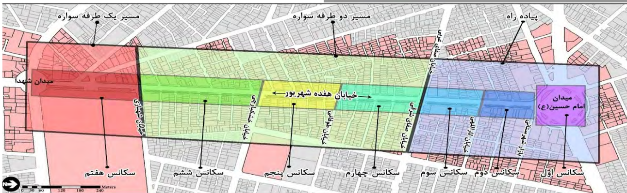
تصویر ۱: خصوصیات محور هفده شهریور، همراه با سکانس‌های تعیین‌شده در آن، مأخذ: نگارندگان.