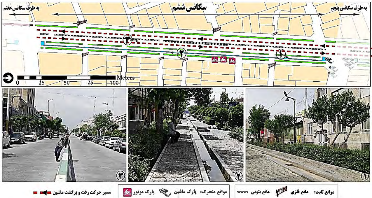
تصویر ۵: بیان تصویری خصوصیات مهم زندگی جمعی سکانس ششم. ۱. جداره‌ای غیر پیاده‌مدار و غیرفعال. ۲. ترجیح افراد در نشستن در نقاط دارای سایه. ۳. پریدن گه‌گاه افراد از مانع نفوذناپذیر وسط مسیر سواره، مأخذ: نگارندگان.

عوامل اصلی تقویت‌کننده زندگی جمعی در سواره‌رو یک‌طرفه مسیر شامل وجود قرارگاه‌های رفتاری و استقرار ورودی مترو بوده است. عوامل اصلی تضعیف‌کننده زندگی جمعی نیز شامل عرض زیاد مسیر سواره بدون فضای مکث برای عابر پیاده، جداره نیمه‌فعال و ناسازگار با پیاده‌مداری (استقرار سطح وسیع ملک اداره برق، مصالح‌فروشی، قلیان‌سراها)،