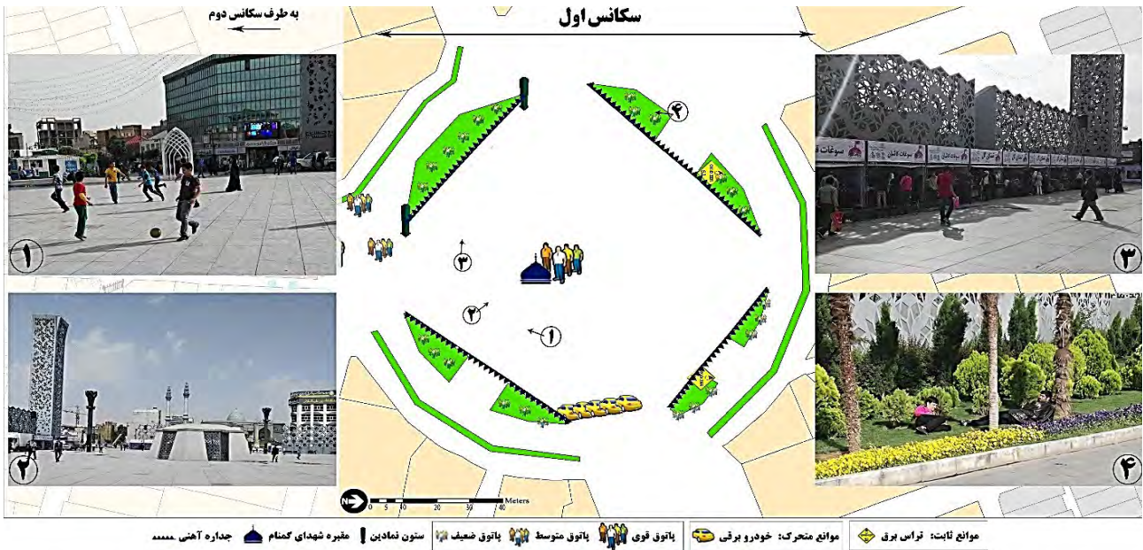
تصویر ۲: بیان تصویری خصوصیات مهم زندگی جمعی، سکانس اول. ۱. بازی کودکان در عصرها. ۲. خلوتی فضای میدان در صبح‌ها. ۳. برگزاری نمایشگاه‌های موقت. ۴. استراحت و پاتوق کردن در باغچه‌ها، مأخذ: نگارندگان.

می‌کنند و به تماشای محیط اطراف و صحبت با یکدیگر می‌پردازند. از دیگر خصوصیات خاص زندگی جمعی در این بخش، وجود افراد منتظر برای طی مسیر با خودروهای برقی در طول روز و البته حضور زنان خیابانی معمولاً در هنگام عصر است (تصویر ۳).