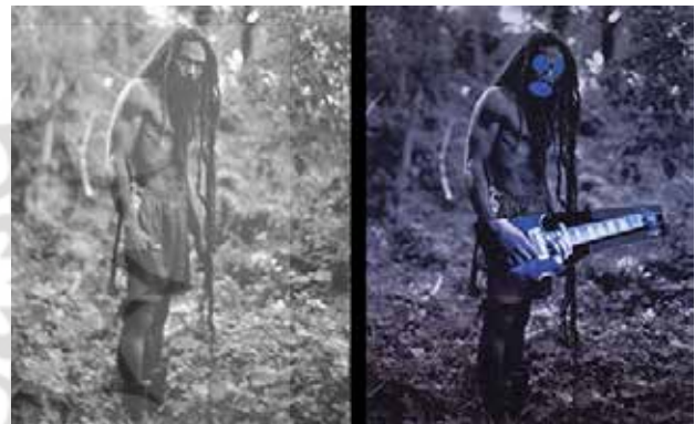
تصویر ۳. راست: اقتباس، اتخاذ و بازیافت=ساخت قطعه خود شما؛ پرنس، چپ عکس از کریوس. مأخذ: www.slideshare.net.

اهمیت امروزشان، که مبتنی بر پیوستگی‌شان در طول زمان فهم می‌شوند و گزارش این رویدادها روایت‌ها را می‌سازد. از این رو آثار معماری و هنری را نیز می‌توان همچون رویدادها پنداشت. جایی که در آن داستانی وجود ندارد و حکایت و ارجاعی نیست. با روایت‌پنداشتن معماری، همچون دیگر روایت‌ها، این هنر، همان قدر که وام‌دار واقعیت است آن را نیز می‌سازد و به تعبیری دیگر جهان خود را شکل می‌بخشد. در بازخوانی هنر و معماری به مثابه روایت و متن، نه بر ایجاد و شکل‌دادن به فهم از حقیقت اثر که بر توالی، درهم‌تنیدگی کنش‌ها و رویدادها تأکید داریم. این نوع خوانش با تفسیر فرق دارد.