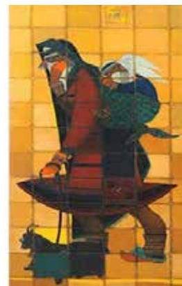
تصویر ۹. تابلوی زن کرد قوچان.

تفسیر می‌کند. در رویکرد معاصر یکتایی اثر برآمده از نبوغ، امری بیان‌ناشدنی است و دریافت ما از نبوغ و تعریف آن متأثر از عوامل اجتماعی و مفهومی ساخته اجتماع است. البته نمی‌توان ادعا کرد استعداد بی‌معنا و بی‌اثر است اما نگرش جامعه و اجتماع به نبوغ، تعریف و بازشناسی آن و هدف از آن، مبتنی بر ساختار اجتماعی‌اند. هر کنش تازه‌ای، همچنان که توان بهبود و ارتقاء کنشی موجود یا راه‌حل پیشینی را دارد، توأمان از آبخوری می‌نوشد که پیشینیان برایش فراهم آورده‌اند و کم‌تر خودسرانه است، به نظر وسواس در خلق اثری یکتا، کنشی برای هدر دادن دانش، زمان و منابع باشد. در پاسخ پرسش دوم، محتوای سکناس‌ها و تصاویری که یک فرم و اثر گرته‌برداری شده به ما ارائه می‌دهد، مملو از تمهیدات و ترفندهایی نمایشی و ظاهراً