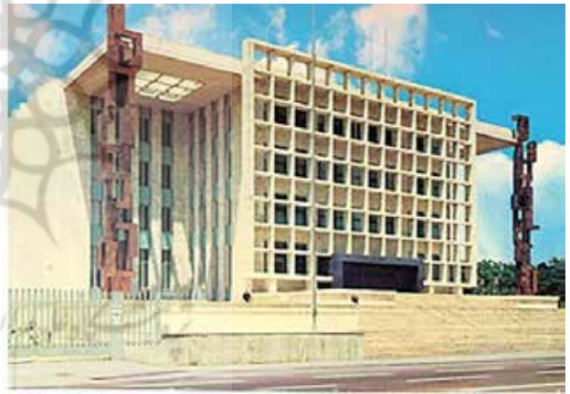
تصویر ۸. مجلس سنا اثر غیایی و فروغی.

تفسیر می‌کند. در رویکرد معاصر یکتایی اثر برآمده از نبوغ، امری بیان‌ناشدنی است و دریافت ما از نبوغ و تعریف آن متأثر از عوامل اجتماعی و مفهومی ساخته اجتماع است. البته نمی‌توان ادعا کرد استعداد بی‌معنا و بی‌اثر است اما نگرش جامعه و اجتماع به نبوغ، تعریف و بازشناسی آن و هدف از آن، مبتنی بر ساختار اجتماعی‌اند. هر کنش تازه‌ای، همچنان که توان بهبود و ارتقاء کنشی موجود یا راه‌حل پیشینی را دارد، توأمان از آبخوری می‌نوشد که پیشینیان برایش فراهم آورده‌اند و کم‌تر خودسرانه است، به نظر وسواس در خلق اثری یکتا، کنشی برای هدر دادن دانش، زمان و منابع باشد. در پاسخ پرسش دوم، محتوای سکناس‌ها و تصاویری که یک فرم و اثر گرته‌برداری شده به ما ارائه می‌دهد، مملو از تمهیدات و ترفندهایی نمایشی و ظاهراً