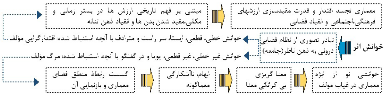
تصویر ۷. فرایند خوانش اثر.