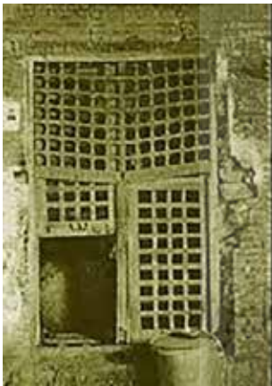
تصویر ۱۰. سقاخانه گذر هارونیه اصفهان.

ضیاءپور در بیان آثارش می‌گوید: «طرح ساده چهار گوشه در تابلوهای من، به صورت القایی عمل می‌کنند مانند القاء به کاشی‌بودن؛ معرف ایرانی، اسلامی و شناخته جهانیان است. وسیله آزادی در جابه‌جایی رنگ، در نوآوری دارای اهمیت است. گویای اصل بینش فلسفی من در جهان زندگی است ... از دنیای بیرون است که از راه دید، ذخایری فزاینده بر ذخایر درون می‌افزاید و این ذخایر، از نظر ما دارای شکل آشنا نیستند و هر کدام از راه تداعی‌ها به ذهن می‌رسند ... شکل‌های بینابین، شکل‌های واسطه‌ای هستند (نه شکل طبیعت محض‌اند و نه شکل‌های مثالی بی‌فرم و سامان هستند) بلکه به صورت رابطی، بین آشنا و ناآشنا، شکل‌های مثال‌گونه می‌نمایند و در ذهن، شکل‌هایی را به صورت ناقص و ساییده (نسبت به طبیعت آشنا) قابل تصور می‌کنند. به کمک شکل‌های اشارتی این رابطه بینابین است که ما باید به دنیای پیچیده درون وارد شویم ... اما اشارات