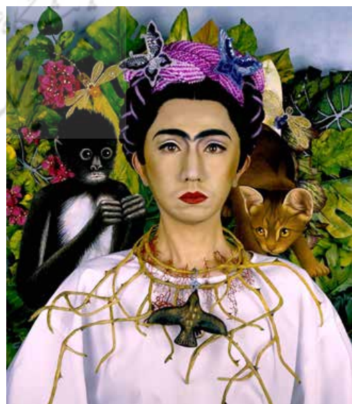
تصویر ۴. گفت‌وگویی درونی با فریدا کالو، موریمورا ۱۷ .

این خوانش توأمان معلوم است و مجهول، در هر تفسیری، شرحی، احوالی، کشفی و شهودی که به تعداد فراوان و طی هزاران سال تلمبار شده‌اند. پس این خوانش از نوع تفسیر نیست ... وضوح و تمایز این خوانش به سریت سر می‌ماند (دریدا و لاکان، ۱۳۹۵: ۱۴). «کالر» آن را «لذت آفرینش مدام» می‌خواند (Culler, 1975: 248). آنچه ناگزیر است، میل به دانستن است و آنچه لذت می‌بخشد، اکتشاف است (Goodman, 1976: 258). لذت این بازی، با گذر از اقتدارگرایی مؤلف، پس از آن هژمونی منتقد و فراتر رفتن از هاله اتوگرافی (تک‌امضایی) گرداگرد اثر، معطوف به خواننده است. خوانش اثر همراه با مرگ مؤلف، با تأکید بر رابطه مخاطب با ابژه تحقق می‌یابد. خوانش مستقل فرم و منطقی ورای ویژگی‌های ضمنی آن (مقتضیات عملکردی، زمینه و بستر طرح و ...) اهمیت دارد و بازتعریفی از رابطه انسان مرکز‌زدایی‌شده با هستی معاصر ارایه می‌دهد؛ تنها مؤلف، سوژه و زاینده اثر تلقی نمی‌شود و اثر در غیاب مؤلف به حیات خود ادامه می‌دهد. این‌گونه معماری از ابژه (محصول عینی) به سوژه (محصول ذهنی، قابل تفسیر) تبدیل می‌شود. در نگاه میان‌متنی، ایده‌های خلاقانه، حتی آنها که کاملاً