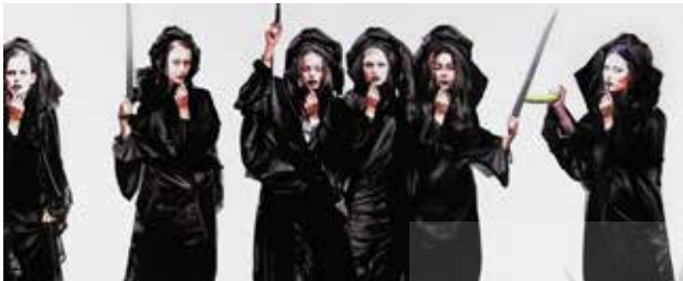
تصویر ۱۸. اغواء اثر افشین هاشمی، رنگ‌وروغن، ۲۰۱۰ میلادی. ابعاد: ۲۰۰*۲۹۸ سانتیمتر.