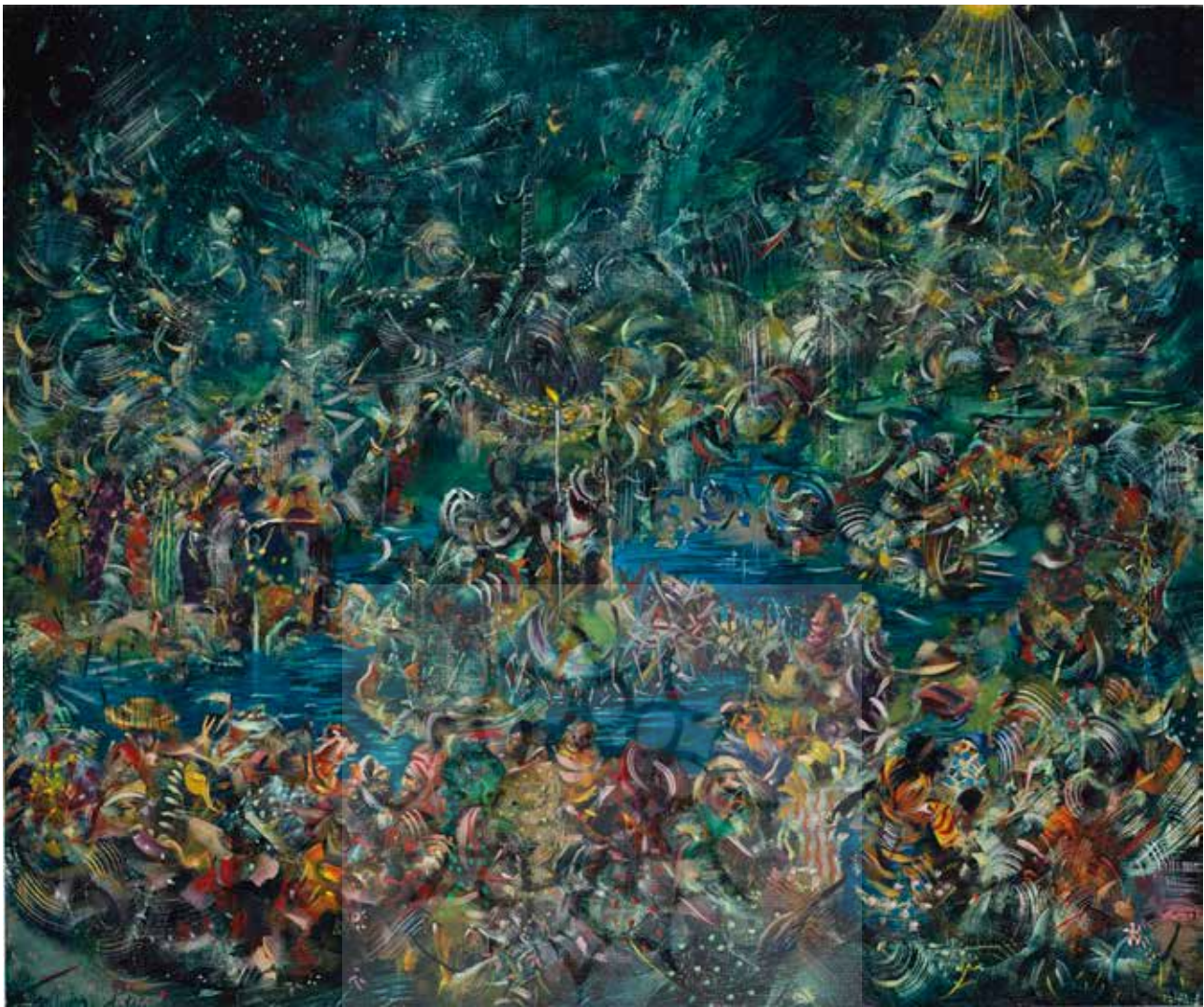
تصویر ۱۱. روشنایی، اثر علی بنی صدر، رنگ و روغن روی بوم، ۲۰۱۰ میلادی. ابعاد: ۹۱،۵ * ۷۶،۵ سانتیمتر.

مانند گلدوزی، سنگ دوزی یا پولک دوزی (تصویر ۱۲ و ۱۳). او در تابلوی «عشق» با صدها قطعه درخشان، از جمله کریستال های گران قیمت کمپانی سواروسکی ۲۳ ، واژه عشق را به خط نستعلیق مصور کرده است. شاید تصور معمول از هنر فاخر نخبگان زیرسؤال رفته باشد؛ یا آن طور که برخی منتقدان، کار مشیری را به سبب کاوش طنزآمیز در مرز باریک (و نامحسوس) مصرف گرایی ۲۴ و هنر به عنوان ابژه مصرف ستایش می کنند (Babaie, 2011: 142) حساسیت او به تناقضات دنیای هنر قابل توجه باشد، اما زمانی که این تابلو در حراج بونامز ۲۵ ، ۱ میلیون و ۴۸ هزار دلار چکش می خورد و مشیری را به اولین هنرمندی در خاورمیانه بدل می سازد که اثری را بیش از ۱ میلیون دلار به فروش رسانده، فقط نوع کالای فروخته شده (در رده خود) تغییر یافته است؛ اگر تاکنون خرید و فروش تابلوهای خاصی به