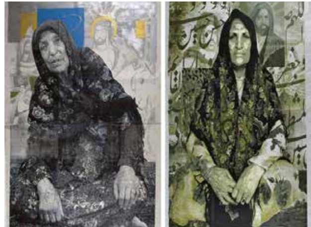
تصویر ۱۴. مادروخواهر (از مجموعه تروریست)، اثر خسرو حسن‌زاده، سیلک‌اسکرین با اکریلیک روی بوم، ۲۰۰۴ میلادی. ابعاد تصویر راست: ۳۰۸*۲۰۴. ابعاد تصویر چپ: ۳۰۰*۲۱۷ سانتیمتر.

جالب توجه باشد، اما امید به تأثیر اجتماعی گسترده‌تر از جمله تقابل یا به‌چالش‌گرفتن نگاه بیننده‌ای که با ذهن آکنده از پیش‌فرض‌ها با مردم شرق روبرو می‌شود، در توان چنین رویکردی به هنر نیست. در نهایت، ضعف نقادانه در روندی معکوس موجب می‌شود محتوای موردنقد در قالب‌هایی جدیدتر و خوش‌نماتر تولید شود. شادی قدیریان با عکاسی در فضای خانگی یا استودیو، در رویکردی به‌مراتب ضعیف‌تر که بر فرمولی ابتدایی از هم‌نشینی تقابل‌برانگیز زن و اشیاء نمادین بنا شده است، تلاش دارد محدودیت‌های اجتماعی زن ایرانی و تنش‌های حاصل از رویارویی سنت و مدرنیته را برجسته سازد (تصویر ۱۹).