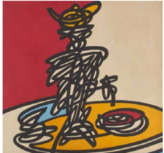
تصویر ۷. سماور، اثر کوروش شیشه‌گران، اکریلیک روی بوم، ۱۹۸۶ میلادی. ابعاد: ۱۳۳*۱۳۳ سانتیمتر. مأخذ: www.artnet.com