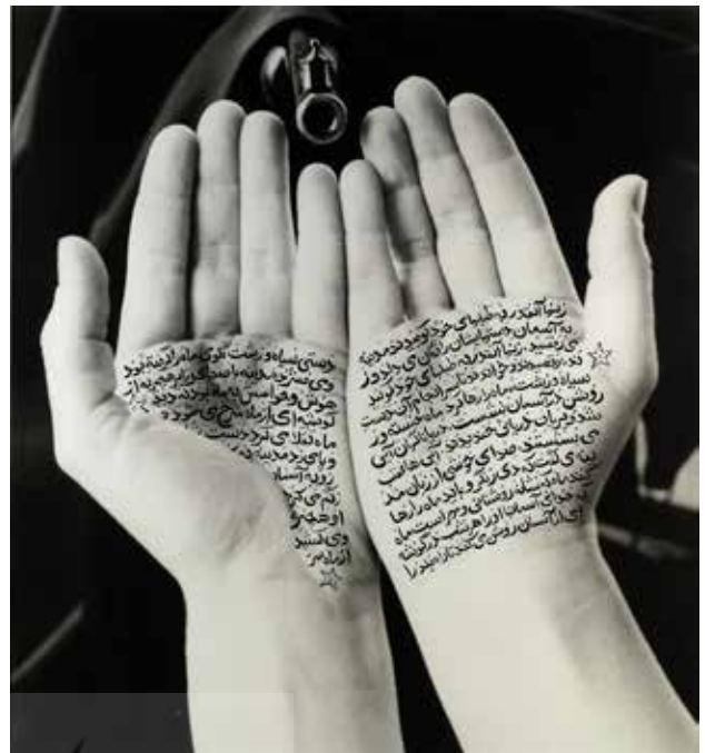
تصویر ۱۶. متولیان انقلاب (از مجموعه زنان الله)، اثر شیرین نشاط، نوشته‌های جوهری بر چاپ نقره ژلاتینی. ابعاد: ۱۱۰*۹۹.۷ سانتیمتر.