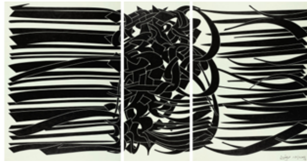
تصویر ۳. ضیافت، اثر محمد احصایی، رنگ‌وروغن روی بوم، ۲۰۰۹ میلادی. ابعاد: ۵۶۴*۲۶۰ سانتیمتر. مأخذ: www.christies.com