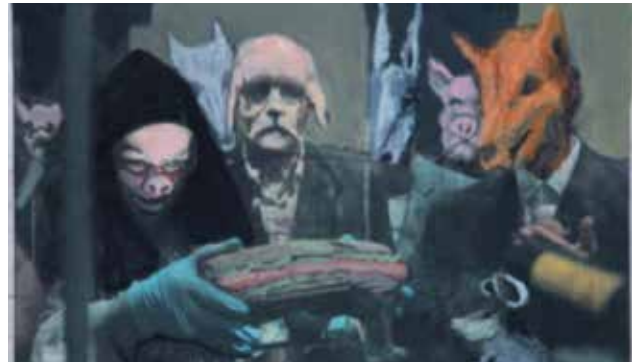
تصویر ۲۱. منشور کوروش به خانه بازمی‌گردد (شهر قصه)، اثر رکنی حائری‌زاده، جسو، آبرنگ و جوهر روی چاپ کاغذی، ۲۰۱۱ میلادی. ابعاد: ۳۰*۲۱ سانتیمتر. مأخذ: Farzin, 2014:12.