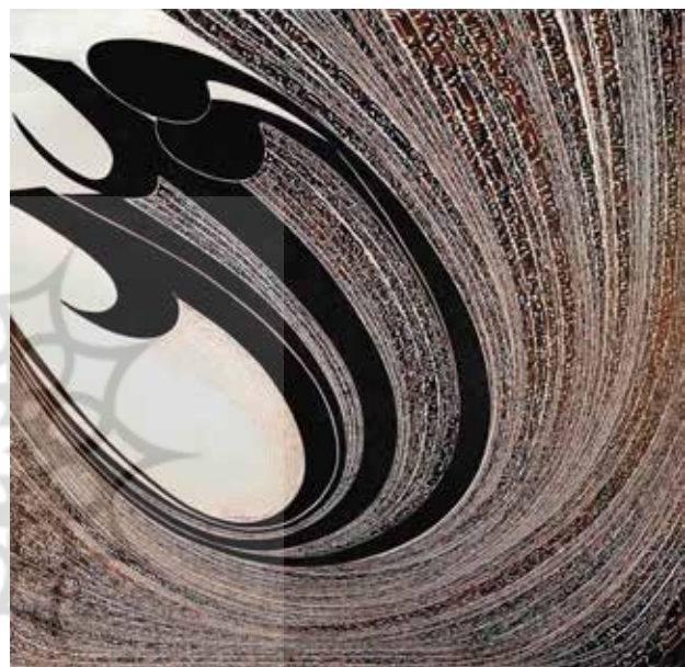
تصویر ۵. عشق، اثر نصرالله افجه‌ای، اکریلیک روی بوم، ۲۰۱۰ میلادی. ابعاد: ۲۰۰*۲۰۰ سانتیمتر.

دورگه‌گی همی بابا تصور می‌شود که به عقیده فیشر «در سال‌های اخیر، محبوب‌ترین الگوی بیان میان فرهنگی [در عرصه تولیدات هنری] بوده است» (Fisher, 2005: 237). دورگه‌گی به معنای آمیزش [انقلابی] قومیت‌ها و فرهنگ‌ها، به گونه‌ای است که شکل‌های فرهنگی تازه‌ای تولید شود [...] به عقیده بابا، دورگه‌گی سلاح توانمندکننده و قدرت‌بخشی برای به‌حاشیه‌رفتگان فرهنگی است؛ زیرا هم خلوص نژادی و فرهنگی و هم تفاوت فرهنگی [ویژه و سفارشی] که دربردارنده‌ی میل به اگزوتیسم است را پشت سر می‌گذارد. [...] دورگه‌گی، هویت‌های تکثرگرایی در فضای میان فرهنگی (فضای سوم) می‌سازد که ابزار مقاومت در برابر هویت‌های یکدست و واحد است (Nayar, 2015). آنچه بابا به عنوان مقاومتی مؤثر در برابر تعیین هویت