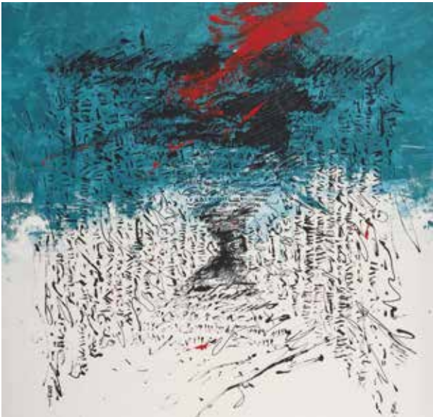
تصویر ۹. بدون عنوان، اثر گلناز فتحی، رنگ‌وروغن روی بوم، ۲۰۰۳ میلادی. ابعاد: ۱۴۷*۱۳۴ سانتیمتر.