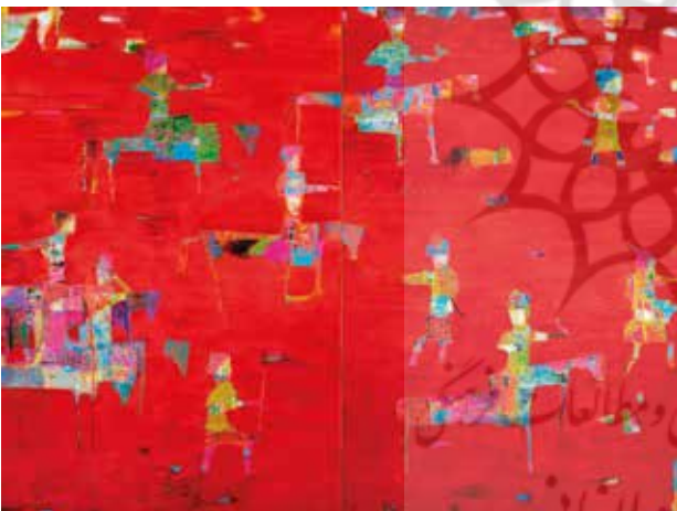
تصویر ۱۰. شکار خونین، اثر رضا درخشانی، رنگ‌وروغن روی بوم دولته‌ای. ۲۰۱۶ میلادی. ابعاد هر پانل: ۱۸۳*۱۲۲ سانتیمتر.