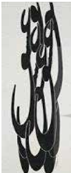
تصویر ۶. عشق، نصرالله افجه‌ای، رنگ‌وروغن روی بوم، ۱۹۸۴ میلادی. ابعاد: ۱۵۰*۵۰ سانتیمتر.