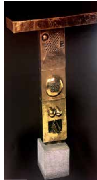
تصویر ۱. شاعر و قفس و لبل، اثر پرویز تناولی، جنس برنز، ۱۳۴۹ شمسی. ارتفاع ۹۲ سانتیمتر. مأخذ: کشمیرشکن، ۱۳۹۴: ۱۱۱.

بازی زیباشناسانه فرو می‌کاهد، مورد حمله قرار می‌دهد» (ایگلتون، ۱۳۸۳: ۴۵). فرمالیسم ایرانی برای معین کردن بافت منطقه‌ای، نشانه‌های خاص فرهنگی را دستمایه قرار می‌دهد؛ با توجه به اینکه فرم‌گرایی مستلزم به‌حاشیه‌راندن یا حذف محتواست، هویت فرهنگی بدل به آرایه‌ای سطحی می‌شود که تنها به عنوان افزونه‌ای تمایزبخش، هویت فرهنگی-ملیتی «کالا» را تغییر می‌دهد. گرایش‌های فرمالیستی جدیدتر، حتی در رویکردی پسامدرنیستی نیز از ایجاد تحول واقعی در ماهیت اجزای متکثری که به ساختار تصویر شکل می‌دهد، ناتوانند. نمایندگان این رویکرد، عمدتاً به «واسازی» هویت‌های شرقی و غربی در آثارشان شهرت یافته‌اند. رضا درخشانی در تابلوهایی پُرکار با گیرایی بصری عمیق، موضوعاتی برگرفته از ادبیات و نگارگری سنتی ایران را (صحنه‌های شکار و بزم، انار، باغ ایرانی، خوشنویسی و ...) در سبک اجرایی اکسپرسیونیسم انتزاعی به نمایش می‌گذارد (تصویر ۱۰). رویکرد مشابهی را علی بنی‌صدر در «تلفیق فضای نگارگری سنتی با سبک هیرونی موس بوش» (هنرمند اروپایی قرن ۱۵) به نمایش می‌گذارد (Millet, 2016)؛ (تصویر ۱۱). ساختارشکنی در کار این هنرمندان چیزی بیش از ترکیب زبان تصویری شرق و غرب نیست. گرایش به هم‌آمیزی شرقی-غربی، از مشغولیت‌های هنرمندان معناگرایی چون آیدین آغداشلو و بسیاری از هنرمندان جوان‌تر که از دغدغه‌های فرمی فراتر رفته‌اند نیز هست. این هم‌آمیزی عموماً مصداقی از