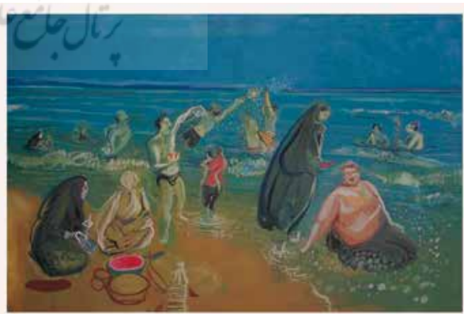
تصویر ۲۰. شمال، اثر رکنی حائری‌زاده، نقاشی روی بوم دولته‌ای، ۲۰۰۸ میلادی. ابعاد هر پانل: ۲۰۰*۳۰۰ سانتیمتر.