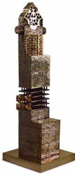
تصویر ۲. شاعر و قفس، اثر پرویز تناولی، جنس برنز، ۲۰۰۸ میلادی. ارتفاع: ۱۵۱ سانتیمتر. مأخذ: www.artnet.com