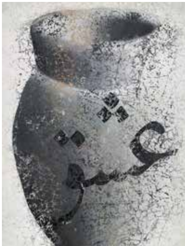
تصویر ۱۳. عشق، اثر فرهاد مشیری، رنگ‌وروغن و اکریلیک روی بوم، ۲۰۰۳ میلادی. ابعاد: ۲۷۱*۱۸۱ سانتیمتر.