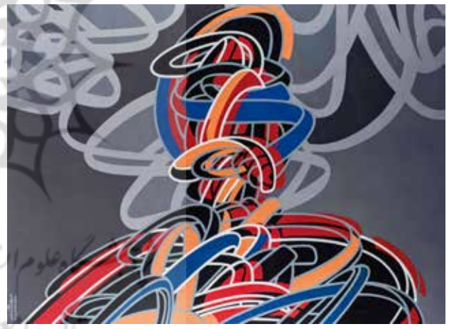
تصویر ۸. فیگور، اثر کوروش شیشه‌گران، اکریلیک روی بوم، ۲۰۱۴ میلادی. ابعاد: ۱۶۰*۲۰۰ سانتیمتر.

کمیک استریپ، آگهی‌های تبلیغاتی، بسته‌بندی و تصاویر تلویزیون و سینما شمایل‌شناسی این هنر را پدید آوردند» (Chilvers & Glaves-Smith, 2009: 1552). ویژگی فرهنگ بصری عوام زرق‌وبرق، ابتذال، پیش‌پاافتادگی یا به اصطلاح کیفیت «کیچ» آن بود که در تقابل با فرهنگ فاخر نخبگان پنداشته می‌شد. پاپ‌آرت به عنوان نمونه‌وارترین شکل پست‌مدرنیستی از بیان هنری (در رویکرد به فرهنگ عامه‌پسند و سلیقه کیچ) قصد داشت جدیت هنر فاخر را به سخره بگیرد؛ هر چند در نهایت به دلیل ضعف شیوه‌های نقادانه، تسلیم سرمایه‌داری متأخر شد و ارزش بازاری