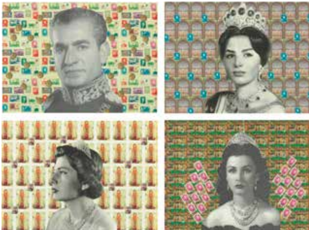
تصویر ۱۵. شاه و سه ملکه‌اش، اثر افسون، فوتوکلاژ چاپ شده روی کاغذ، ۲۰۰۹ میلادی. ابعاد مجموع چهارعکس: ۱۶۴*۵۸ سانتیمتر.