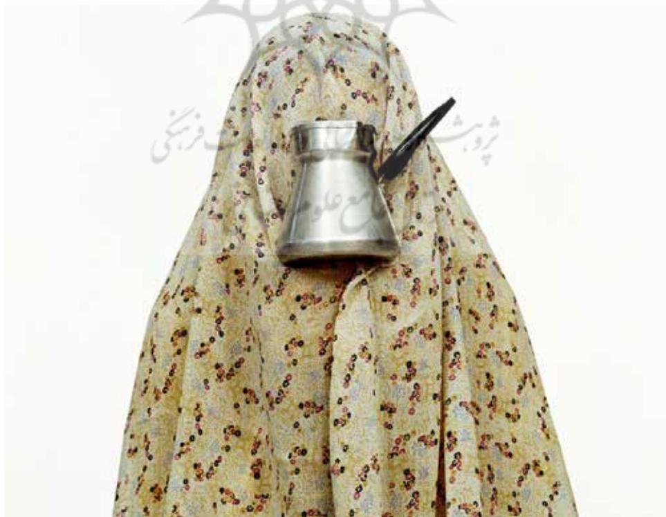
تصویر ۱۹. #۱ (از مجموعه مثل هرروز)، اثر شادی قدیریان، C-print، ۲۰۰۰ میلادی. ابعاد: ۵۰*۵۰ سانتیمتر.