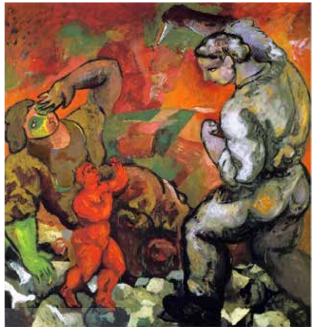
تصویر ۲. ساندرو کیا، دشمنی خانواده، ۱۹۸۴، رنگ روغن روی بوم. مأخذ: بونیتو اولیوا، ۱۳۹۱.

تصویر به صحنه تئاتر نزدیک‌شده تقابل دو نیروی مثبت و منفی هم در درون آدمی تجلی‌یافته و هم در صحنه روایتی و نمود بیرونی و محیط پیرامون متجلی شده است. وجود کمی نور و روشنایی بر پیکره تیره مرد می‌تواند مدلول پاکی روح و نهاد انسانی باشد که باید آن را در وجود خود جستجو کرد، تقابل انسانی نیروی مثبت و منفی، در کل تصویر بین پیکره‌های در حال درگیری و در وجود خود اشخاص، تقابل اصلی تصویر است و می‌تواند به مفهوم فرهنگ و تمدن حاکم بر جامعه امروز بشری باشد که هم با خود درگیر و هم با دیگران در تقابل و درگیری بوده و آرامش زندگی را از خود و حتی سازندگان نسل آینده می‌گیرند، از هم پاشیده‌شدن کانون خانواده‌ها و رنج و مشکلات کودکان و تخریب روحیه آنان مسائل پیچیده و مشکلات بسیاری را بر جهان امروز تحمیل کرده که عواقب خطرناکی را نیز در آینده به دنبال خواهد داشت و جامعه جهانی را نیز مضطرب ساخته است و جنایت و پرخاشگری‌های جوانان را به دنبال خواهد داشت. نابودی ارزش‌ها، باورهای فرهنگی و رفتارهای اجتماعی در نظام خانواده اختلال ایجاد کرده نابسامانی، آشفتگی، بی‌توجهی به یکدیگر، برخورد و درگیری، رفتار ناشایست و خشونت