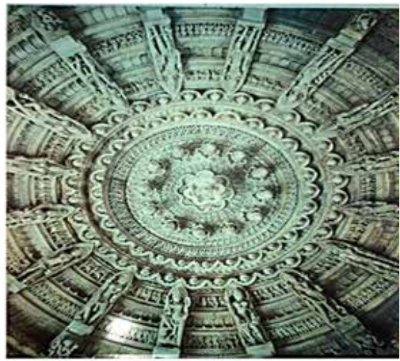
تصویر ۱. سمت راست: تزیینات حجاری، معبد کایلاسا الورا، هند. سمت چپ: تزیینات کاشی کاری زیر گنبد مسجد شیخ لطف‌الله دوره صفوی اصفهان.

بشناسد او به وسیله ابزارمندی می‌تواند دایره حواس خود را برای شناخت بهتر گسترده‌تر سازد؛ انسان توانایی این را دارد که به طور قابل توجهی به ژرفای واقعیات جهان رخنه کند. نگاهی هرچند کوتاه به پیشرفت و توسعه علوم در حوزه‌های مختلف در سال‌های اخیر در بازهای به بزرگی ۱۰ -۲۵ تا ۱۰ -۲۷ نشان می‌دهد ۱ که انسان به گمان خویش گستره وسیعی از واقعیات عالم را تحت سلطه خود درآورده است و آنچه او را به این سطح شناخت از عالم رسانده است ابزارمندی اوست، اما این نکته قابل تأمل است که ابزارمندی انسان نیز محصول کاوشگری او در جهان اطراف، همراه با کاربرد علم و خلاقیت و دست آخر ساخته خود اوست و به نوعی زیر مجموعه توانایی‌های او قرار گرفته و محدود است. نوع ارتباط فکری که انسان با اشیای پیرامون خود برقرار می‌کند به وجود آن اشیاء بستگی دارد در اشیایی که صرفاً وجود ماده‌ای دارند به مشاهده حضوری پرداخته می‌شود و یا برای شناخت کامل‌تر از کمک ابزار استفاده می‌شود، که آن هم، چنانکه گذشت لزوماً به شناخت کامل نمی‌انجامد؛ اما در مورد آن دسته از اشیایی که علاوه بر جنبه ماده‌ای و نفسانی که با قوای حسی انسان دریافت می‌شود، دارای کیفیت عقلانی- یعنی ویژگی‌هایی که صرفاً با تکیه بر حواس دریافت نمی‌شوند- نیز هستند حواس انسان و ابزارمندی او کافی نبوده و تعقل و به کار بردن برهان، لازم است (طباطبایی، ۱۳۹۰: ۱۵ و ۳۱). بدین قرار انسان جهان اطراف خویش را به وسیله حواس خود درمی‌یابد، اما آنچه که در ظاهر توسط حواس او دریافت و شناخته می‌شود شامل آن چیزهایی است که دارای وجود نفسانی و ماده‌ای هستند و آن دسته