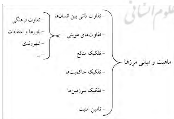
شکل شماره ۲ ماهیت و زمینه‌های شکل‌گیری مرزها