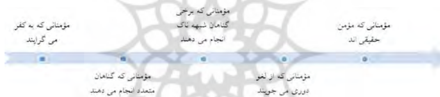
شکل شماره دو: پیوستار برخی از مراتب مؤمنان در قرآن کریم

أحسنوا...» (مائده: ۹۳) و مؤمنانی هستند که از کوچک‌ترین اعمال بیهوده، دوری می‌جویند «قد أفلح المؤمنون (۱) ... و الذين هم عن اللغو معرضون» (مؤمنون: ۳) و مؤمنانی نیز وجود دارند که مؤمن حقیقی اند «إضا المؤمنون الذين إذا ذكر الله وجلت قلوبهم وإذا تليت عليهم آياته زادتهم إيماناً وعلی ربهم يتوكلون (۲) الذين يقيمون الصلاة و مما رزقناهم ينفقون (۳) أولئك هم المؤمنون حقا لهم درجات عند ربهم و مغفرة و رزق كريم» (انفال: ۴) که با توجه به عبارت «لهم درجات»، آنان دارای درجه‌اند و در آیه دیگری خود درجه‌اند (جوادی آملی، تسنیم: تفسیر قرآن کریم، ۲۰۹/۱۶). نیز در قرآن کریم مؤمنانی ذکر شده‌اند که بهترین بندگان خداوند «إِنَّ الَّذِينَ ءَامَنُوا وَعَمِلُوا الصَّالِحَاتِ أُولَئِكَ هُم خَيْرُ الْبَرِّ» (بینه: ۷). این مراتب که تنها بخشی از مراتب ایمان است می‌تواند نشان دهد که این مفهوم در قرآن کریم، یک مفهوم فازی است. زیرا در یک سر پیوستار انسان‌های مؤمنی هستند که به کفر گراییده‌اند و در دیگر سوی پیوستار، انسان‌های مؤمن حقیقی هستند و در میانه پیوستار نیز انسان‌های مؤمن با شدت و ضعف بی‌شمار قرار دارند.