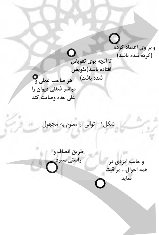
شکل ۱- توالی از معلوم به مجهول