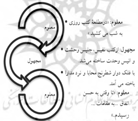
شکل ۲- تغییر از معلوم به مجهول در متن مقامات حمیدی

در کتاب مقامات حمیدی که بیشتر به شکل توصیفی است، میزان کمتری از فعل مجهول مشاهده می‌گردد. برای مثال در جمله «اکنون که صبح اسلام به شام شده است و نفیر غز و عام و ثغر روم را خرقی افتاده است...» (مقامات حمیدی ۱۳۸۹: ۳۹) توصیفی به لحاظ تاریخی از روزگار بیان شده، اما گرهی ایجاد نموده است. زیرا علت و عامل مشخص نشده است. به نظر می‌رسد نویسنده با استفاده از فعل مجهول نوعی گره روایی ایجاد می‌کند. در این کتاب نویسنده در توصیف احوال خود می‌نویسد: «از کتب نفیس، جلیس وحشت و انیس وحدت ساخته می‌شد و با فلک دوار شطرنج محابا و نرد مدارا باخته می‌آمد.» (همان: ۲۱) این جملات وصفی که میان جملائی با فعل معلوم قرار گرفته‌اند در نثر فنی گاه برای پیچیده و فنی‌تر کردن بکار گرفته می‌شوند. زیرا ریسمانی که مخاطب را به دنبال خود می‌کشاند به یکباره گسسته می‌گردد و با حرکت از معلوم به مجهول و بازگشت آن به معلوم نیاز به بازخوانی ایجاد می‌شود. (شکل ۲)