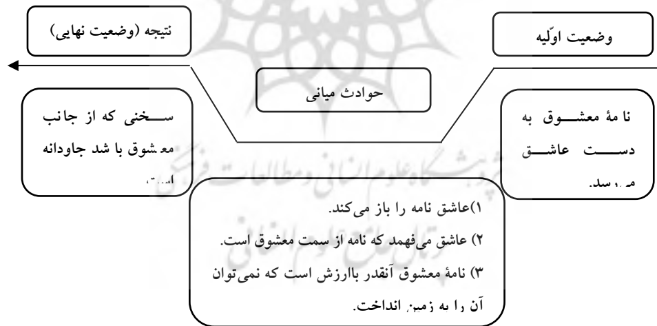
نمودار شماره ۳: ساختار روایی غزل ۸۰

در نمودار شماره ۳ ساختار روایی این غزل آمده است.