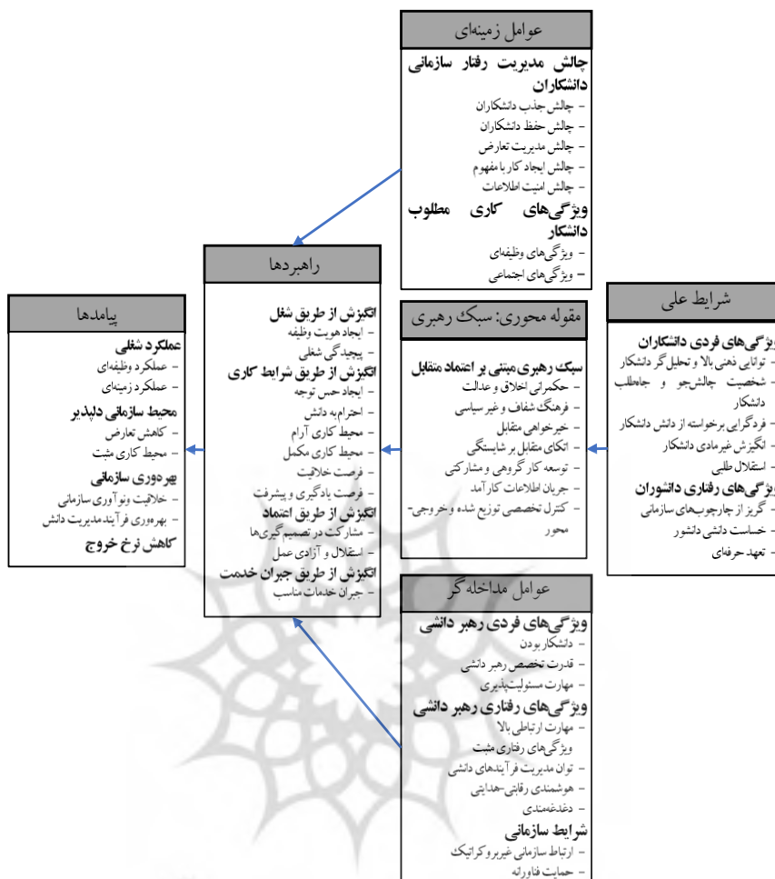
شکل ۲. مدل استخراج شده پژوهش با استفاده از نظریه زمینه‌ای

به عبارت دیگر، کدگذاری انتخابی، یافته‌های مراحل کدگذاری قبلی را گرفته، مقوله محوری را انتخاب می‌کند و به شکلی نظام‌مند آن را به دیگر مقوله‌ها ربط می‌دهد. سپس آن روابط را اثبات می‌کند و مقوله‌هایی را که به بهبود و توسعه بیشتری نیاز دارند، تکمیل می‌کند (لی، ۲۰۰۱: ص ۱۲۷).