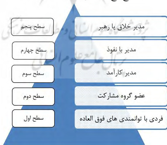
شکل شماره (۱)، رهبری سطح پنج (سیدنقوی و همکاران، ۱۳۸۹)

در شمایی کلی رهبری سطح پنج در شکل شماره (۱) نشان داده شده است.