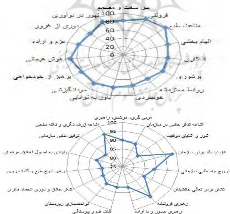
نمودار شماره (۱)، اولویت پیشایندها و پسایندهای رهبری سطح پنج

با توجه به دیدگاه های ارائه شده در مرحله اول و مقایسه آن با نتایج مرحله دوم، در صورتی که اختلاف بین میانگین فازی زدایی شده در دو مرحله کمتر از ۰/۱ باشد در این صورت فرآیند نظر سنجی متوقف می شود. با توجه به اینکه اختلاف میانگین فازی زدایی شده نظر خبرگان در دو مرحله کمتر از ۰/۱ می باشد، خبرگان در مورد پیشایندها و پسایندهای رهبری سطح پنج به اجماع رسیدند و نظر سنجی در این مرحله متوقف می شود. این بدان معنی است که خبرگان به پیشایندها و پسایندهای رهبری سطح پنج شناسایی شده در پژوهش نگاه تقریباً یکسانی داشته اند. با توجه به مطالب عنوان شده، اولویت تمامی عوامل در قالب نمودار شماره (۱) نشان داده شده است.