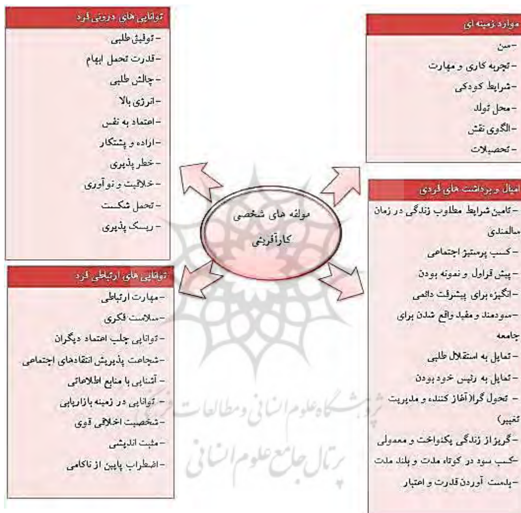
شکل ۱. شاخص‌ها و نماگرها