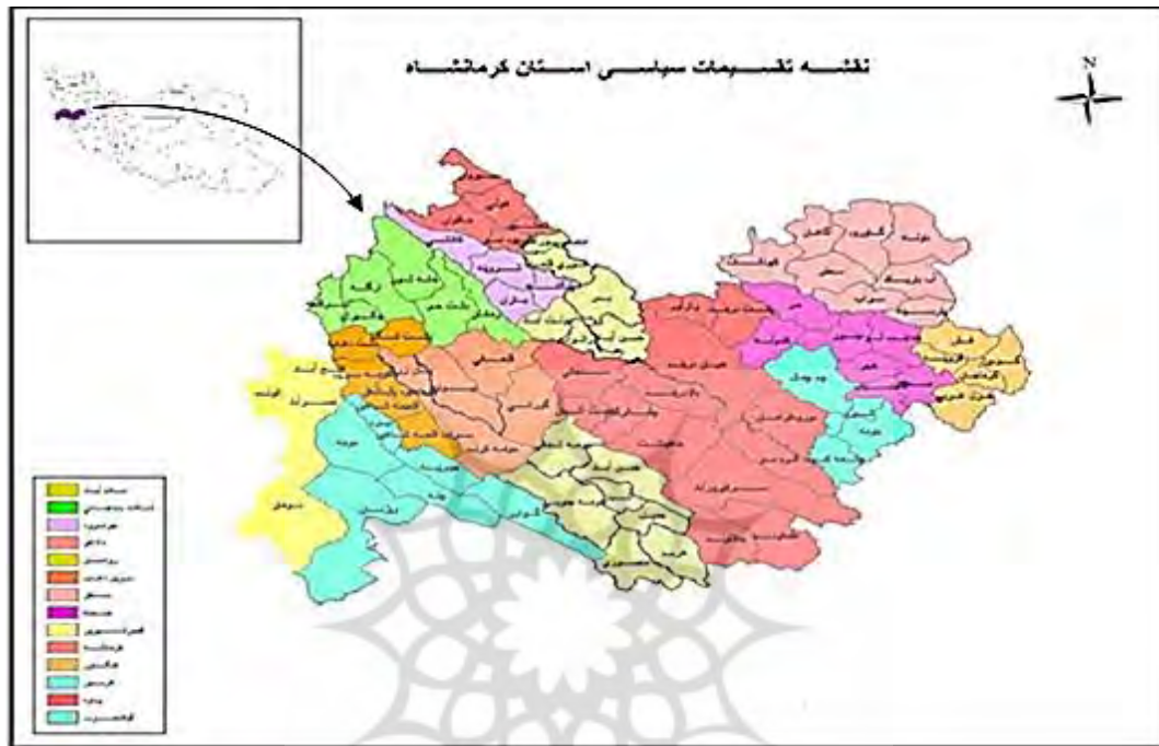
شکل ۱. نقشه موقعیت سیاسی استان کرمانشاه

استان کرمانشاه با وسعت حدود ۲۴۶۲۲۶۲۳ کیلومترمربع در میانه باختری کشور قرار دارد و در محدوده جغرافیایی ۳۲ درجه و ۳۶ دقیقه تا ۳۵ درجه و ۱۵ دقیقه عرض شمالی و ۴۵ درجه و ۲۴ دقیقه تا ۴۸ درجه و ۳۰ دقیقه طول خاوری واقع است (ملکی، ۱۳۸۸: ۲۵). این استان از شمال به استان کردستان، از جنوب به استان‌های لرستان و ایلام و از شرق به استان همدان می‌رسد. از غرب نیز در حدود ۳۳۰ کیلومتر مرز مشترک با کشور عراق است.