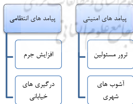
شکل شماره (۱). آسیب‌شناسی شناسی پیامدهای تنوع قومی در استان آذربایجان غربی

مسئله یکپارچگی و انسجام اجتماعی همواره زیرساخت اجتماعی نظام امنیتی یک کشور را تشکیل می‌دهد. تنوع قومی از جمله مقوله‌های نوین امنیت ملی است و از دیرباز جمهوری اسلامی ایران در زمره ممالک دارای تنوع قومی محسوب می‌شود. سرزمین ایران نه تنها در تاریخ گذشته خود بلکه هم‌اکنون نیز دارای ساختار چندقومی و ترکیبی از گروه‌های متنوع قومی است و تنش‌های قومیتی همواره مورد بحث محافل علمی و سیاسی جمهوری اسلامی ایران بوده است. از این رو احساسات هویتی هر یک از اقوام (بر پایه مشترکات زبانی، نژادی، ادبیات، محل سکونت و ...) آن‌ها را به مثابه یک گروه فرعی از جامعه بزرگ‌تر مشخص کرده است؛ و به نحوی است که اعضای هر گروه خود را از لحاظ ویژگی‌های خاص فرهنگی از سایر اعضاء جامعه متمایز تلقی می‌کنند. استان آذربایجان غربی از این امر مستثنا نبوده و از دو قوم شناخته شده و اصلی ترک و کرد در کنار اقوام دیگری همچون ارمنه، آشوری‌ها، بهایی‌ها و اهل حق تشکیل شده که در این استان به فعالیت‌های مذهبی و اجتماعی مشغول هستند. نزدیکی این استان با کشورهای ترکیه و عراق و تأثیرپذیری شهروندان از تفکرات برخی از اقوام، آسیب‌های فراوانی را برای نیروهای انتظامی رقم زده است. مطالعات تاریخی نشان می‌دهد که آسیب‌های امنیتی و اجتماعی متأثر از اختلافات قومی استان به سال‌های گذشته قبل از انقلاب برمی‌گردد و با پیروزی انقلاب اسلامی، به دلیل گسترش شکاف‌های قومی و دخالت‌های برخی گروه‌های معاند در خارج از مرزهای کشور، این اختلافات و آسیب‌ها را می‌توان حول دو محور انتظامی و امنیتی نشان داد (شکل شماره ۱).