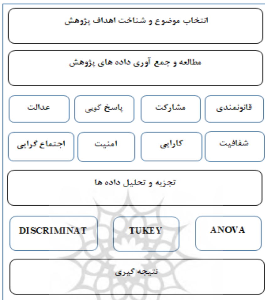
شکل ۱. روند پژوهش