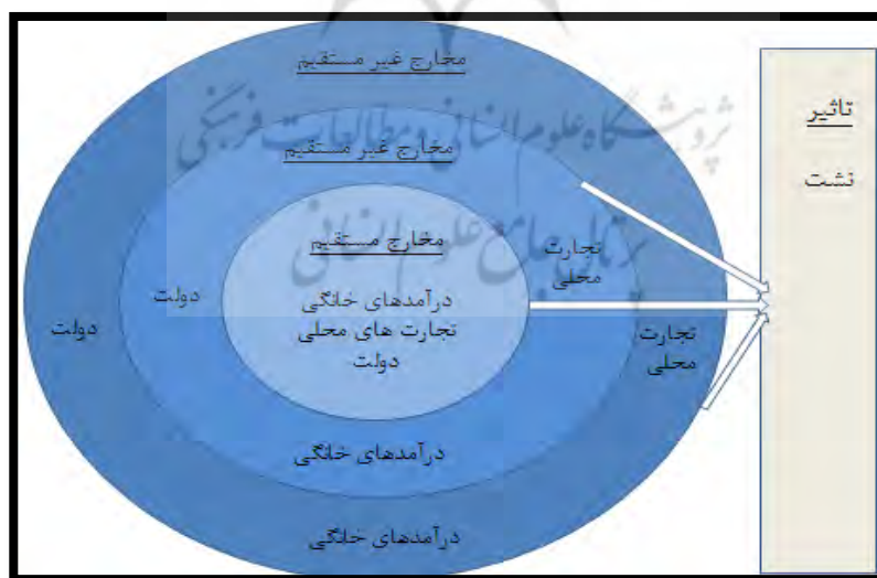
شکل ۲. تأثیر موجی رویدادها

منینگ نیز توضیح می‌دهد که «جشنواره‌ها عملکردی هستند که نمادهای فرهنگی را به شیوه‌ای جالب نمایش می‌دهند» (Manning, 1983: 4). جشنواره‌ها را می‌توان بر ارتباط با جذابیت گردشگری به سه دسته تقسیم کرد: ۱- جشنواره‌های عمومی که درواقع برای ساکنان محلی ایجاد شده‌اند و توسط داوطلبان مدیریت و برنامه‌ریزی می‌شوند. اگرچه این رویدادها اغلب کوچک‌مقیاس‌اند و جاذبه گردشگری محدودی