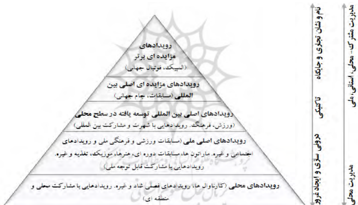
شکل ۱. هرم رویدادهای استراتژیک

رویدادها توسط محققان به زیرشاخه‌های متعددی تقسیم‌بندی شده‌اند؛ در یک طبقه‌بندی از نظر مقیاس دونل و همکارانش (McDonnell et. al 1999)، رویدادها را شامل رویدادهای میلیونی، رویدادهای برجسته، رویدادهای بزرگ و رویدادهای محلی طبقه‌بندی کرده‌اند؛ در طبقه‌بندی دیگری از گلدبلت (Gold blat, 2002:54)، رویدادهای اجتماعی، رویدادهای برجسته، نمایشگاه‌ها، بازارها و جشنواره‌ها، کنفرانس‌ها و جلسات، مراسم مهمان‌نوازی، رویدادهای جزئی، رویدادهای ورزشی و رویدادهای مربوط به دوره‌های مختلف زندگی ذکر شده است. در دسته‌بندی