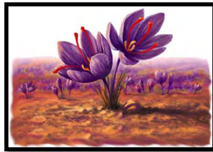
شکل ۴. زعفران، میراث فرهنگی

در برنامه‌ریزی راهبردی لازم است برای تدوین راهبردی نهایی، همه عوامل به‌مثابه بخشی از روند برنامه‌ریزی راهبردی در چارچوب روش تجزیه و تحلیل SWOT در نظر گرفته شود (Bernroider, 2002: 546)؛ از این رو برنامه‌ریزی راهبردی یکی از راه‌های مهم حمایتی برای تصمیم‌گیری و استفاده‌های مشترک در تحلیل سیستماتیک عوامل داخلی و خارجی محیط به‌شمار می‌آید که در آن با تعریف نقاط قوت، ضعف، فرصت‌ها و تهدیدهای پیش‌روی شبکه یا سازمان می‌توان راهبردهایی ساخت که مبنای آن استفاده از فرصت‌ها، از بین بردن ضعف‌ها و مقابله با تهدیدهاست (Yuksel & Dagdeviren, 2007: 3365). در این راستا نتایج حاصل از پرسشنامه محقق‌ساخت که توسط ۳۲ کارشناس و متخصص گردشگری در استان استان‌های مجاور تکمیل شده بود، فرایند کمی‌سازی نتایج در چارچوب مدل MS-SWOT انجام گرفت که نتایج حاصل از این فرایند را در جداول زیر مشاهده می‌کند. جدول شماره ۱ نشان‌دهنده یافته‌های تحقیق حاصل از تحلیل عوامل محیطی IFE در زمینه قوت‌ها (S) و ضعف‌ها (W) بوده که نمره‌های مرتبط نیز استخراج شده است.