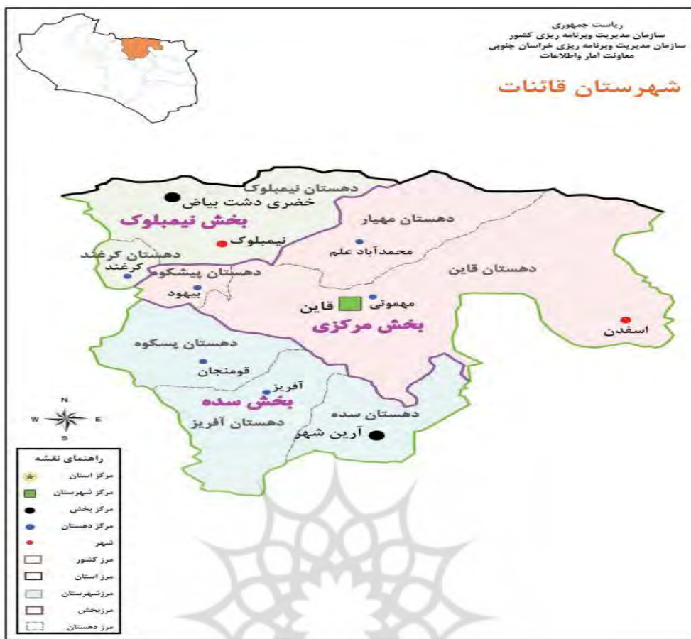
شکل ۳. شهرستان قائنات