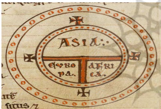
شکل ۲: نقشهٔ تی و او

سویلی» در سدهٔ پانزدهم میلادی در رسم این نقشه اعتقاد بر این بود که خداوند زمین را به شکل منظمی خلق کرده و قدس را در وسط آن قرار داده است. در این نقشه جهت شرق در بالا قرار دارد و جهان به شکل O (نشانهٔ Orbis یا کره و معرف صفحهٔ زمین است) و محصور در اقیانوس رسم شده و دریاهاى سرخ، سیاه و مدیترانه در وسط آن به شکل حرف T دیده می‌شود که دلالت بر Terrorum یا زمینه است؛ رود نیل در سمت راست و رود دُن سمت چپ این دریاها قرار دارند؛ آسیا در نیمهٔ شمالی و اروپا در پایین نیمهٔ غربی و مقابل آفریقا قرار دارد (فنی، ۱۳۸۵: ۷۶).