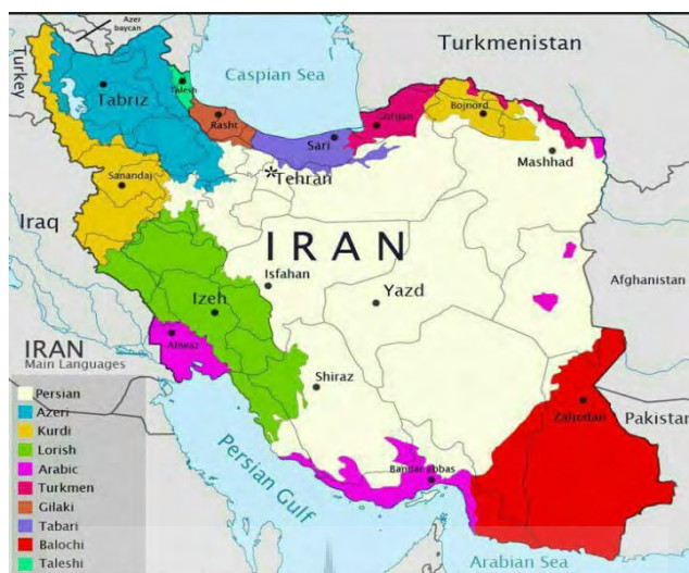
شکل ۵: پراکنش فضایی اقوام در ایران