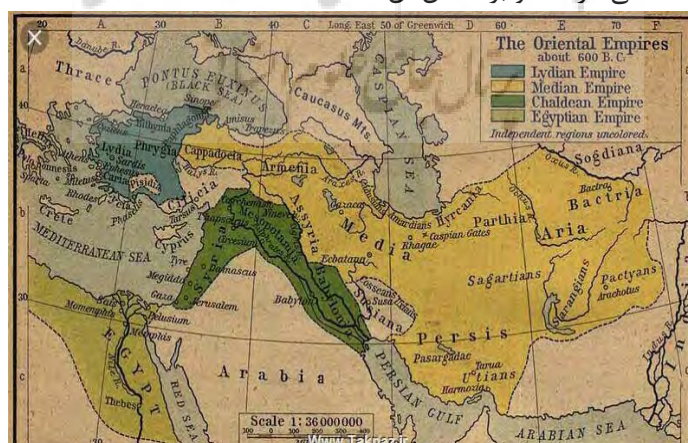
شکل ۴: ایران؛ قدیمی‌ترین کشور دنیا ( https://iranatlas.info/parseh )

زمانی که اسپانیا و پرتغال، دو قدرت جهانی استعمارگری بودند، نقشه‌ای درست کردند و کره زمین را بین خودشان با یک خط، تقسیم کردند. مشابه همین کار را دو قدرت استعماری انگلستان و روسیه با ایران کردند. درست زمانی که ایران به‌عنوان یک بازار اقتصادی در حال کشف شدن بود. چنانچه بخش وسیعی از جنوب ایران را منطقه نفوذ انگلستان عنوان کردند.