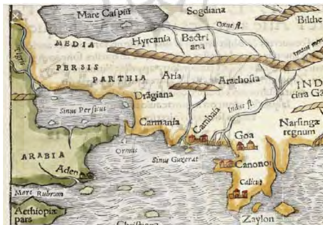
شکل ۳: یکی از نقشه‌های قدیمی خلیج فارس

در سال‌های اخیر مصرانه و مجدانه کوشش شده است تا نام خلیج فارس به «خلیج عربی یا خلیج» تبدیل شود و منافع ملی، اقتصادی، سیاسی و فرهنگی