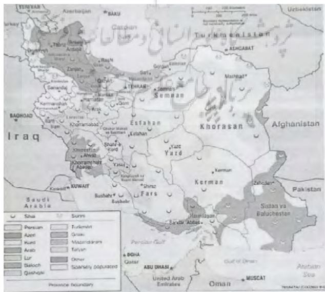
شکل ۶: توزیع فضایی قومیت‌های ایران

«به‌عنوان نمونه، در استان کرمانشاه که یک منطقه کردنشین محسوب می‌شود و درصد بیشتر شهرستان‌های این استان کرد هستند و فارس، لر و عرب در اقلیت هستند؛ ولی در نقشه، عمدتاً و از روی غرض، این طراحان نقشه‌اند که فارس را قوم غالب معرفی می‌کنند. نمونه‌عینی دیگر در این رابطه به آذربایجان غربی برمی‌گردد که در حالت معمول