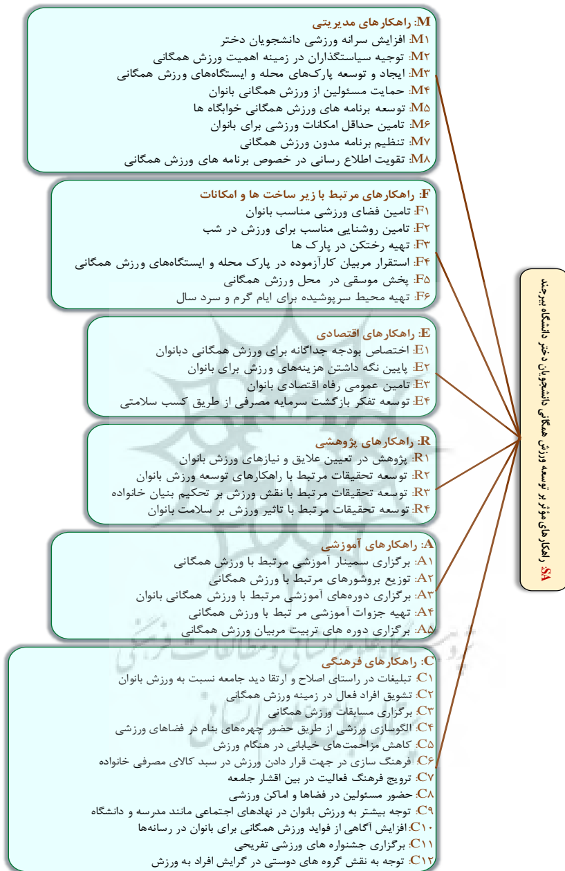
شکل ۱- راهکارهای توسعه ورزش همگانی دانشجویان دختر دانشگاه بیرجند