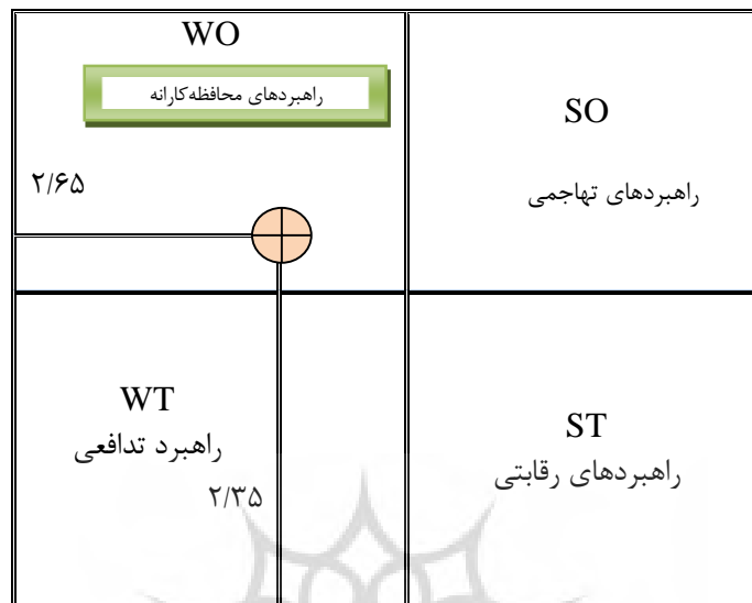
شکل ۱- راهبردهای فدراسیون ورزش دانش‌آموزی

شکل شماره یک ماتریس SWOT و راهبردهایی را که در شورای راهبری تعیین و تصویب شدند، نشان می‌دهد. براساس این شکل، در مجموع، نه راهبرد شامل سه راهبرد SO، یک راهبرد WO، سه راهبرد ST و دو راهبرد WT تدوین شدند.