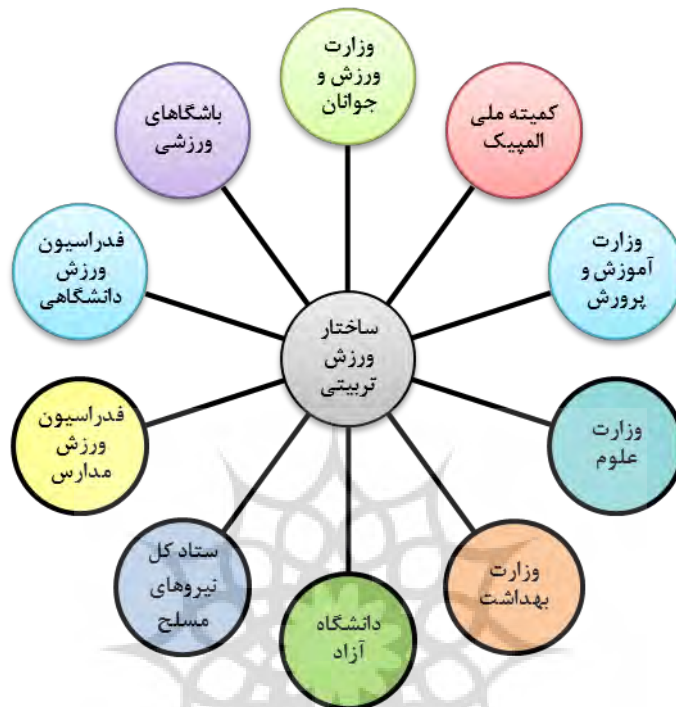
شکل ۲- سازمان‌ها و دستگاه‌های دخیل در مدیریت ورزش تربیتی ایران