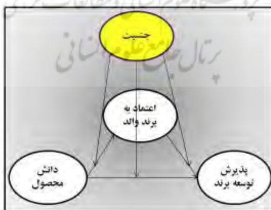
شکل ۱- مدل مفهومی پژوهش؛ محقق ساخته بر اساس مبانی نظری (اثر تعدیلی ۳۳ جنسیت)

با توجه به نتایج مطالعات قبلی و فرضیه‌های طرح‌شده، مدل مفهومی پژوهش حاضر متشکل از سه فرضیه، به‌صورت زیرارائه شده است. بر اساس الگوی مفهومی مذکور، دانش محصول متغیری مستقل، اعتماد به برند والد و پذیرش توسعه برند نیز متغیر وابسته است که متغیر جنسیت در این رابطه نقش تعدیل‌کننده دارد. الگوی مفهومی تحقیق در شکل شماره یک آمده است.